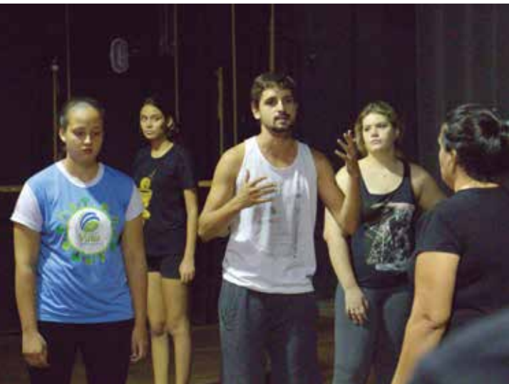
Oficina focou especificamente no trabalho com atores, oferecendo uma noção diferenciada na área artística

Quando a visibilidade for prejudicada, a Polícia Rodoviária orienta que o motorista reduza gradualmente a velocidade e mantenha aceso o farol baixo – tanto de dia quanto à noite. Nunca pare na pista ou ligue o pisca alerta com o veículo em movimento.