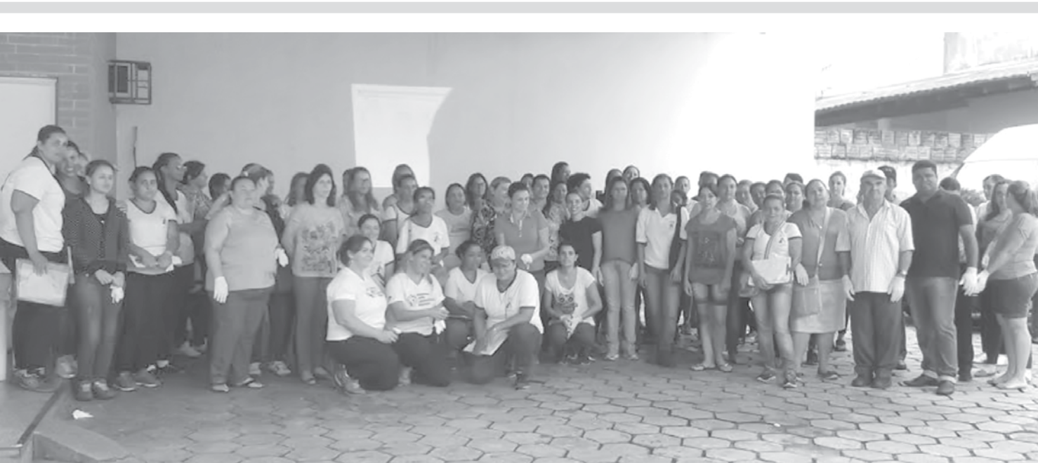
Servidores participantes do primeiro mutirão “Todos juntos contra o Aedes Aegypti”

“Assinamos convênios para um conjunto de equipamentos e ações de uma área estratégica para a população. São convênios importantes porque são celebrados com as Prefeituras, é o governo mais perto da população”, comentou Alckmin. “A questão ambiental, além de estar ligada diretamente à qualidade de vida do nosso povo, embute uma questão ética, que é a essência da política. Além da sustentabilidade ter uma resposta imediata, também é para as próximas gerações. Representa o sentido de bem comum, extremamente relevante na atividade pública”, concluiu o governador.