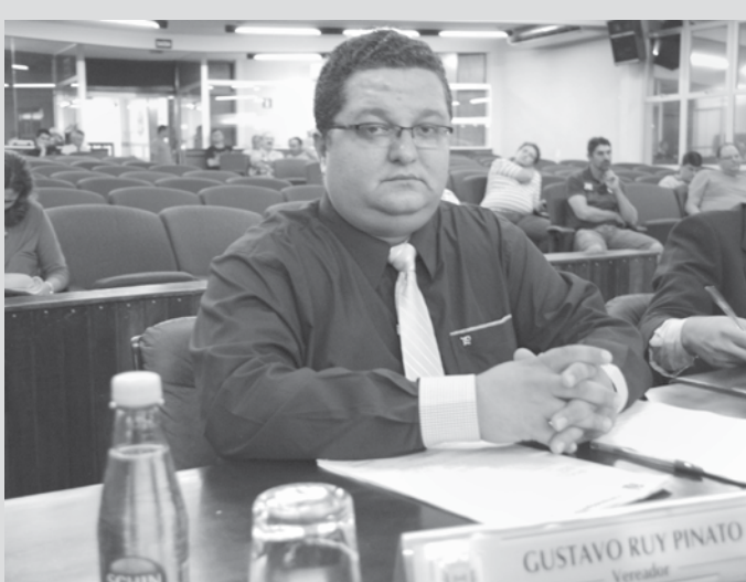
Pinato citou a importância do profissional para o município

Entre as novidades previstas pela Secretaria para ampliar ainda mais o rendimento dos estudantes da rede está a plataforma “Foco Aprendizagem”. Este ano, professores e diretores de escolas terão um diagnóstico mais preciso sobre as habilidades e competências de cada turma por disciplina e receberão um cardápio de intervenções a fim de melhorar ainda mais o nível de aprendizagem dos alunos. O site reúne ainda dados das últimas edições do Saresp e é utilizado como referência na organização dos planos de aula e de reforço.