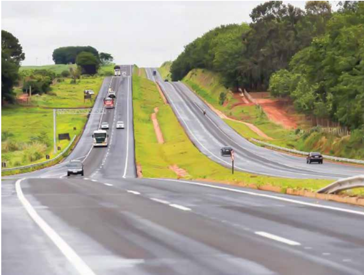
Na região, a SP-320 deve ser a rodovia mais movimentada durante os dias de recesso

O empresário Paulo Almeida, 36 anos, já passou por um apuro ao pegar a estrada – algo que provavelmente poderia ter sido evitado