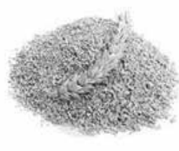
GÉRMEN DE TRIGO