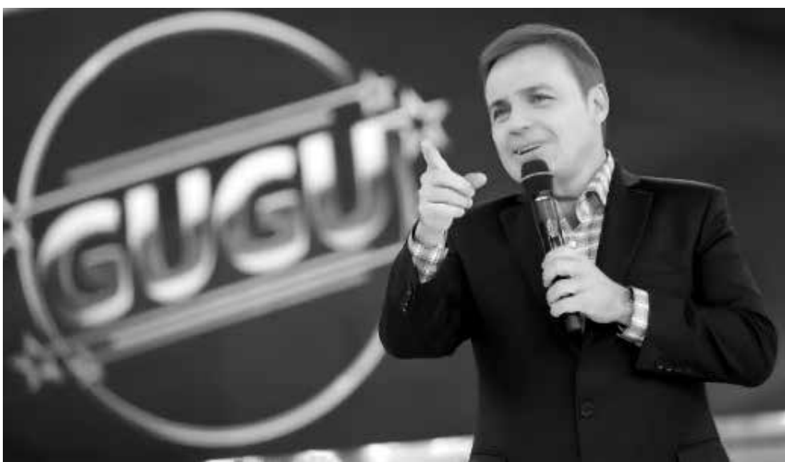
“Estou há 40 anos na televisão, mas continuo aprendendo todos os dias”, disse o apresentador”

ís, além de relembrar o desaparecimento da irmã do lutador, Patrícia, em 2004. Gugu, o programa não terá quadros fixos e faz mistério sobre novas atrações. “Vamos apostar no factual, com conteúdo jornalístico, e também em brincadeiras, convidados no palco, musicais. Uma mistura de informação e entretenimento. Não podemos deixar o informativo de lado, como também temos que oferecer um programa leve e divertido para toda a família. O resto é segredo ainda. Vocês saberão em breve. Aguardem que vem muita coisa boa pela frente”, promete.