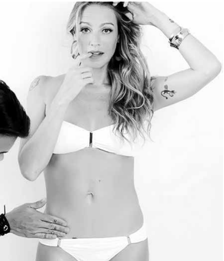
Luana faz ensaio de biquíni cinco meses após dar à luz

Cinco meses após dar à luz, Luana Piovani posou em boa forma para um ensaio de biquíni e resolveu compartilhar a foto em seu Instagram. Mas teve gente que não gostou muito e fez questão de criticar o corpo da atriz de 39 anos.. Segura e sem papas na língua, a mãe de Dom e dos gêmeos Liz e Bem usou a própria rede social para rebater as ofensas. Luana ficou inco-