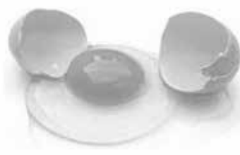
GEMA DE OVO