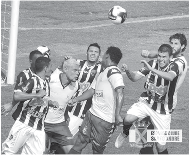
Votuporanguense busca se reabilitar na competição após tropeço, em Santo André, na última rodada da Série A2

e perdeu por 3 a 1. Na classificação, o arquirrival do Fefecê, figura na zona de rebaixamento, na 15ª colocação.