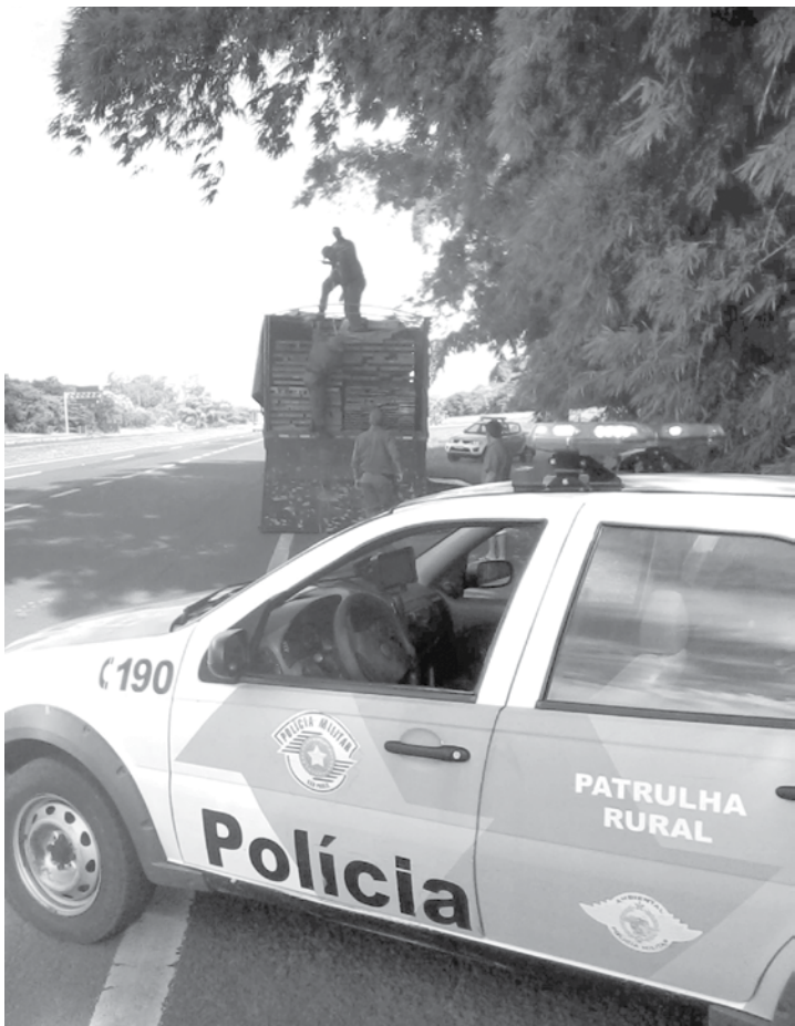
Na região, o 4º Batalhão de Polícia Ambiental é responsável pelas ações de preservação da ordem pública relacionadas à proteção e salvaguarda dos recursos naturais do Estado

Os mananciais, principalmente aqueles destinadas a abastecimento público, foram objeto de fiscalização amiúde por meio de ações de fiscalização das suas condições ambientais e identificação de eventuais problemas