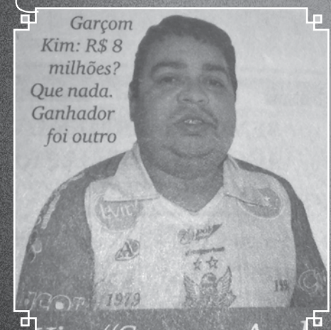
Garçom Kim: R$ 8 milhões? Que nada. Ganhador foi outro