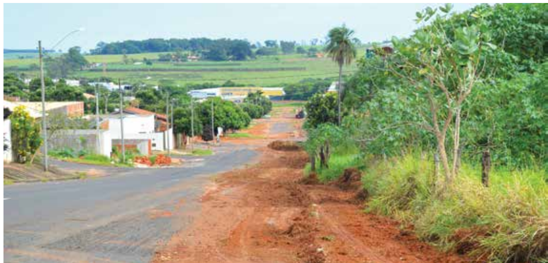
A Prefeitura, através da Secretaria Municipal de Obras, Infraestrutura, Habitação e Urbanismo, realizou reparos na Rua Florisbela, no Jardim Paulistano