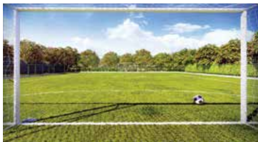
Vista do novo empreendimento “Mais Parque do Lago”, em Fernandópolis

ao Recinto de Exposições, ou pode ligar no telefone 0800 942 90 90.