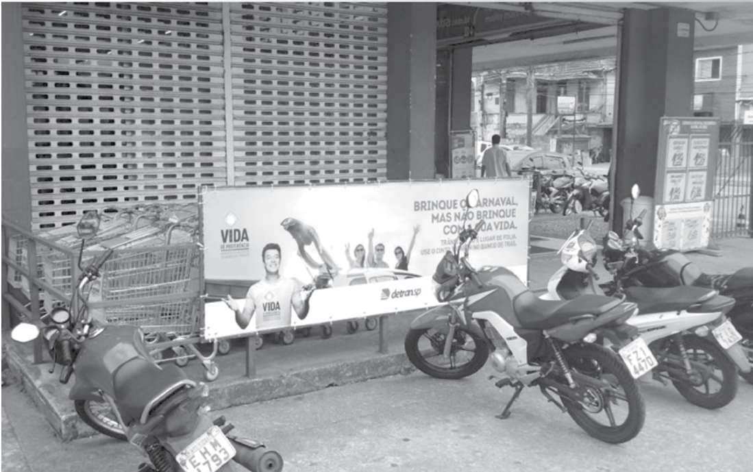
Objetivo da campanha é chamar a atenção dos motoristas para a segurança no trânsito

Além da campanha de cunho educativo, o Detran.SP vai coordenar operações do Programa Direção Segura na capital e em diferentes partes do Estado. O trabalho, que fiscaliza o cumprimento da Lei Seca de forma integrada com as polícias Civil, Mili-