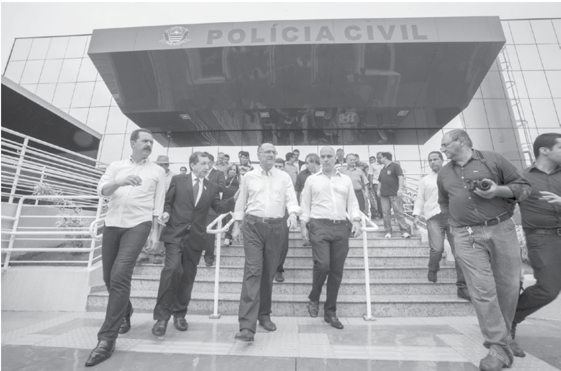
Geraldo Alckmin e Alexandre de Moraes na Seccional de Polícia de Fernandópolis no mês de janeiro