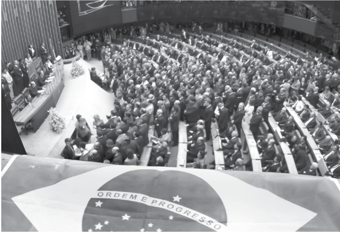
Será aberto espaço, pelo prazo de 30 dias, para o troca-troca

O argumento de parlamentares favoráveis à mudança era o de evitar que