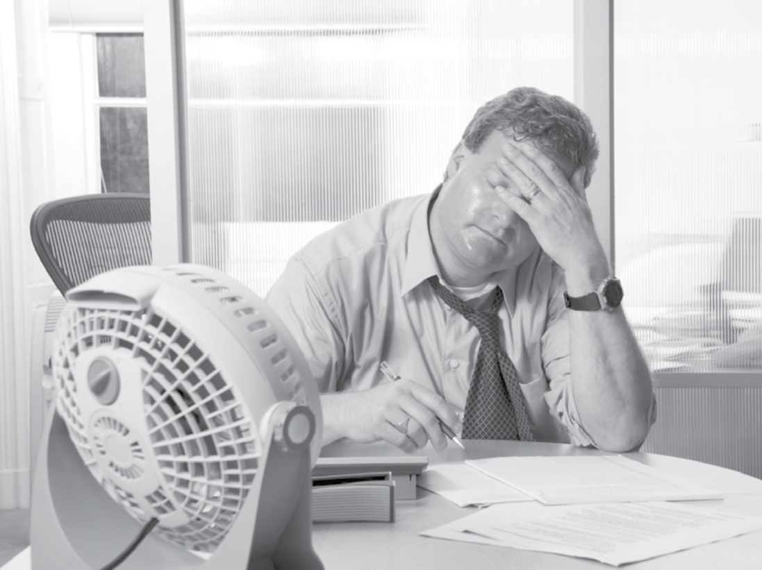
Temperaturas devem continuar em alta, segundo meteorologistas

Segundo nutricionistas, é recomendado beber água