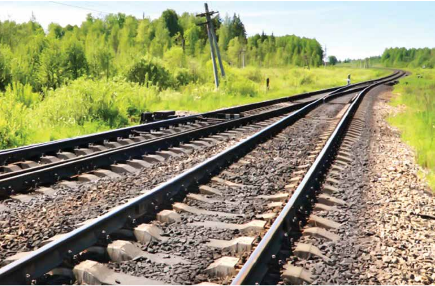
Ainda não se sabe o motivo pelo qual o aposentado estava na linha férrea

Vítima deu entrada no Pronto Socorro da Santa Casa com graves lesões nos pés e joelhos; Polícia Civil investiga o que homem fazia nos trilhos no momento do acidente