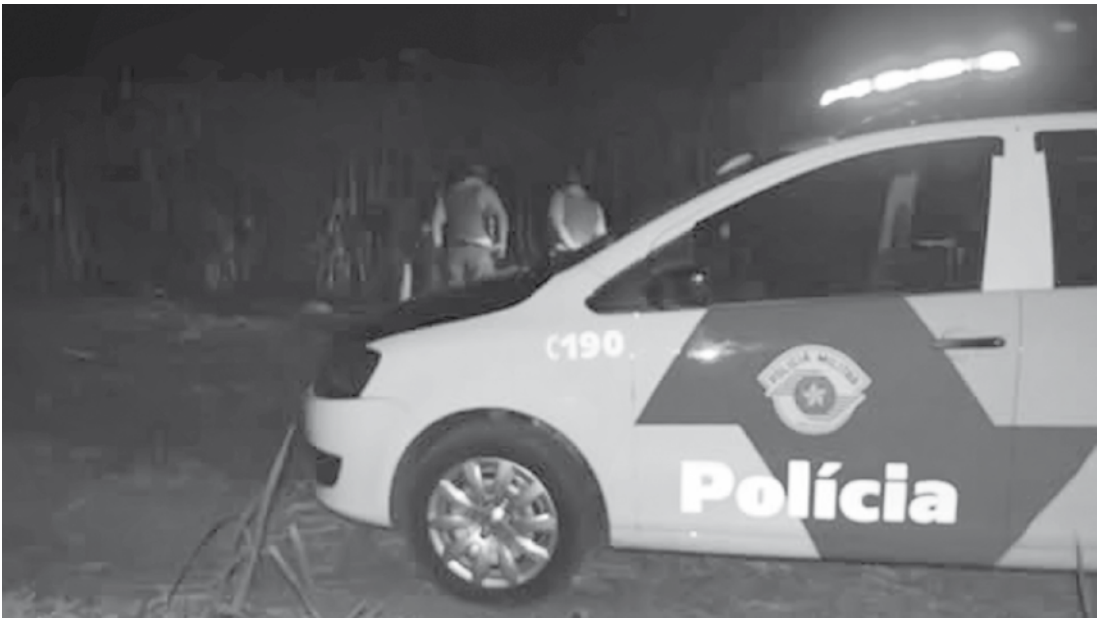
Assaltos ocorreram em áreas isoladas, distante de residências, e em horário noturno, quando as vítimas foram surpreendidas e ficaram sem poder de reação

O “modus operandi” do referido assalto é igual aos crimes sexuais ocorridos recentemente na cidade, tendo em vista que os delitos são cometidos sempre por dois homens, um alto e outro baixo, armados com espingarda e faca. Outra característica deste assalto, que se iguala aos recentes crimes sexuais sob investigação, é o local onde foi cometido: área isolada, distante de residências, e em horário noturno, quando as vítimas são surpreendidas e ficam sem poder de