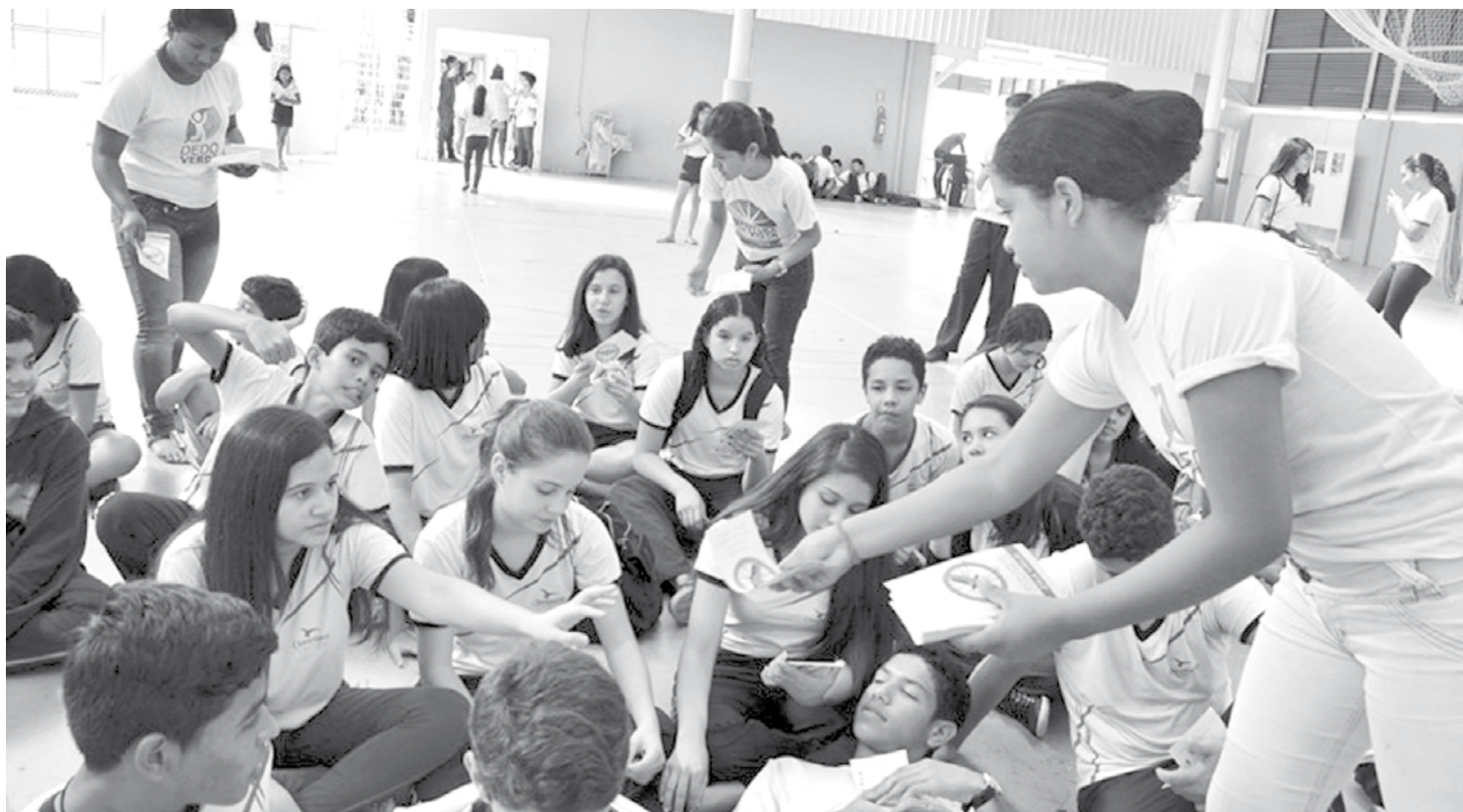
Cada nível de ensino teve uma abordagem específica sobre o tema e métodos de prevenção

Para reforçar as ações de combate ao Aedes aegypti , o tema do Prêmio Professor do Brasil deste ano será re-