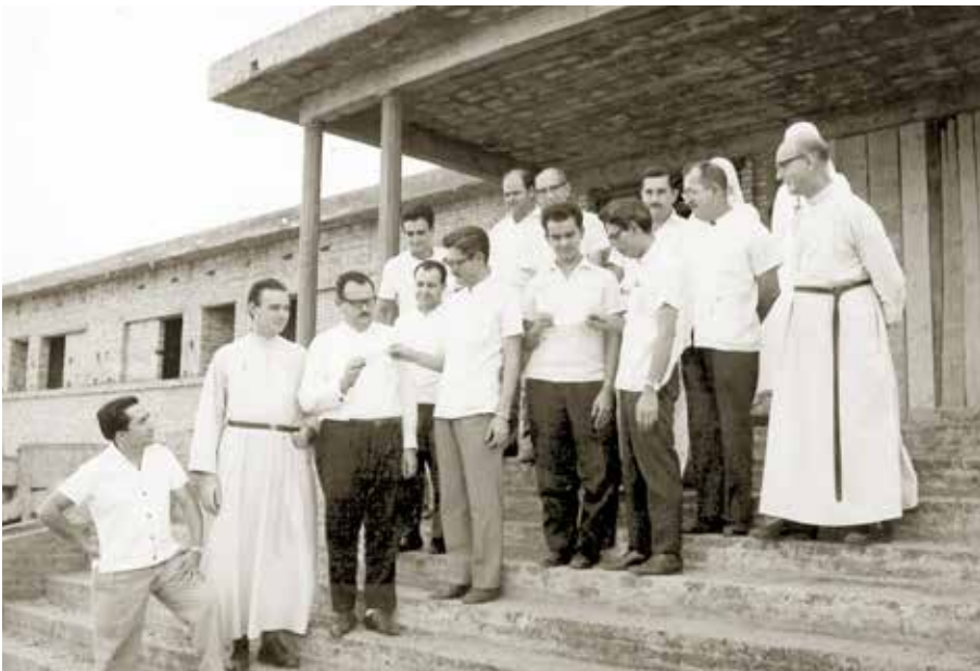
Entrega de dois cheques da Campanha da Fraternidade cujos valores foram revertidos para a construção da segunda unidade da Santa Casa, na década de 60