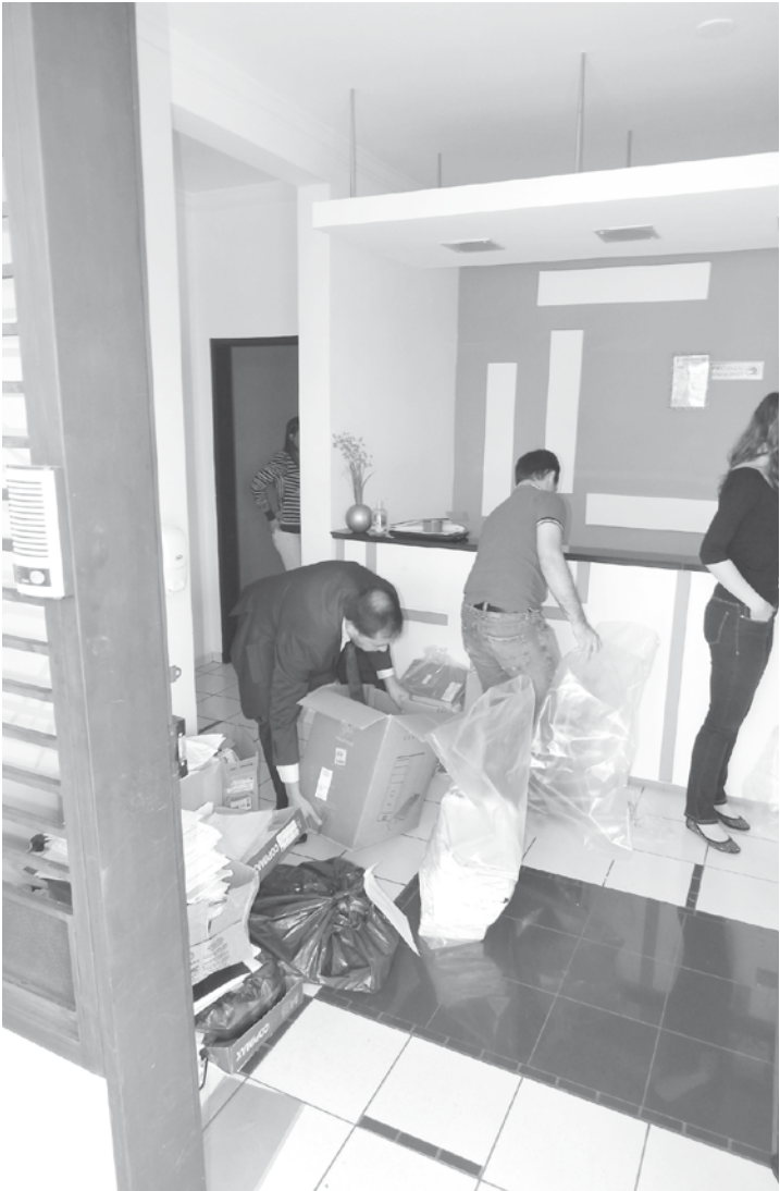
Registro da apreensão de farta documentação relacionada a concursos, licitações e processos seletivos realizada na sede da Persona Capacitação, em Fernandópolis, no mês de junho do ano passado

Apurações continuam sob o comando dos Ministérios Públicos locais (de cada Comarca) sobre possíveis fraudes em licitações cometidas pela organização criminosa (no período de 2011 a 2014/15) nas cidades de: