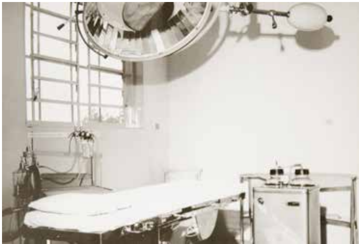
Antiga sala de cirurgia do hospital