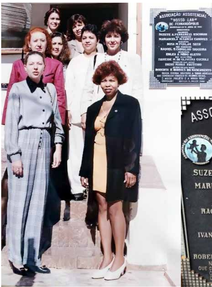
Destaque para o grupo de fundadoras da Associação Assistencial Nosso Lar, em 1996