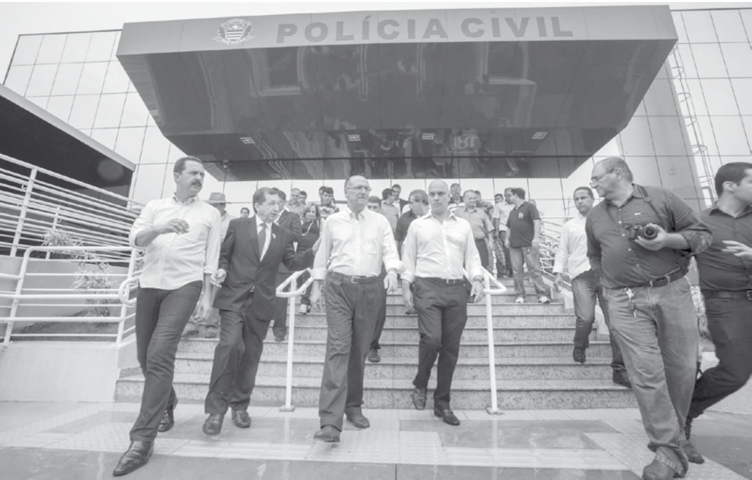
Registro da visita do governador Alckmin e do secretário da Segurança, Alexandre de Moraes, a Fernandópolis, em 16 de janeiro, para a inauguração oficial da nova Delegacia Seccional: enquanto as providências tardam, realidade regional é conhecida com detalhes pela SSP-SP

sionais recém nomeados, que serão designados para delegacias e departamentos de todo o Estado, no caso Polícia Civil. Quanto à Polícia Científica, os profissionais serão designados para o Instituto Médico Legal (IML) e para o Instituto de Criminalística (IC), de acordo com a classificação final no curso da Academia e a necessidade de cada região do Estado. PRÓXIMO A UM COLAPSO Matéria publicada no último dia 6 de fevereiro neste jornal diário, edição nº 2.732, cujo título é “Lideranças alertam: faltam delegados de Polícia na região”, expôs o cenário caótico que empurra a região para um colapso na Segurança Pública. Das 12 cidades na área de cobertura da Delegacia Seccional de Fernandópolis - incluindo o município sede - sete não contam com um delegado titular: Indiaporã, Mira Estrela, Pedranópolis, Popu-