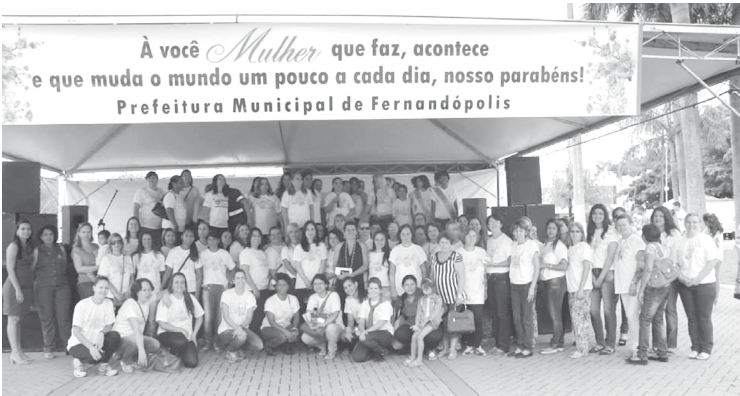
A Praça Joaquim Antonio Pereira sediará evento especial em homenagem ao Dia Internacional da Mulher

→ ASSESSORIA DE IMPRENSA Prefeitura de Fernandópolis Em referência ao “Dia Internacional da Mulher”, comemorado em 08 de Março, a Prefeitura de Fernandópolis realizará uma edição especial do projeto Prefeitura Cidadã, no próximo sábado, dia 12, das 08h às 12h, na Praça Joaquim Antonio Pereira. O evento consiste em oferecer às mulheres, gratuitamente, diversos serviços da Prefeitura e também de seus parceiros. Todas as Secretarias Municipais estarão envolvidas. A Secretaria da Saúde estará presente com orientações odontológicas, verificação de pressão arterial e glicemia, cadastro de mamografia, teste rápido de sífilis, HIV e hepatite, avaliação de IMC e orientações de combate à Dengue. A Secretaria de Agricultura, Pecuária, Abastecimento e Meio Ambiente fará distribuição de mudas