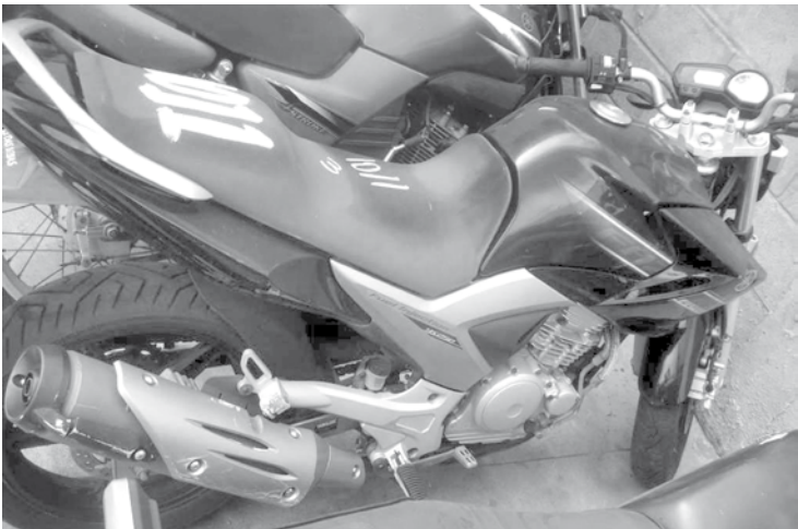
Yamaha Fazer YS 250, ano 10/11, com direito à documentação e lance inicial de R$ 4.150

cam quitados e é necessário emitir novo documento para o veículo.