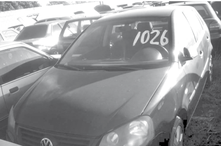
VW/Polo 1.6, ano 08/08, com direito à documentação e lance inicial de R$ 7.000

Presencial e online, evento terá carros e motocicletas apreendidos por infrações de trânsito, entre eles 28 que podem voltar a circular