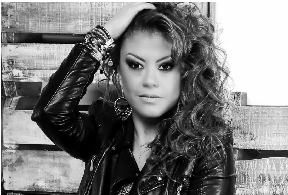
Successo na década de 2000 com o hit “To Nem Aí”, a artista disse que “estava de saco cheio” com a falta de oportunidades

das rádios que vai”, criticou. Por fim, a artista pediu desculpas para seus fãs e disse que não baixará o nível para poder voltar à mídia. “Sempre fui uma pessoa pacífica, correta, sempre paguei todos os meus impostos em dia e peço desculpas se hoje não posso oferecer o melhor para os meus fãs, adoraria presentearlos com mais clipes, mas me sinto limitada dentro da falta de apoio e incentivo da mídia. Pra mim seria muito fácil postar uma selfie do meu traseiro, mostrar que ainda sou bem gostosa ou polemizar usando a minha sensualidade, mas eu prefiro não violar a minha história musical e o respeito mútuo que existe entre eu e os meus fãs. Quero respeito. Pronto, falei”, concluiu.