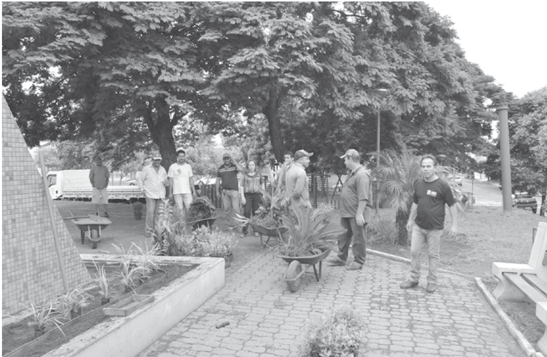
Serviços executados no “Centro Cultural”, que abriga a Biblioteca e o Teatro Municipal “Merciol Viscardi”