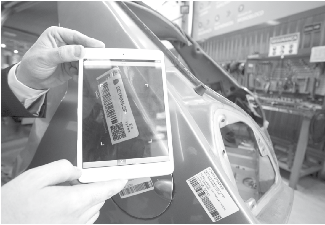
Aplicativo utilizando leitor de QR-Code para obter informações sobre peças de veículo em desmanche

Os veículos em que serão realizados os testes passarão a ser equipados com câmeras e sistema de telemetria, que permitem o rastreamento e a aferição do percurso e do comportamento do candidato durante a prova de direção. A comparação desses dados com as informações relatadas pelo examinador vai tornar o resultado do exame mais preciso. Um dos principais desafios do Detran.SP para os próximos anos é melhorar a formação dos condutores e reduzir o número de mortes e acidentes no trânsito – objetivo do Movimento Paulista de Segurança no Trânsito.