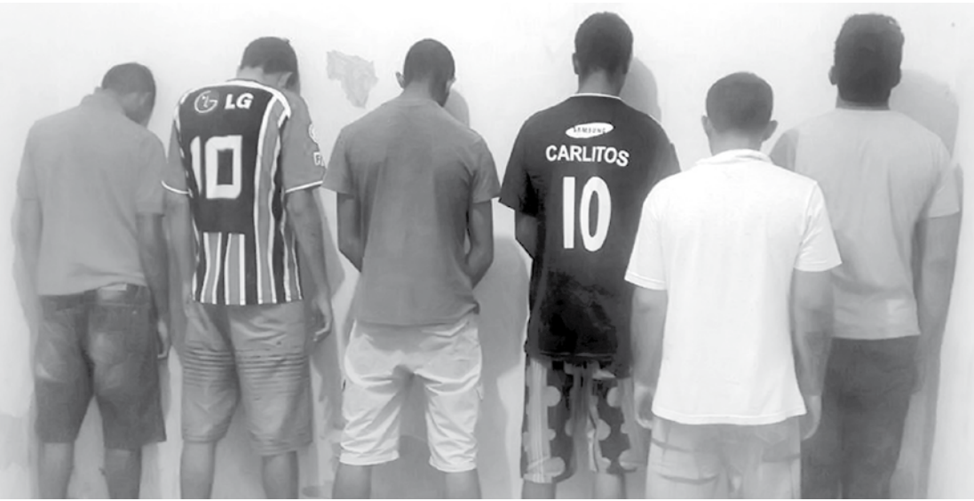
Os envolvidos na ocorrência prestaram depoimentos na DISE

O flagrante chamou a atenção de várias pessoas, que passavam pelo local no mo-