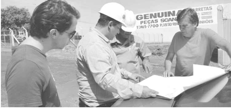
Previsão é que os serviços durem aproximadamente seis meses