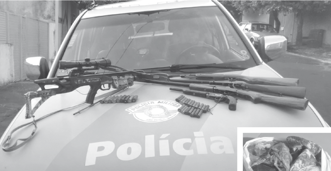
Armas e munições apreendidas pela Polícia Ambiental, além de objetos utilizados para caça e 6,5 Kg de carne de capivara (no detalhe, ao lado)