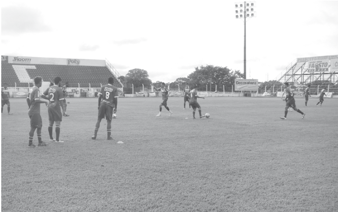
Jogadores do Fefecê durante treinamento no estádio Cláudio Rodante

será o único desfalque da Águia para o confronto contra o Guaratinguetá. Na última partida, diante do Noroeste, o atleta recebeu o terceiro cartão amarelo. Assim sendo, ele cumprirá neste jogo, a suspensão auto-