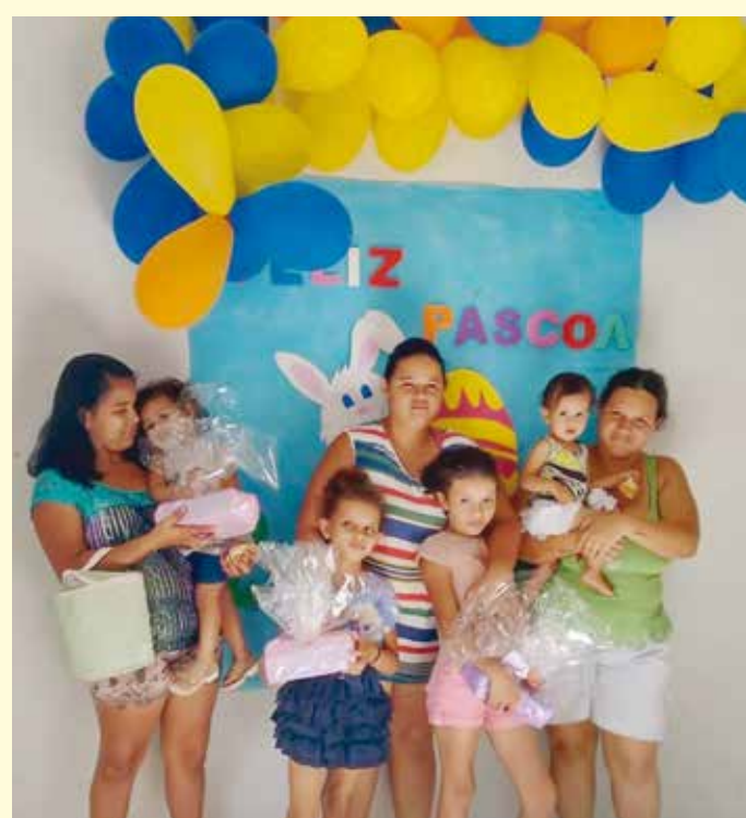
Mães e crianças participantes da festa da Páscoa no Cras

O Cras Nova Era localiza-se na Rua Pernambuco, nº 610, Vila Regina. O telefone da unidade é 3462-7016.