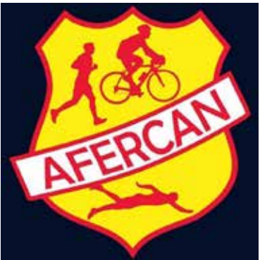
Associação sem fins lucrativos criada para alavancar o atletismo, ciclismo e nataç

A corrida de rua é um esporte que vem crescendo muito nos últimos tempos e as competições conquistam cada vez mais adeptos, caindo no gosto da população. É um esporte barato, no qual o gasto é apenas um tênis apropriado para as corridas. Recentemente, aos 72 anos, um médico, escritor, voluntário em presidio, pesquisador, celebridade na TV lançou o seu mais recente livro “Correr”, que vale a pena ler, principalmente quem gosta de esportes. O autor, Dr. Dráuzio Varella, conta