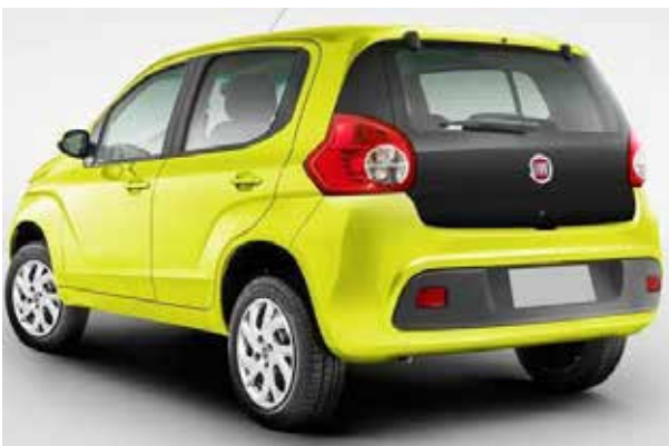
Acima, o Renault Kwid, sucesso de vendas na Índia, ao lado, o Fiat Mobi, que chega antes, já no próximo mês

são de entrada em torno de R$ 29 mil; já o Kwid, sucesso de vendas na Índia onde tem fila de espera de até sete meses, tem lançamento previsto para novembro, no Salão de São Paulo com preço inicial também abaixo dos R$ 30 mil. Ambos tem um rival de peso, já há tempos no mercado: o VW Up!