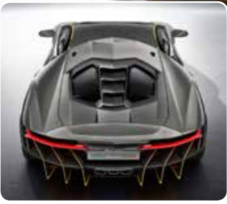
Centenario: 350 km/hora

menagem ao fundador da marca, Ferruccio Lamborghini, que nasceu em abril de 1916 e faleceu em 1993. O motor, um V12 6.5, gera 770 cv, que junto com a tração nas quatro rodas, levam o Centenario de 0 a 100 km/h em 2,8 s, os 300 km/m chegam em 23,5s e a velocidade máxima é de 350 km/h. A carroceria assim como os bancos e os painéis das portas são de fibra de carbono, isso faz com