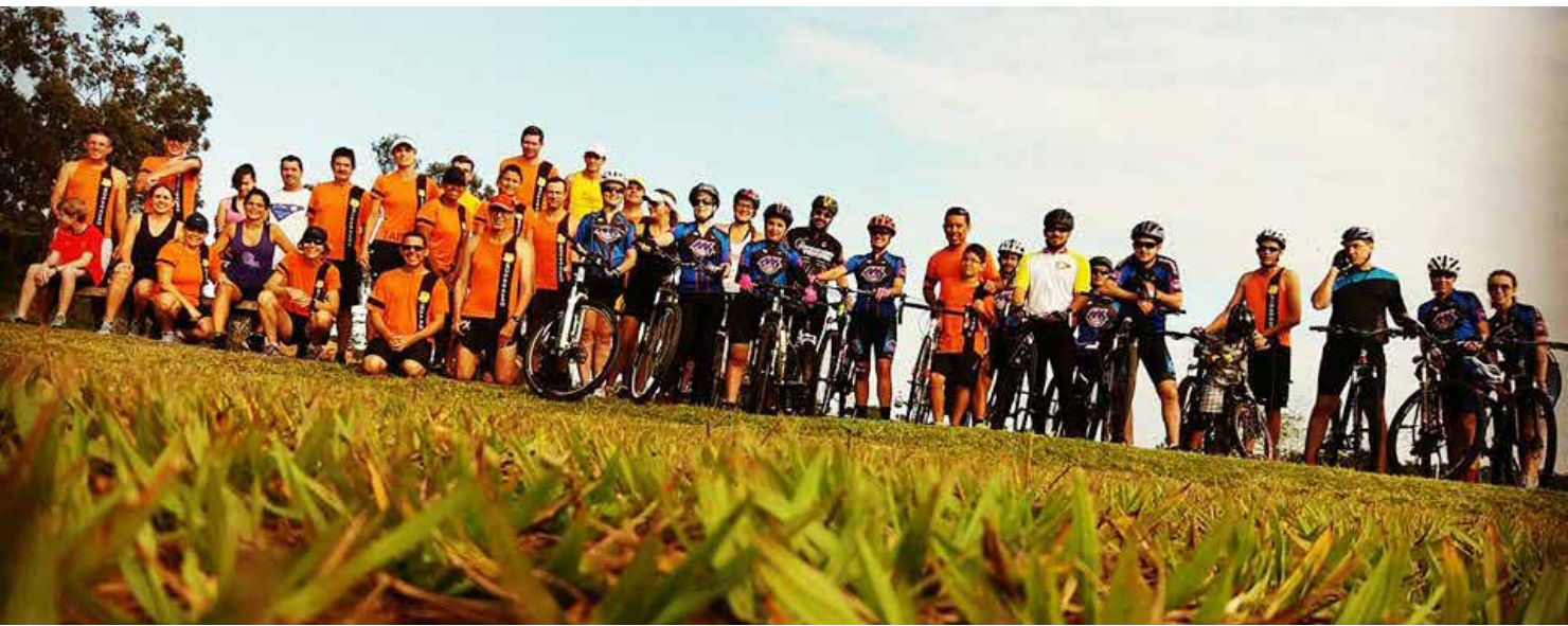
Equipes Pro-Training, Tokaia, Hazard e “Superação” representaram a AFERCAN correndo 9km na cidade de Lourdes/SP

É importante observar a duração do seu treino para repor as energias. A alimentação antes e depois do Longão é recomendada.