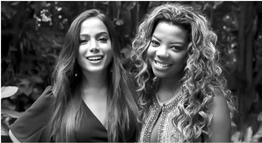
Ludmilla ficou de fora da festança de Anitta

rasco com pagode que durou até o anoitecer. Mesmo barrada, a funkeira se fez presente na festa de aniversário de Anitta, quando o DJ tocou “Hoje”, um dos maiores sucessos de Ludmilla. A música de Valesca, outro desafeto da Poderosa, também animou a festa da “rival”. Por outro lado, a presença de Preta Gil na festança chamou a atenção, já que a rivalidade entre ela e Anitta nunca foi segredo para ninguém. Preta ainda fez questão de posar com a aniversariante e publicar o registro sorridente no Instagram.