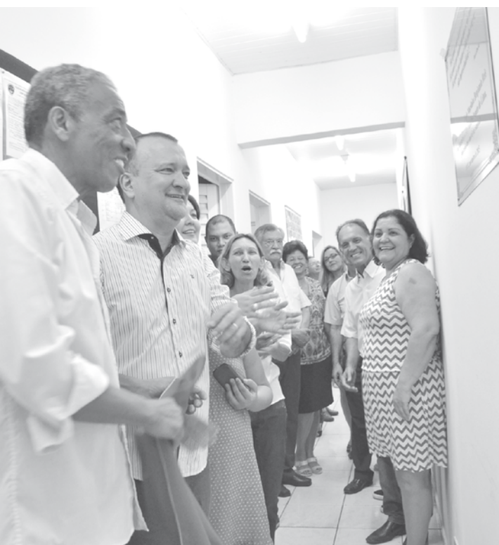
Foi cedida por comodato pela maçonaria outra parte do prédio, localizado no Bairro Aparecida

Novo local será utilizado no atendimento psicológico e assistencial aos pacientes cadastrados