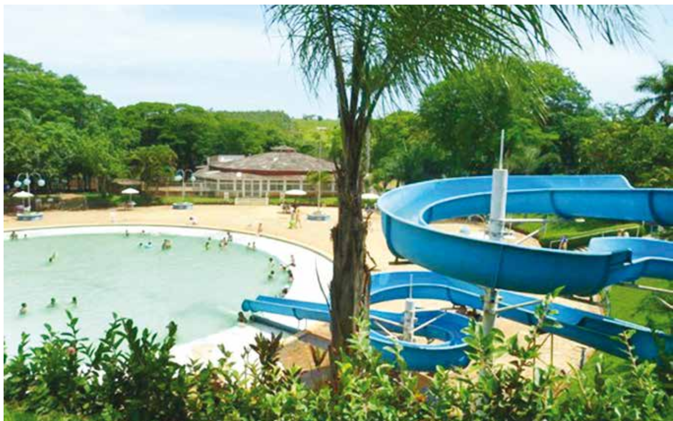
Clube está avaliado em R$ 13 milhões, mas dívidas são superiores a R$ 7 milhões, grande parte por ações trabalhistas

do advogado Antonio Carlos Cantarela, a determinação de laqueação total do clube foi revista, e o Água Viva permaneceu em funcionamento, aberto aos associados até hoje. Segundo Cantarela, a laqueação poderia causar ainda mais prejuízos, enfatizando "não haver risco para a execução da arrecadação ou para a preservação dos bens da massa falida, tampouco aos interesses dos credores". O juiz Fabiano Moreno acatou a solicitação do ex-administrador do clube, recomendando então "a continuação provisória das atividades do clube". "Melhor analisando os autos e à vista das ponderações apresentadas pelo embargante, dotadas de pertinência e relevância, acolho os presentes embargos para, conferindo-lhes efeitos modificativos, declarar a sentença recorrida (...) e autorizo a continuação provisória das atividades do falido, ficando a administração a cargo do administrador judicial", sentenciou o magistrado. Em busca de mais detalhes sobre o Água Viva, da situação dos atuais funcionários - são cerca de 50 colaboradores atualmente em atividade -, e dos associados, bem como dos valores que serão estipulados para o futuro leilão do empreendimento, a Reportagem de "O Extra.net" confirmou a substituição do advogado Antonio Carlos Cantarela