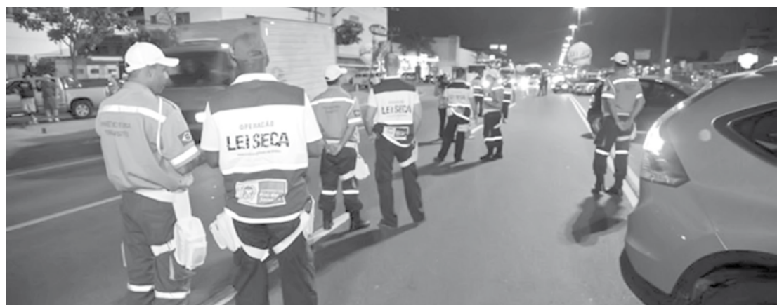
Lei Seca segue por toda a região; multa por embriaguez ao volante é de R$ 1.915,40

2013, o Programa Direção Segura integra equipes do Detran.SP, das polícias Militar, Civil e Técnico-Científica, e do Corpo de Bombeiros. Pela Lei Seca (lei 12.760/2012), todos os motoristas flagrados em fiscalizações têm direito a ampla defesa, até que a CNH seja efetivamente suspensa. Se o condutor voltar a cometer a mesma infração dentro de 12 meses, o valor da multa será dobrado.