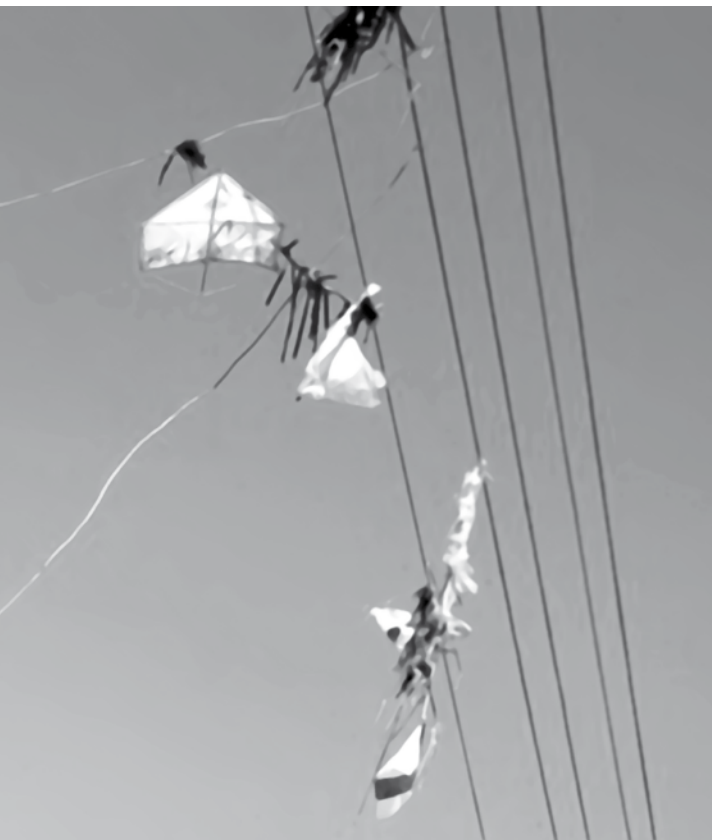
No município, essa é uma situação muito comum, principalmente em bairros mais afastados da região central

Flagrante aconteceu na tarde de domingo na zona norte de Fernandópolis