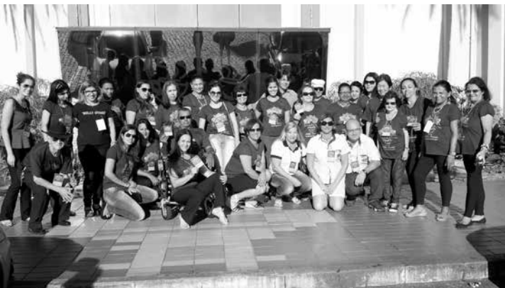
Grupo de Ouroeste foi um dos grandes destaques do festival

Durante o espetáculo, a fotógrafa oficial do evento Sandra Reis registrou a presença do grupo, para constar em seu site, pelo projeto dos profissionais em fotografia, portadores de Síndrome de Down.