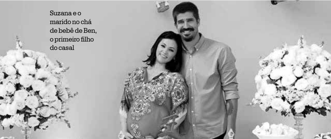
Suzana e o marido no chá de bebê de Ben, o primeiro filho do casal

Grávida do primeiro filho, aos 37 anos, Suzana Alves pode ganhar de uma só vez dois bebês. É que ela e o marido, o ex-tenista Flávio Saretta, estão em um processo para adotar uma criança. A iniciativa se deu por conta da dificuldade que a intérprete da Tiazinha teve em engravidar. “Como não conseguíamos engravidar, decidimos adotar. Como o Ben (nome do filho