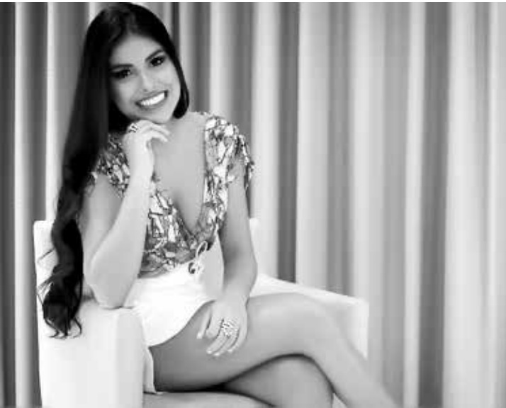
Campeã do ‘BBB 16’ muda para o Rio