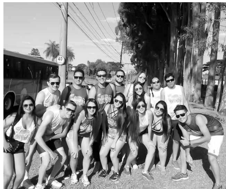
Click da galera de Mira Estrela , toda reunida em São José do Rio Preto, no bloco 'Pirraça'.