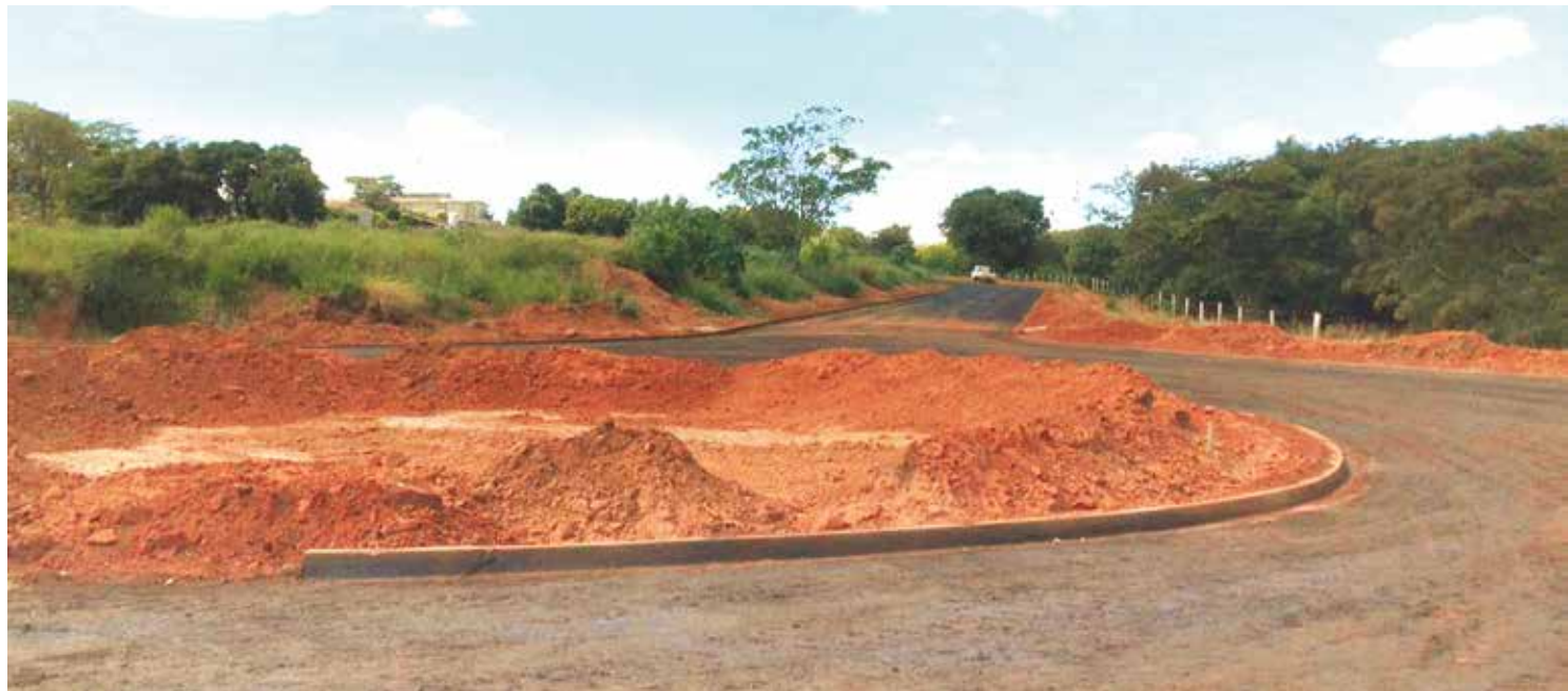
Outra rotatória interligará a avenida do Pronto Socorro ao prolongamento da Rua Projetada com a Luiz Pezatti

sito, mas, principalmente, os Bombeiros e o SAMU como rotas alternativas até a Santa Casa.