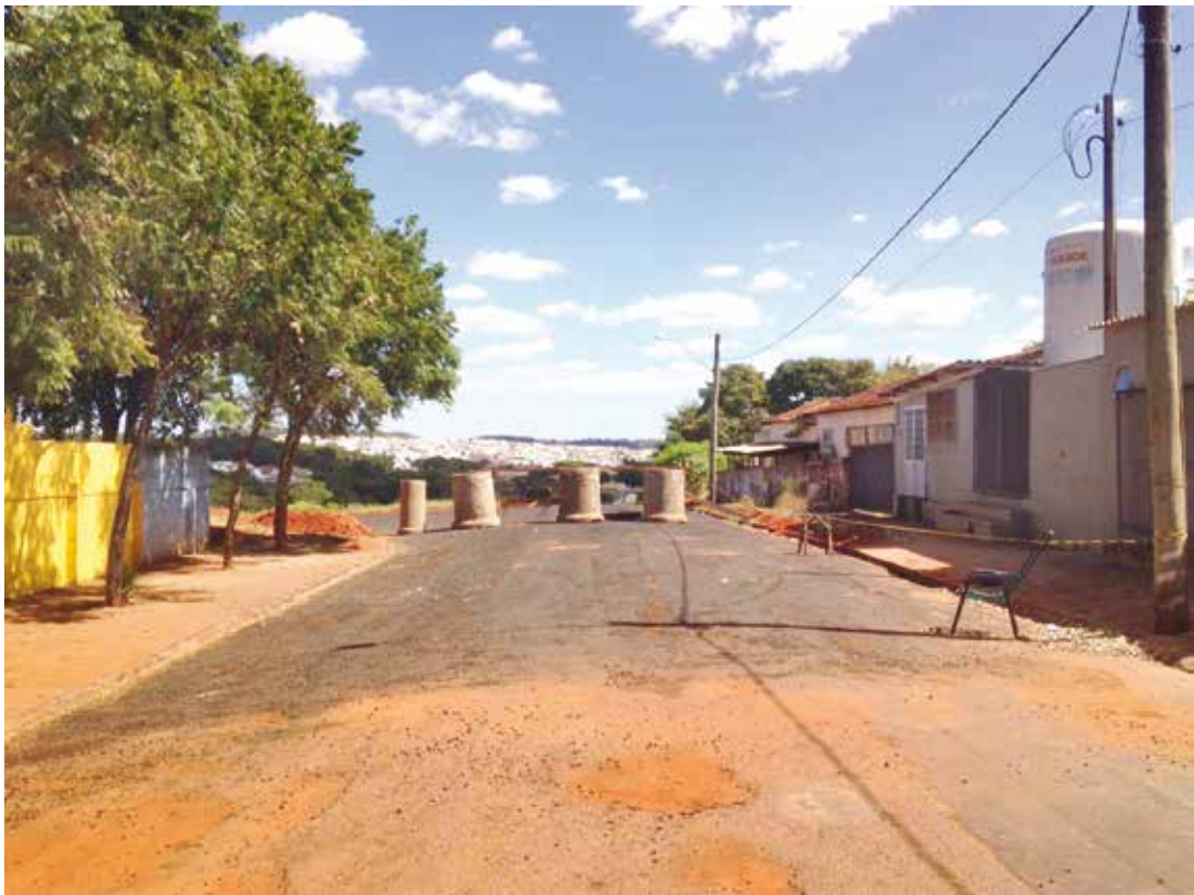
Entre o Colégio Coopere e a Santa Casa foram colocados tubulações de concreto para conter a passagem