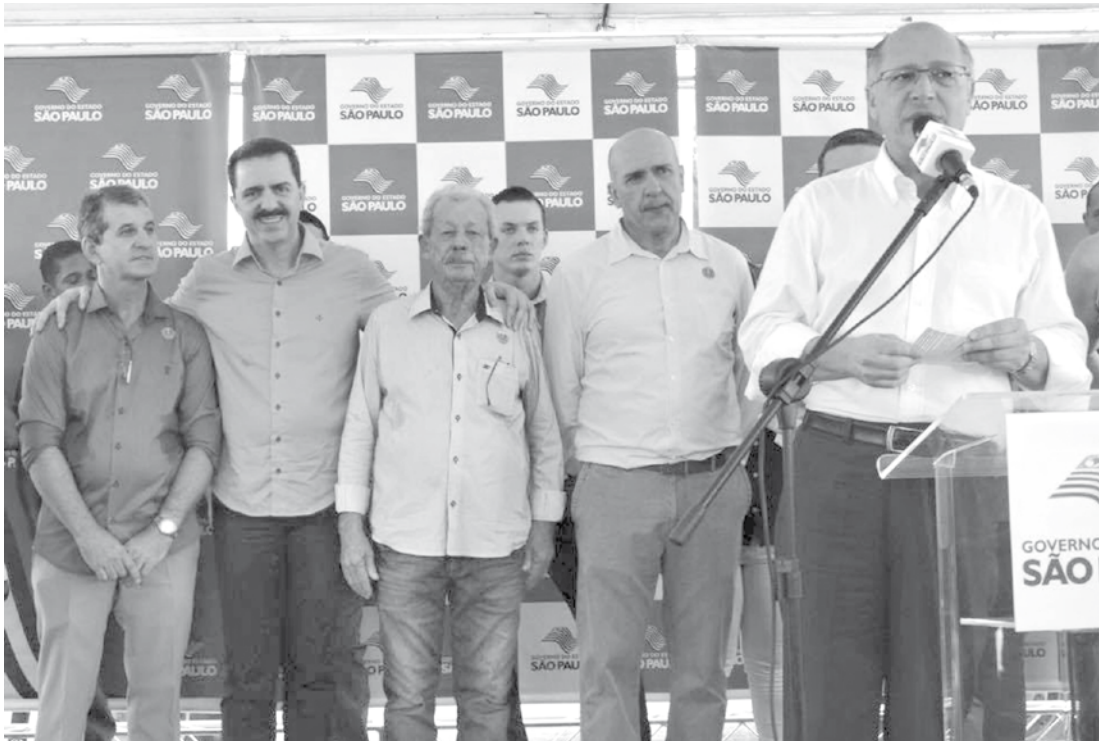
Convênio foi liberado pelo governador Geraldo Alckmin em recente visita à cidade

ra conservação das estradas rurais municipais. Serão 7 km de vias recuperadas e melhoradas na estrada PLN - 329, no Bairro Santa Izabel do Marinho. O investimento será de R$ 839 mil. "O Programa Melhor Caminho é uma grande conquista para o município, pois facilitará o escoamento da produção rural e a circulação de bens e pessoas", disse Itamar Borges.