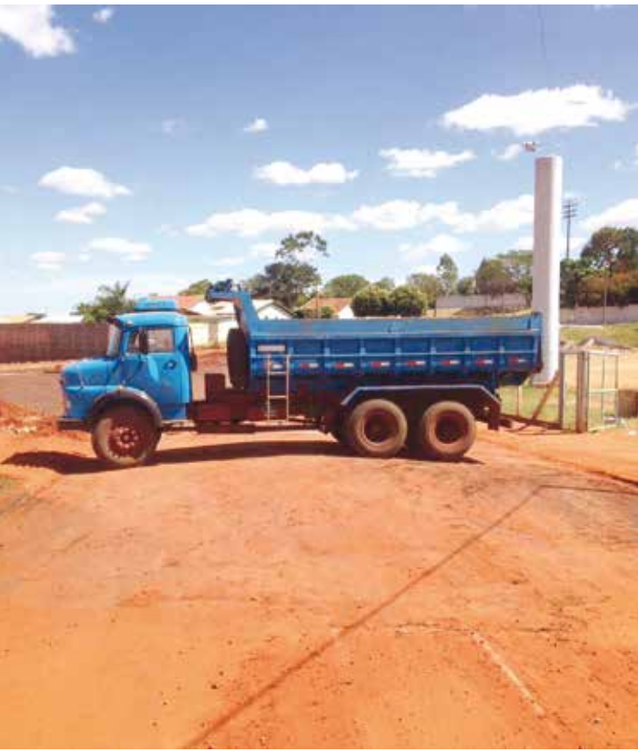
Caminhão basculante foi posicionado como barreira já que placas de trânsito não foram suficientes para conter os ‘motoristas petulantes’