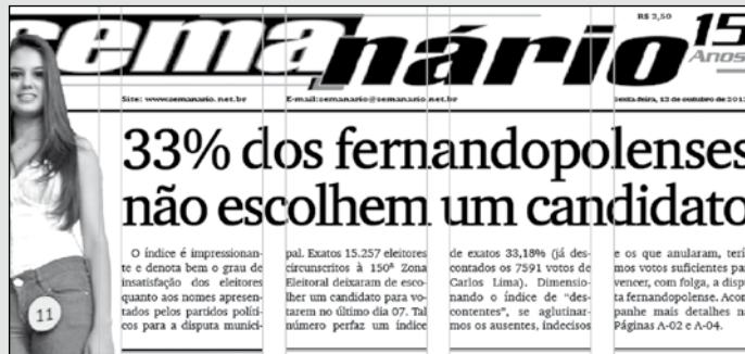
Manchete do então jornal “Semanário”, de 12 de outubro de 2012: “nenhum” foi a opção de 33% do eleitoral local

a disputa. A indagação é se agora, em 2016, a tendência se repetirá ou se alguma candidatura cairá no gosto desse importante filão eleitoral.