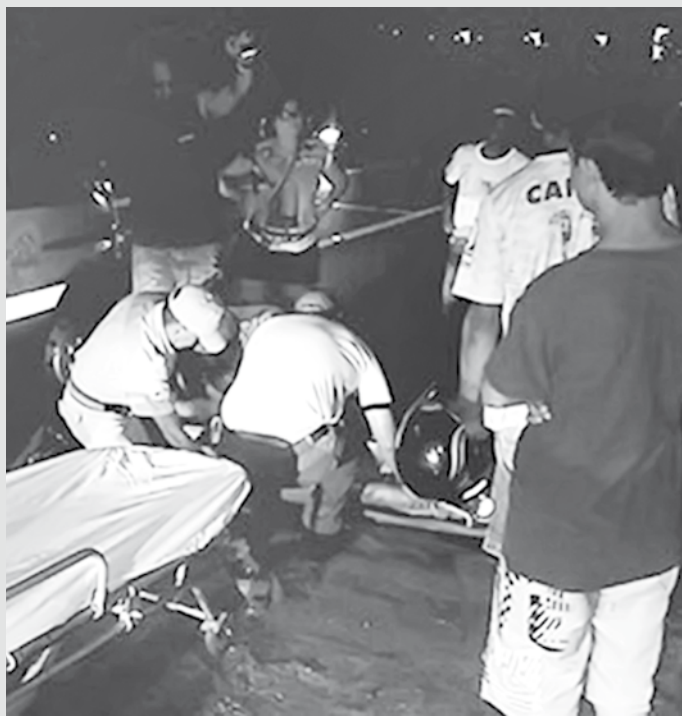
Vítimas tiveram ferimentos leves e foram socorridas ao hospital local

De acordo com a polícia, os veículos seguiam no sentido Ilha Solteira/Mato Grosso do Sul (MS), quando aconteceu o acidente. O casal que estava na moto foi socorrido e levado para o Hospital Regional de Ilha Solteira com ferimentos leves. As vacas fugiram e ainda não foram encontradas. Por isso, a polícia acredita que elas não tenham se ferido. Os donos dos animais também não foram localizados.