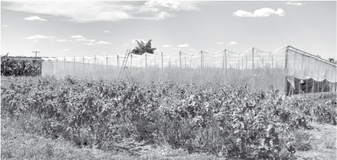
O encontro mostrou aos produtores rurais as vantagens do cultivo em estufa

te às compras de produtos através das políticas públicas (PAA, PNAE e PPAIS). A produção em estufas tem muitas vantagens entre elas: colheita no período de en-