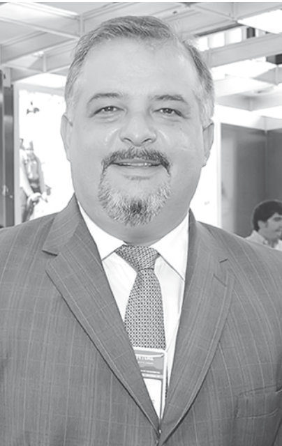
Márcio França, vice-governador de São Paulo e presidente estadual do PSB