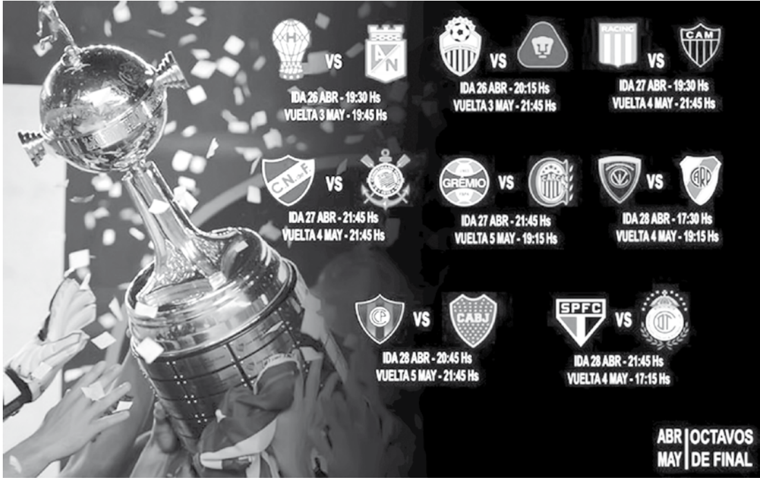
A tabela das oitavas de final da Taça Libertadores

bresal, e o Atlético-MG venceu o Melgar por 4 a 0. O Grêmio venceu o Toluca por 1 a 0 na terça-feira, e o Palmeiras - único brasileiro eliminado - havia encerrado a fase de grupos na semana anterior, goleando o River do Uruguai por 4 a 0. JOGOS DE IDA (horário de Brasília) • 26 de abril, terça-feira - Huracán x Atlético Nacional - 19h30 (Buenos Aires) - Deportivo Táchira x Pumas - 21h15 (San Cristóbal) • 27 de abril, quarta-feira - Racing x Atlético-MG - 19h30 (Buenos Aires)