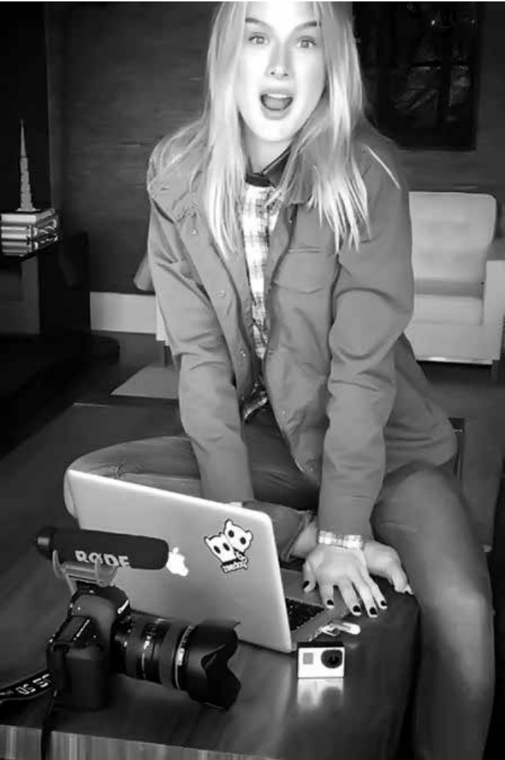
Fiorella Mattheis posa durante as gravações dos vídeos