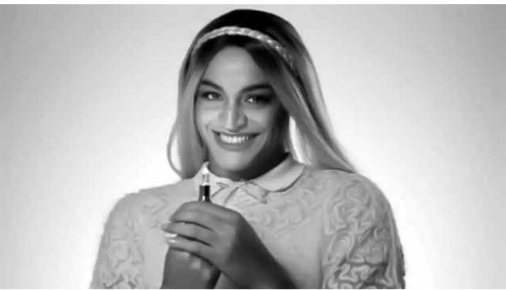
Pablo Vittar em imagem da campanha

Desde que embarcou para lá pela primeira vez, Fiorella Mattheis tem se dividido entre os dois países, já que ainda tem trabalhos por aqui, como o programa “Vai que cola”, que ela volta a gravar em meados de maio. Além, disso, a gata tem outros compromissos. “Vou para o Brasil uma ou duas vezes por mês para eventos e campanhas”.