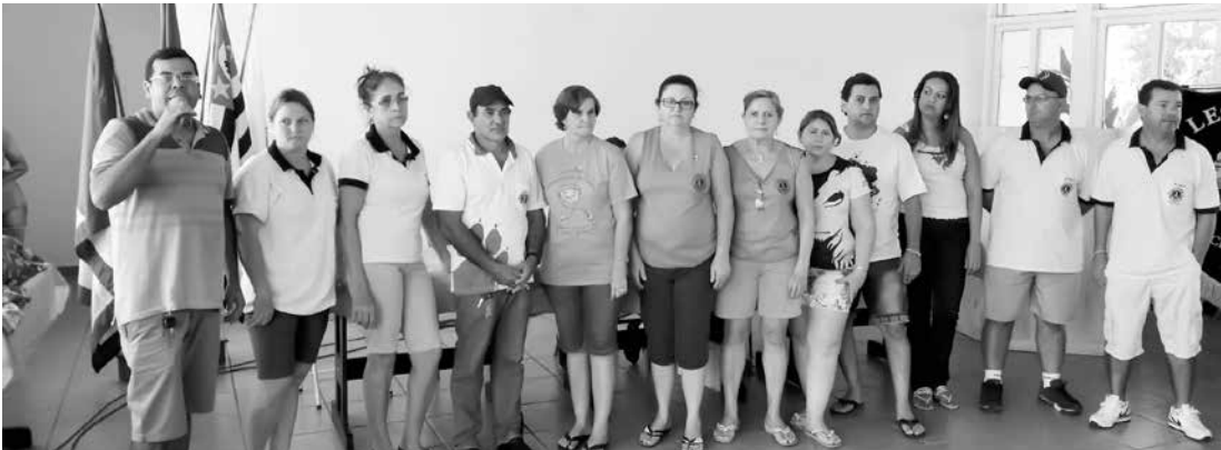
Membros do Lions Clube de Ouroeste, responsáveis pelo sucesso do ‘AcampaLEO’

galhães, destacou a grande união de todos, tanto os membros do Clube como dos visitantes que nos dois dias do