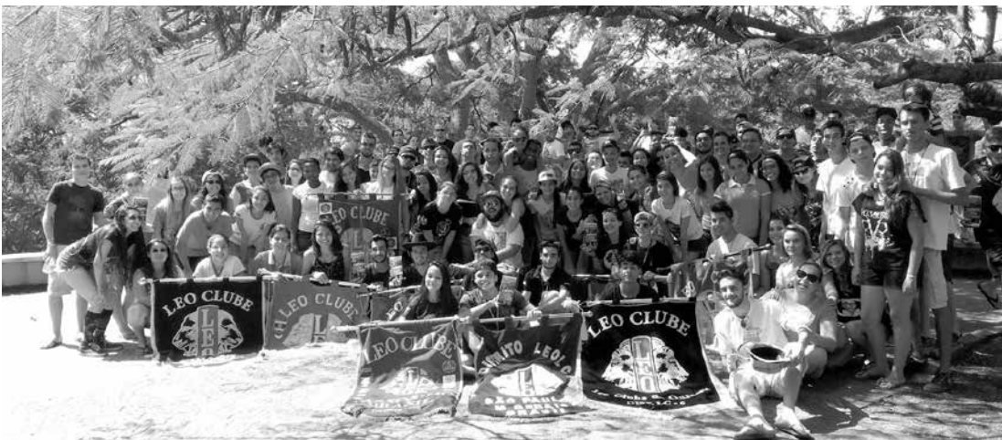
Edição do ‘AcampaLEO’ contou com a participação de aproximadamente 200 jovens, representando 14 clubes do Distrito LC6 e LC8