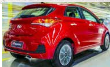
HB 20 1.0 com motor turbo e três cilindros