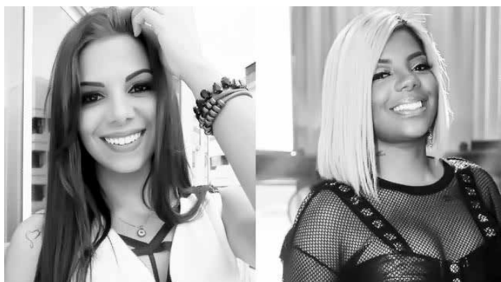
Nova polêmica: blogueira detona Ludmilla em rede social