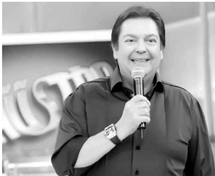
Apresentador fatura milhões em seu programa semanal

ma esteja passando por uma crise de audiência. Argumenta que a média do primeiro trimestre deste ano na Grande São Paulo, de dez pontos, ficou um ponto acima do mesmo período de 2015 e superou as demais emissoras. De fato, a média do Vídeo Show na Grande SP não é das piores _ o programa já rendeu bem menos quando era apresentado por Zeca Camargo. O problema agora é a perda da liderança, algo que a Globo não tolera passivamente.