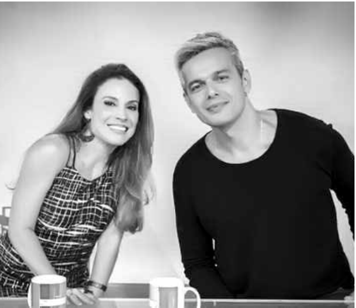
Apresentadores do Vídeo Show terão que fazer mudanças

A Globo fará uma pesquisa com os telespectadores para avaliar a situação do “Vídeo Show”. Nos bastidores, a emissora avaliou que o vespertino perdeu o foco devido ao rodízio de apresentadores. Maíra Charken não conseguiu conquistar o público e foi substituída por Aline Prado, Giovana Ewbank e Susana Vieira na bancada. Com medo da repercussão nas redes sociais, o canal preparará mudanças no vespertino. A Globo nega que o progra-