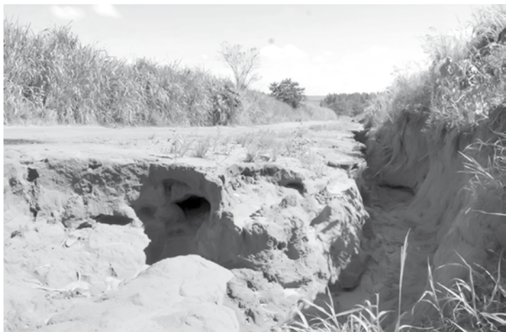
Além das áreas degradadas, a partir de agora, o produtor rural pode realizar melhorias não apenas na erosão em si, mas também nas chamadas áreas de contribuição

de melhorias a ser realizadas. Desde 2014 foram oferecidas 38 subvenções aos produtores paulistas, totalizando R$ 307.058,08 aplicados pelo projeto. São várias as práticas elegíveis para a recuperação das voçorocas (incluindo as chamadas áreas de contribuição). Entre elas, correção física de sulcos, construção de sistema de terraceamento, corre-