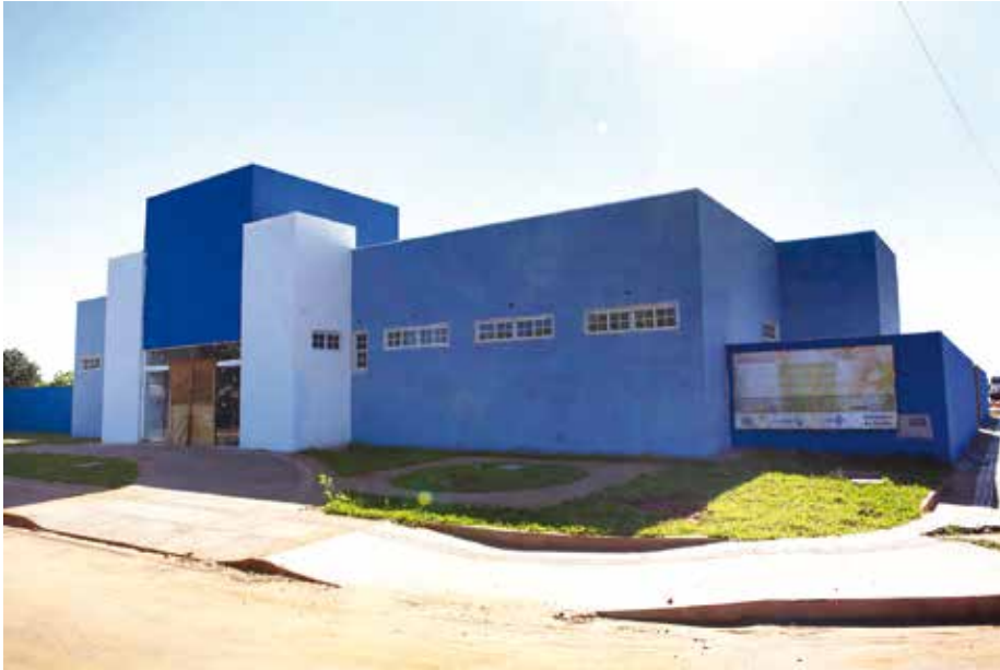
Unidade Básica de Saúde no Residencial Rodrigues