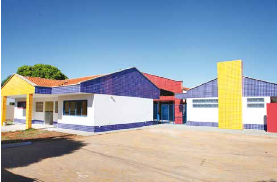
Unidade Escolar de Educação Infantil, anexo à EMEI “Paraíso Infantil”