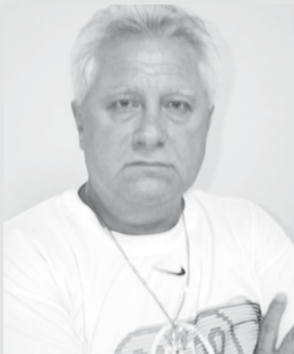
Santa Rosa: populismo quase o levou à Prefeitura

funções cardíacas, decorrentes de complicações renais e provocou grande comoção por aqui.