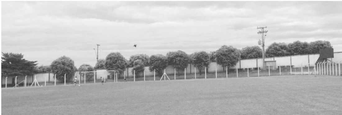
Mostra de Foguetes aconteceu no Estádio Municipal e contou com a participação dos alunos do ensino médio e fundamental da escola Sansara