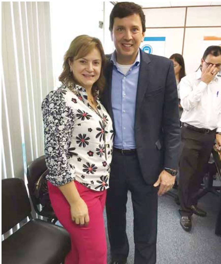
Secretário participou de sessão de posse dos novos conselheiros estaduais de Assistência Social, em São Paulo