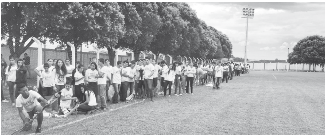
Foguetes são construídos com garrafas pets e lançados a base de pressão a ar com uma bomba manual