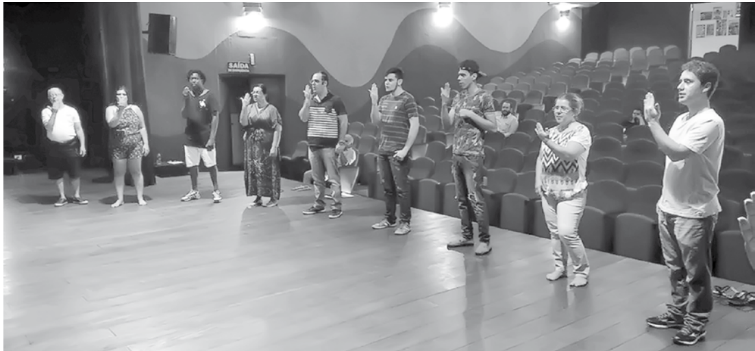
Ensaio será nas segundas-feiras

suntos como apoio vocal, impostação, projeção vocal, afinação, dicção, articulação, timbragem de voz e outras questões da prática do canto.