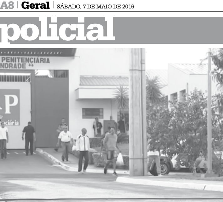
Presos deixam presídio na região noroeste paulista