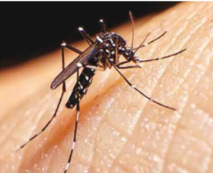
Os três casos confirmados de Zika em Fernandópolis foram em gestantes

ram enviadas 512.930 doses para um público-alvo de 437.409 habitantes, na região. Os municípios são responsáveis pelo gerenciamento das doses disponíveis, bem como pela aplicação de vacinas apenas para o grupo prioritário indicado pelo Ministério da Saúde. Novas remessas de doses dependerão do Ministério da Saúde. As doses que o órgão federal disponibilizou para São Paulo até o momento foram todas repassadas aos municípios.