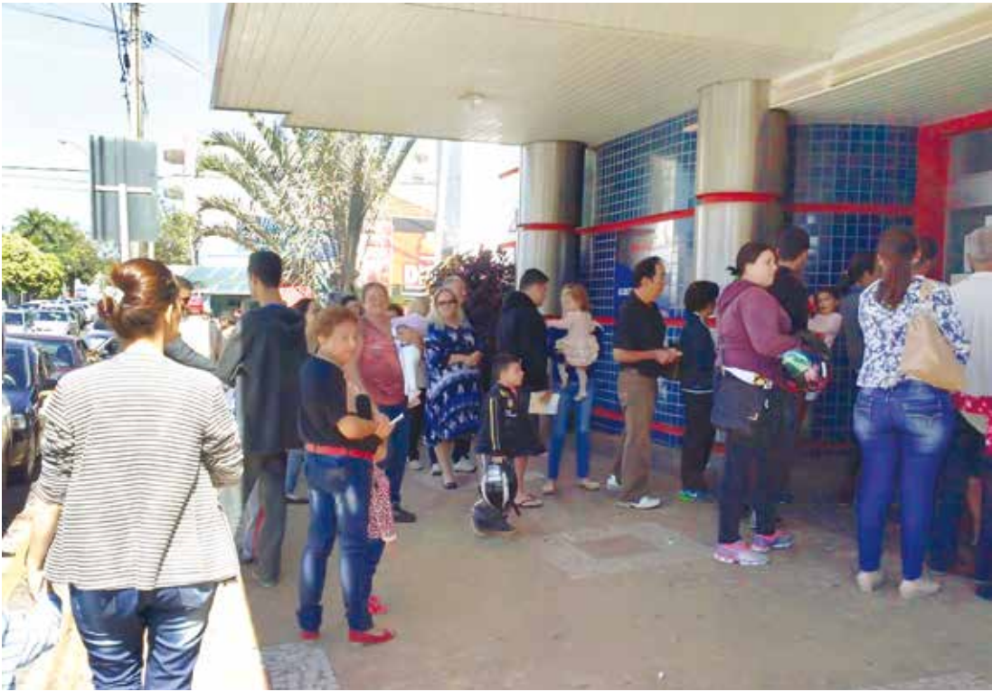
Horas na fila para nada: milhares de fernandopolenses sofreram em busca da vacina

FALTA VACINA Em Fernandópolis, as vacinas se esgotaram novamente nas unidades de saúde durante esta semana. Este é o terceiro registro de falta de vacinas na cidade desde o "Dia D" da Campanha Nacional de Vacinação, no último dia 30 de abril, incluindo o próprio "Dia D", quando muitas pessoas não puderam ser imunizadas. Em alguns postos de vacinação da cidade, filas se formaram e algumas pessoas, mesmo tendo esperado sua vez, inclusive idosos e crianças, não foram vacinadas porque as doses se esgotaram. A Secretaria Municipal da Saúde, responsável por desenvolver a campanha em Fernandópolis, havia recebido as doses para a data mais importante da campanha nacional - ao todo