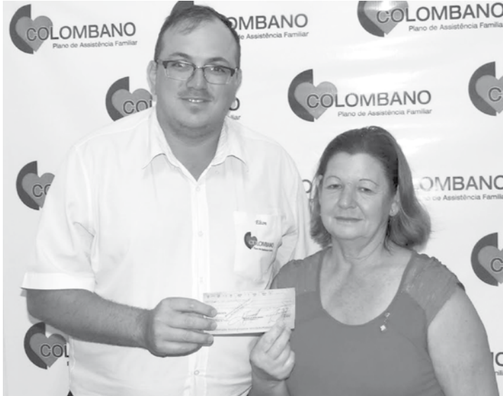
Associada sendo beneficiada com o cheque

serviço sério e dedicado aos nossos associados e hoje estamos mostrando mais uma vez que nessa empresa você pode confiar, porque ela é hoje a única empresa 100% Fernandopolense do setor”, completou. O Plano de Assistência Familiar Colombano possui vários benefícios, entre eles, empréstimos de cadeiras de rodas, cadeiras de banho, bengala, andadores e muletas. Além de convênios com médicos de Fernandópolis, Jales e São José do Rio Preto e descontos especiais na Farmácia Ultra Popular e Drogaria Total.