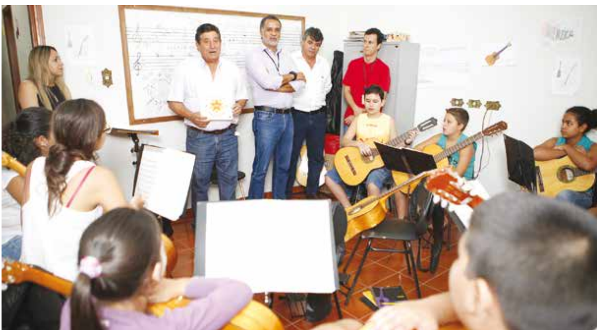
Dentre 35 polos que foram avaliados, O Guri de Ouroeste ficou entre os cinco polos considerados ótimos, alcançando o mais elevado nível de qualidade em todos os parâmetros.