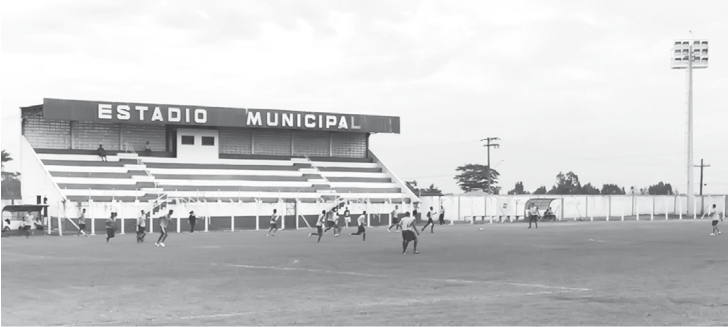
Jogadores no estádio Manoel Dias da Silva se preparando para o início do campeonato

Os quatro primeiros de cada grupo se classificam para a segunda fase, onde será formado dois grupos de seis times cada. Os dois primeiros de cada chave vão para a semifinal. Os ganhadores desta fase decidem a competição. Os clubes utilizarão atletas com até 23 anos, podendo ter até cinco jogadores com idade maior. A Liga ainda vai anunciar os times que disputarão o grupo especial Sub-18.