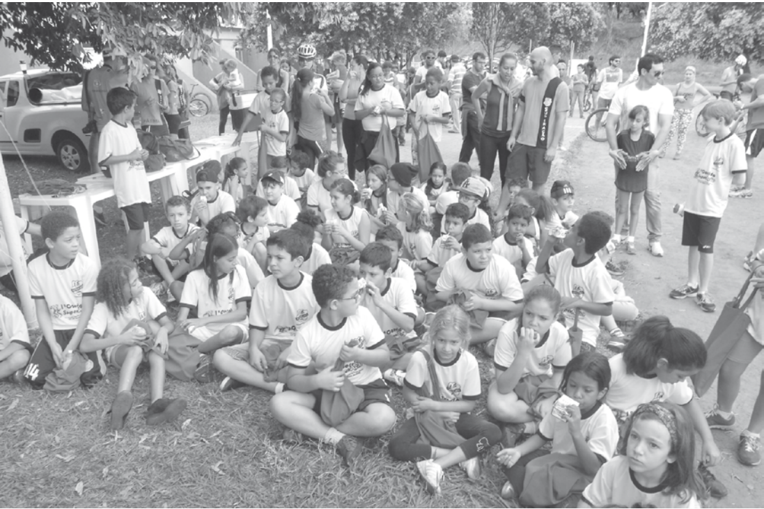
Projeto desenvolve o trabalho de convivência familiar e fortalecimento de vínculos, conforme as legislações sociais

PROJETO O Projeto Girassol é um plano social, que atende atualmente 40 crianças e adolescentes, em situação de vulnerabilidade social, diariamente das 13h às 17h, e é mantido pelo Núcleo Espírita Dr. Adolfo Bezerra de Menezes, tendo como área de abrangência a periferia de Fernandópolis, mas precisamente o Bairro Paulistano e adjacentes.