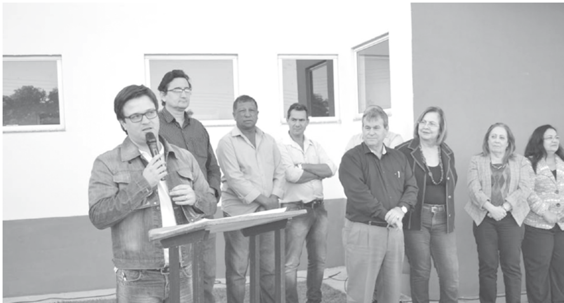
Inauguração da UBSF Pastor Marcelino Deúngaro