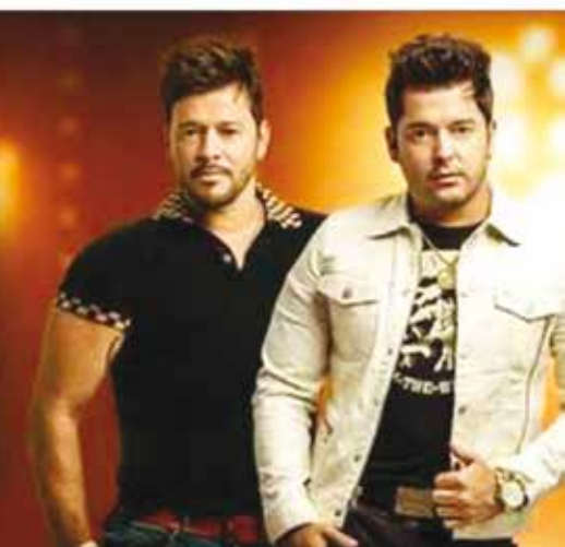
Artistas confirmados no "Juninão" 2016 de Valentim Gentil

eventos pelo Brasil afora, como carnavais fora de época.