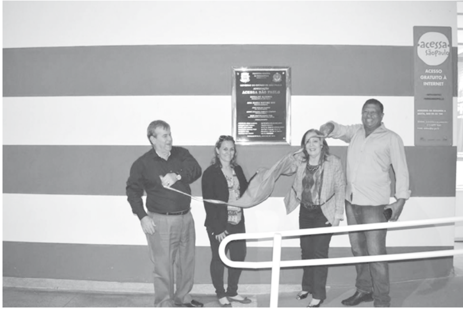
Visita às novas instalações do Acessa São Paulo