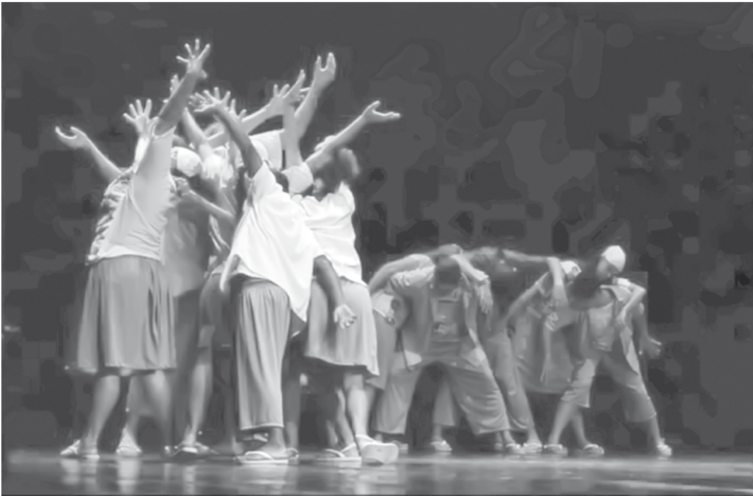
Street Boys representará Fernandópolis no palco