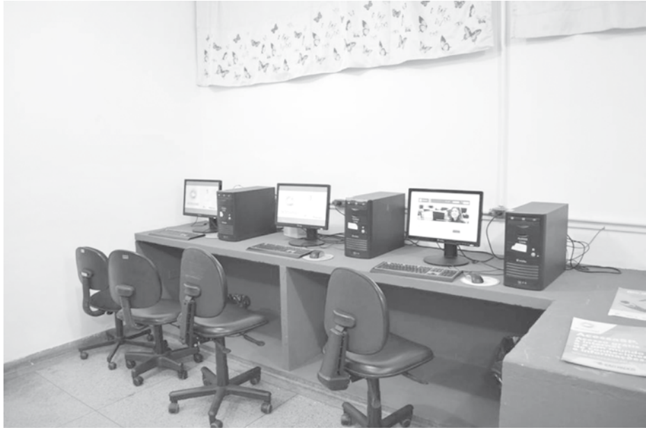
Visita às novas instalações do Acessa São Paulo