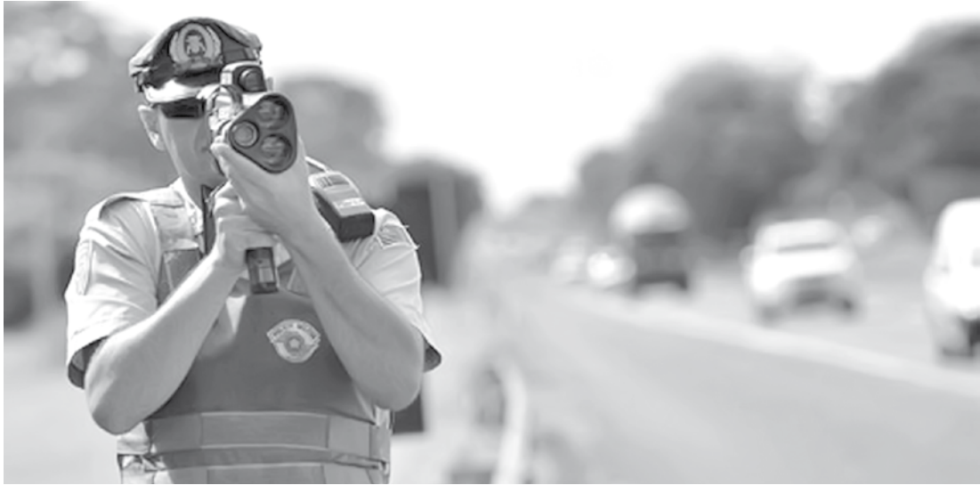
Polícia Militar Rodoviária estará com efetivo reforçado neste feriado

A PM alerta que o motorista que for flagrado dirigindo embriagado será multado em R$ 1.915,40 e poderá ter o veículo apreendido e a Carteira Nacional de Habilitação (CNH) retida por 12 meses. O condutor terá ainda que responder criminalmente a uma pena de seis meses a três anos de prisão. A operação contará com a participação da Secretaria de Logística e Transportes e da Agência Reguladora de Serviços Públicos Delegados de Transporte do Estado de São Paulo (ARTESP), do Departamento de Estradas de Rodagem (DER), empresa Desenvolvimento Rodoviário S/A (Dersa) e das concessionárias de rodovias.