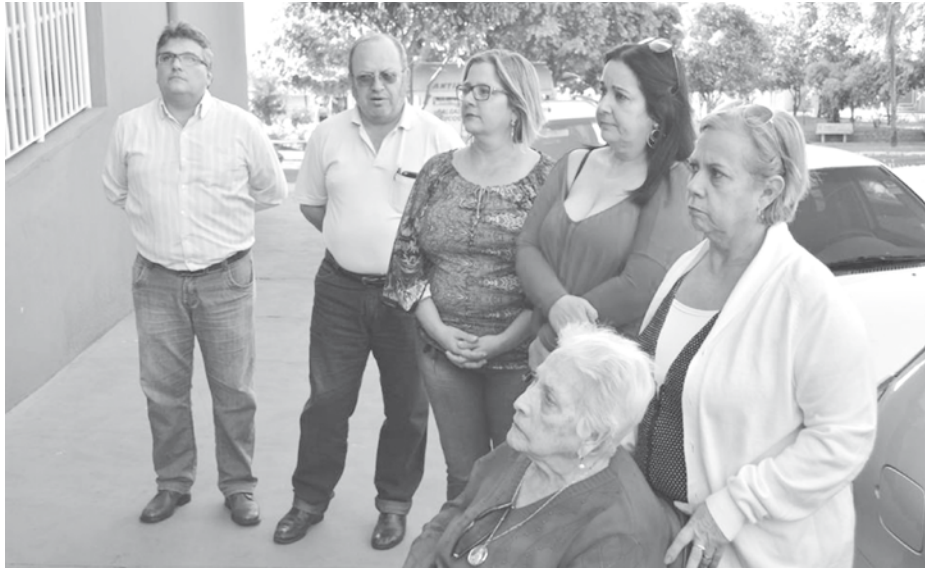
Entrega da Ampliação do Cadip