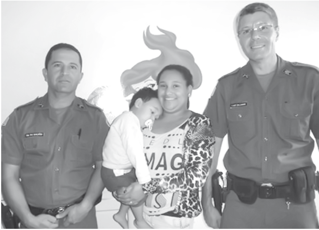
Mãe e a criança juntamente com os policiais que prestaram socorro

No comunicado enviado à imprensa, o 16º BPMI destacou a agilidade da ação dos policiais para salvar a vida da criança, que já havia perdido o irmão gêmeo por problemas cardíacos. “Denota-se que, a ação rápida e eficaz dos policiais militares envolvidos na ocorrência, assim como o pronto atendimento realizado pelo Oficial Médico no Pronto Socorro evitaram uma perda irreparável para a família, visto que, a criança tinha um irmão gêmeo que faleceu com 8 dias de vida por problemas parecidos. A ocorrência trouxe aos militares a sensação do dever