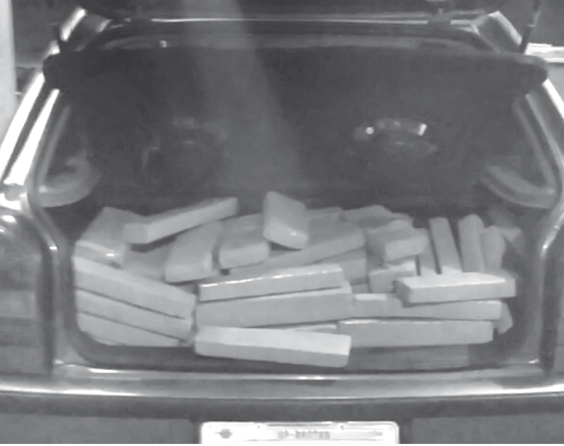
Parte da maconha estava no porta-malas do veículo