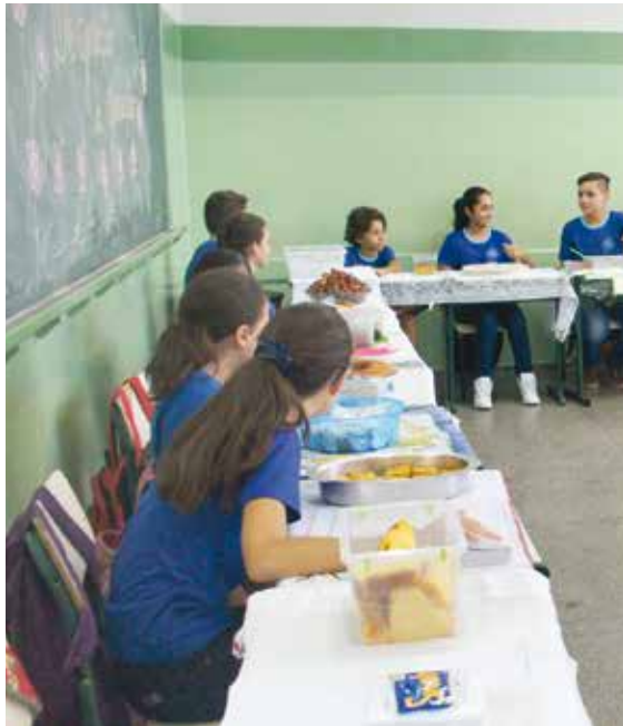
Momentos especiais do dia da degustação dos alimentos em sala de aula

Programa de Alimentação Escolar (P.A.A.) foi finalizado com um vídeo das produções e um livro de receitas on-line, contendo todas as delícias preparadas pelos alunos com suas respectivas famílias. Na última sexta-feira (20),