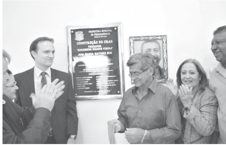
Inauguração CRAS Aparecido Duarte Vieira