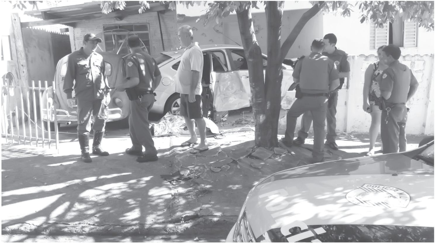
O condutor do veículo estaria em alta velocidade no momento do acidente: estrondo do forte impacto chamou a atenção da vizinhança