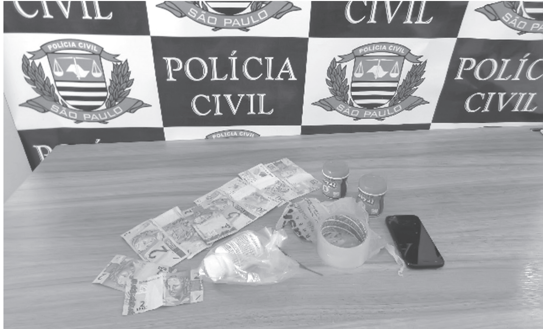
A Polícia apreendeu porções de cocaína, dinheiro, retalhos plásticos, pó Royal, utilizado no “batismo” da cocaína, e um aparelho celular

caminhado à Cadeia Pública de Guarani d'Oeste, onde ficará à disposição da Justiça por tráfico de drogas.