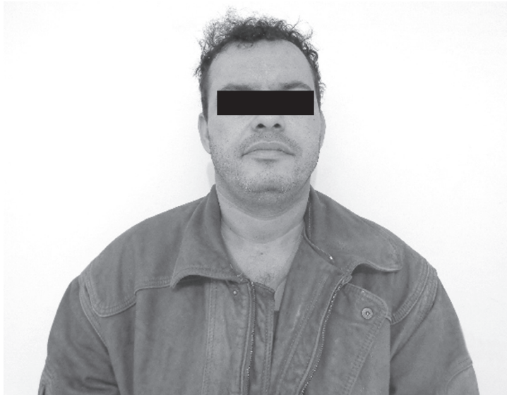
A.R.P., 38 anos, era morador do Jardim das Flores, em Ouroeste

O mandado foi expedido pela Justiça de Ouroeste. Na casa do acusado, a Polícia apreendeu porções de cocaína, dinheiro, que provavelmente é da comercialização de drogas, retalhos plásticos, pó royal, utilizado para fazer a mistura da cocaína, conhecido como “batismo”, e um aparelho celular.