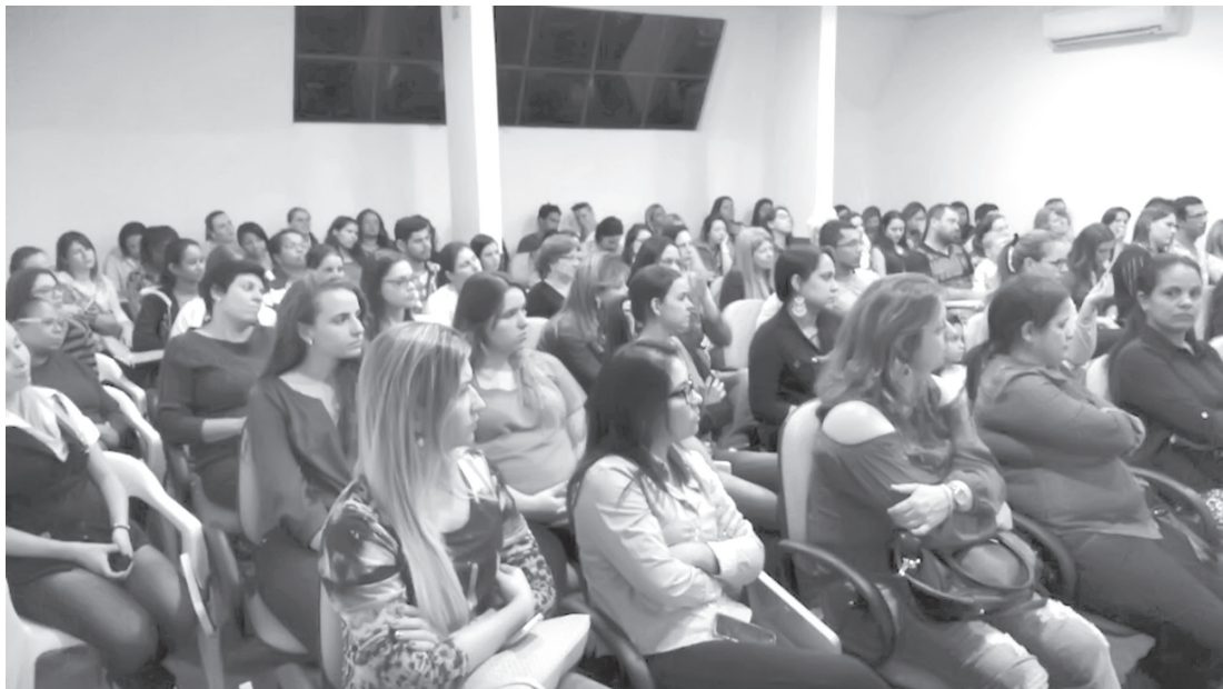
Semana de Enfermagem reuniu colaboradores da Santa Casa, AME e Serviço de Reabilitação do Lucy Montoro

gratularmos por termos escolhido uma atividade que nos faz sentir realizados em ter a oportunidade de cuidar e auxiliar ao próximo e promover a saúde”, destaca.