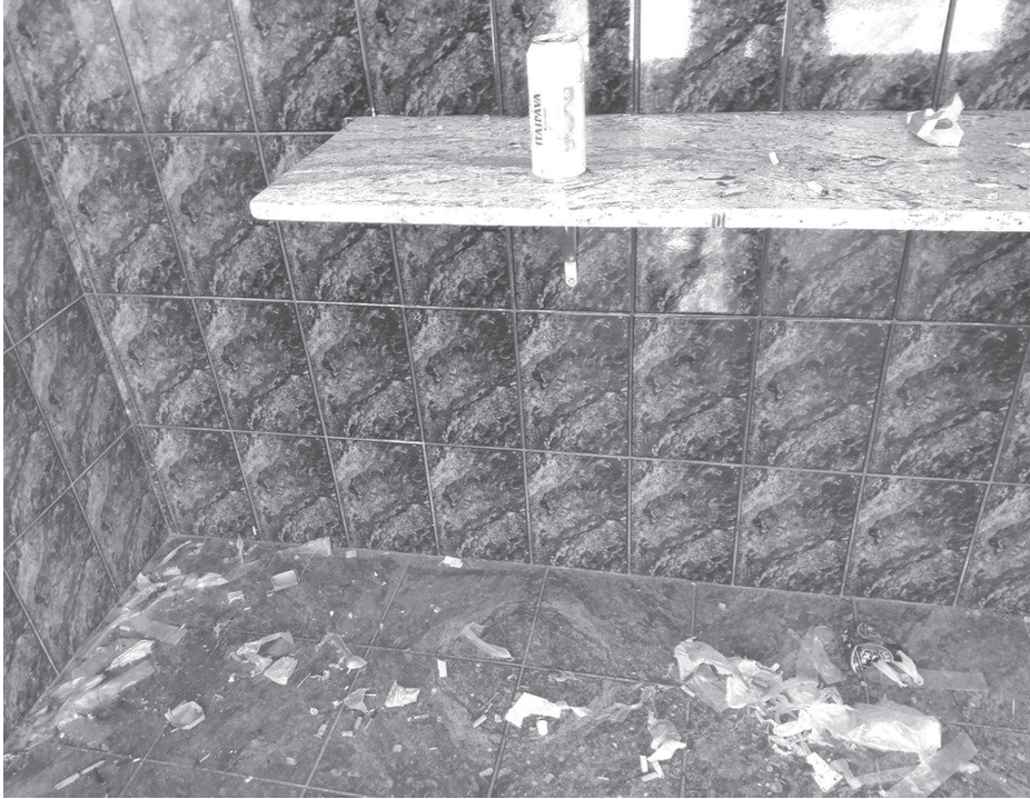
Polícia Civil investiga a ação de traficantes nos dois cemitérios da cidade; até túmulos são usados para esconder drogas

cais e foram apreendidas porções de crack, maconha e embalagens utilizadas no crime, que prevê de 5 a 15 anos de prisão, em caso de condenação.