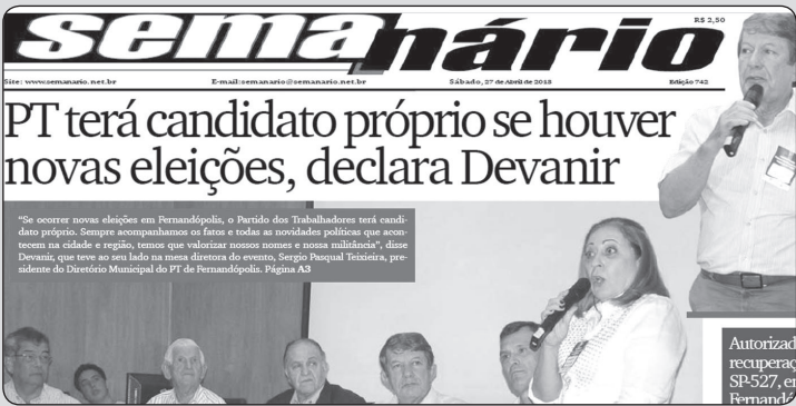
Capa do “Semanário” de abril de 2013: PT ameaçou!