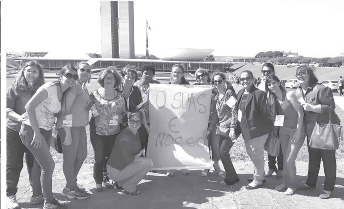
Assistentes Sociais representantes da região durante o evento em Brasília