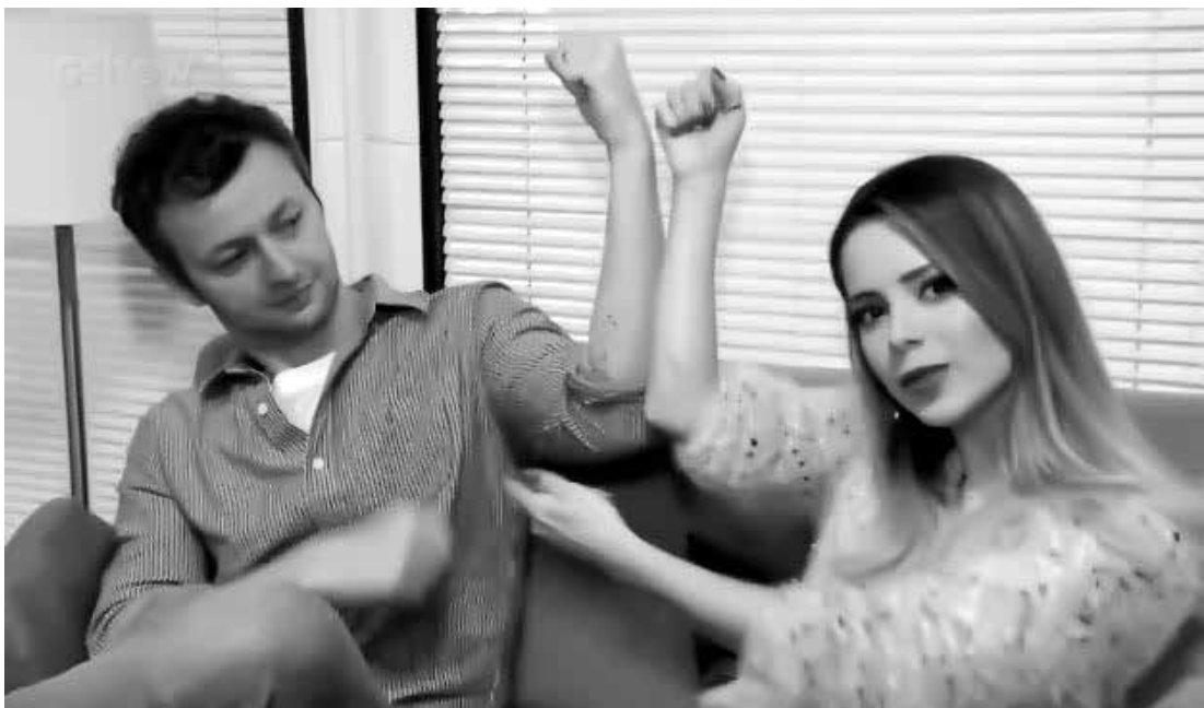
Sandy e Lucas Lima mostram tatuagem que fizeram no braço para homenagear o filho Theo

O desenho apareceu pela primeira vez no clipe de “Me Espera”, protagonizado por Sandy e Tiago Iorc. A cantora tentou explicar junto com o marido como a ideia do desenho surgiu. “Eu não tenho certeza se fui eu ou ele. Eu acho que foi ele. A gente ficou planejando e deu muita vonta-