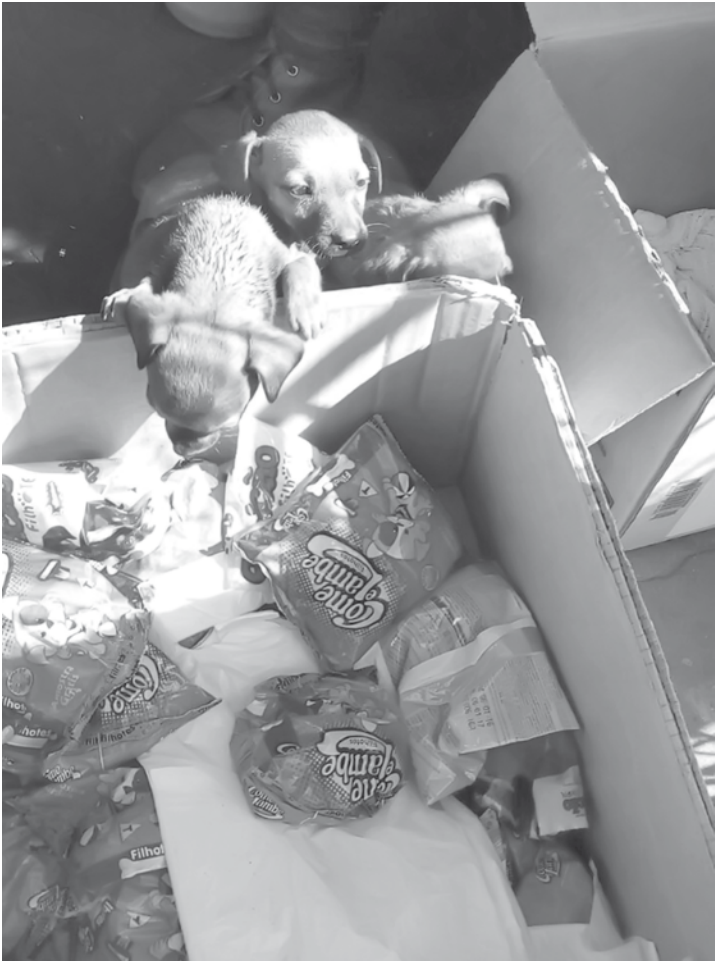
Filhotes encontrados abandonados perto do Recinto de Exposições

Segundo a cuidadora, os custos mensais, que giram em torno de R$ 2 mil, dificultam, porém, não “falam mais