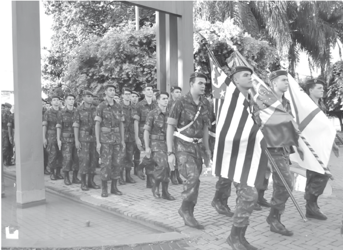
Jovens do sexo masculino que completam 18 anos em 2016, e também aqueles que perderam o prazo em anos anteriores, devem procurar a Junta de Serviço Militar de Fernandópolis, anexo ao T.G., no Jardim Paulista

tirar passaporte, matricular-se em faculdade, ingressar no serviço público, candidatar-se na carreira política, obter registro de trabalho com carteira assinada, entre outros. O Serviço Militar inicial (obrigatório) tem duração de 10 a 12 meses, a contar de janeiro. O objetivo deste trabalho é contribuir para a formação do caráter cívico e da cidadania dos jovens brasileiros, introduzindo valores éticos, morais, físicos e culturais, difundidos e praticados nas Forças Armadas. Presentes em todo o território nacional, as