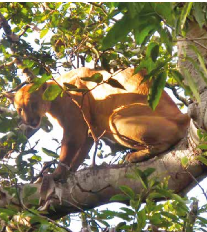
Três onças-pardas, capturadas nas proximidades da Usina Hidrelétrica de Promissão, em 2015, são monitoradas através de rádio-colares

Programa é desenvolvido em parceria com a ONG Instituto Pró-Carnívoros e tem o objetivo de preservar e avaliar a situação da fauna do entorno das usinas