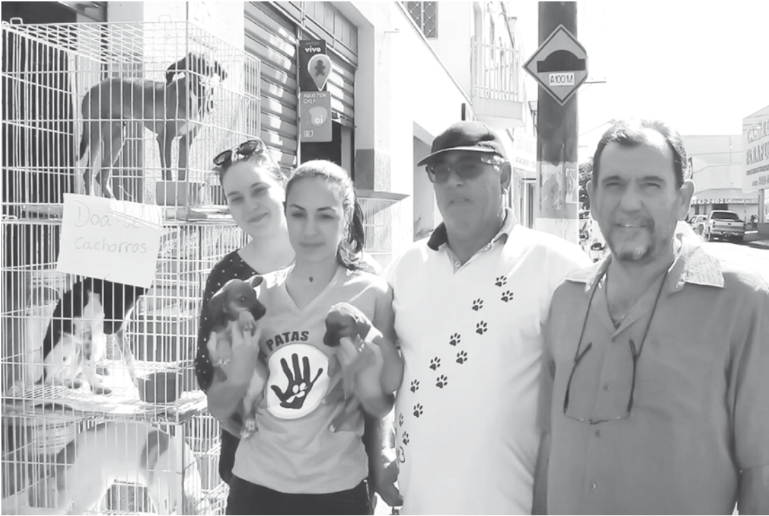
Animais resgatados receberam os devidos cuidados e estão bem de saúde

Vigora desde 2015, em todo o território nacional, uma lei que estabelece a proibição da venda e exploração de animais em vitrines e gaiolas. De acordo com a legislação, as lojas especializadas nos cuidados e na venda de animais de estimação terão que adequar os animais em um ambiente livre de exposição a barulhos, com acesso restrito para as pessoas, locais mais luminosos e também cada animal deverá ser adequado ao seu habitat natural.