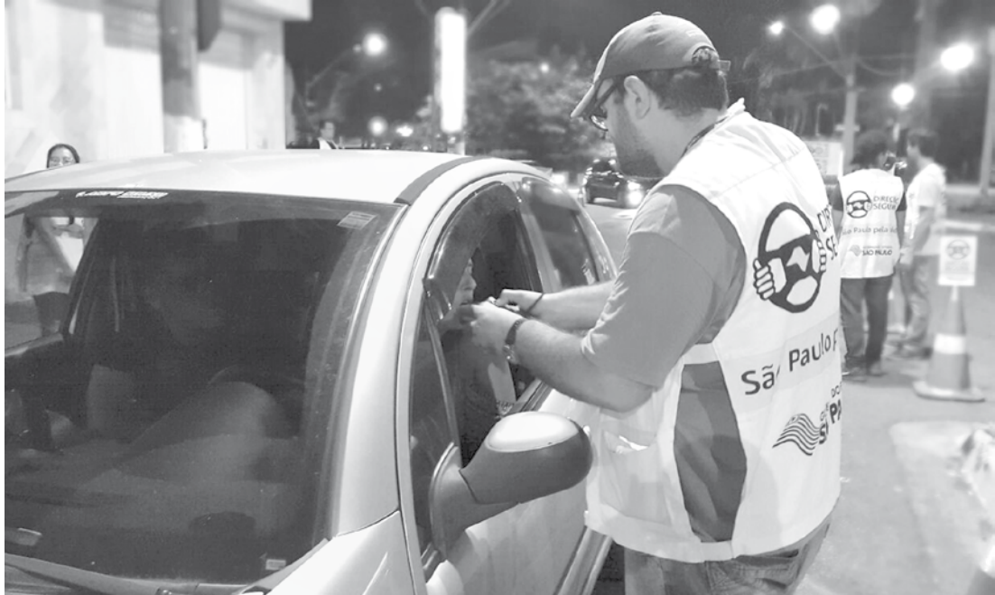
Blitze de fiscalização da Lei Seca em Catanduva foram realizadas durante a tarde deste domingo (12): 216 condutores foram submetidos ao teste do etilômetro

→ Da REDAÇÃO contato@oextra.net O Programa Direção Segura – ação coordenada pelo Detran.SP para a prevenção e redução de acidentes e mortes no trânsito causados pelo consumo de álcool combinado com direção – autuou 21 pessoas em operações de fiscalização da Lei Seca realizadas em Catanduva durante a tarde deste domingo (12). Durante as blitzes, realizadas na Rua Olímpia, foram aplicados, ao todo, 216 testes do etilômetro (conhecidos por bafômetro). Do total, oito condutores foram autuados por embriaguez ao volante e terão de pagar multa no valor de R$ 1.915,40 e responder a processo administrativo junto ao Detran.SP para a suspensão do direito de dirigir por 12 meses. Cinco desses motoristas, além das penalidades acima, responderão na Justiça por crime de trânsito. Eles apresentaram indi-