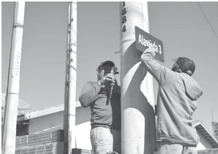
Implantação de placas com os nomes das ruas e sinalização de solo estão sendo realizadas em diversos bairros da cidade

Com a colocação das placas com os nomes das ruas já foram atendidos os bairros Paulistano, Parque Industrial, Ipanema e São Francisco, sendo que os dois últimos também receberam sinalização de solo.