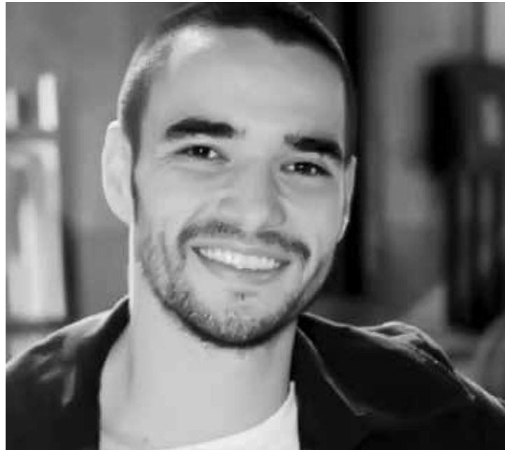
Caio Blat comenta seu papel de homossexual e, ‘Liberdade, Liberdade’

Successo em ‘Liberdade, Liberdade’, o ator Caio Blat decidiu falar sobre o seu personagem na novela da Globo, a relação que tem com os fãs e o casamento de oito anos com a atriz Maria Ribeiro.