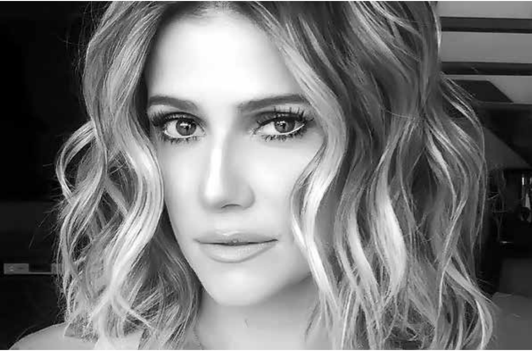
Deborah Secco voltará à TV antes do previsto como uma das protagonistas 'maduras' de 'Malhação: Pro Dia Nascer Feliz'