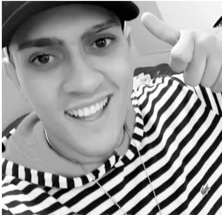
O funkeiro lamentou a falta de respeito de alguns seguidores e avisou: "Não vai ter mais vídeo sem camisa"