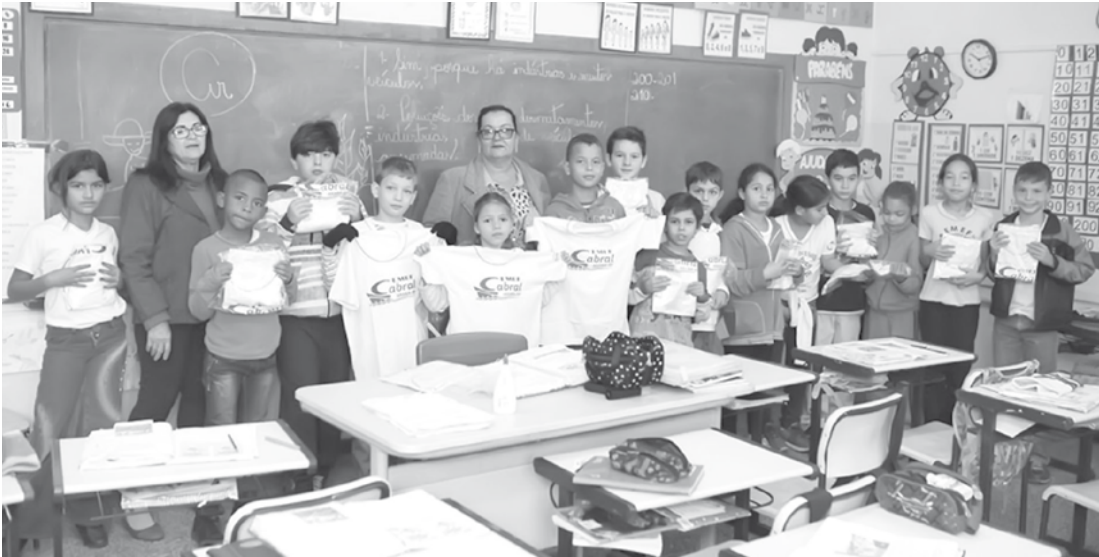
Em Arará, 110 alunos da EMEF José de Souza Cabral também foram contemplados com os uniformes