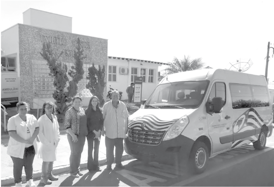
Veículo já foi adesivado e está atendendo as demandas locais

lação miraestrelense agradeço ao deputado André Soares pela iniciativa e atenção com o nosso município. A renovação da frota de veículos