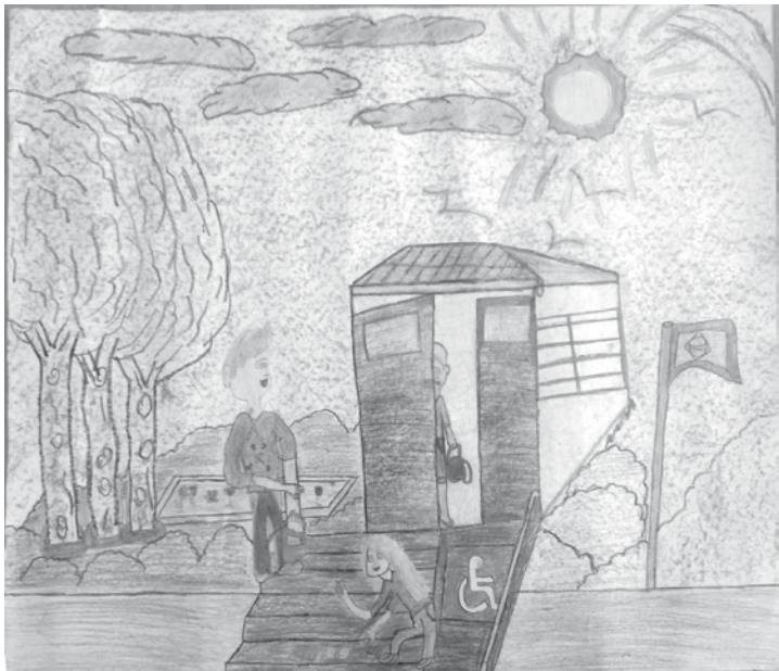
Estes são os três cartazes dos alunos fernandopolenses premiados no concurso do Lions Clube Internacional