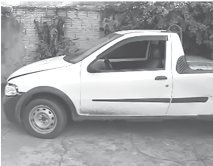
Automóvel, no qual a vítima estava quando foi sequestrada