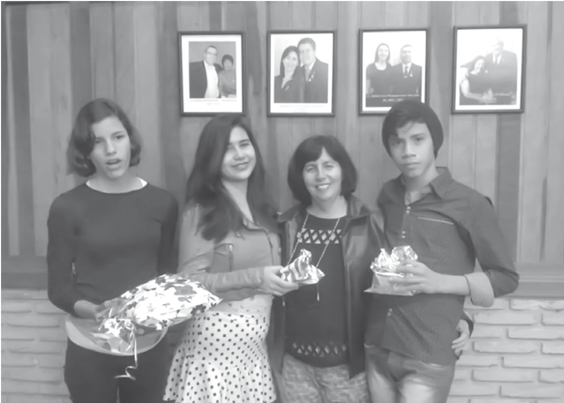
Registro da entrega dos prêmios aos alunos da Melvin Jones