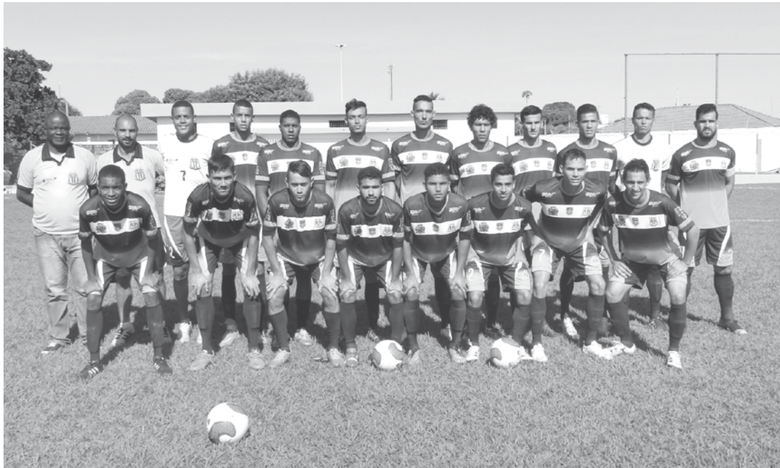
Equipe profissional do Clube Esportivo Ouroeste, que na 2ª rodada sofreu sua primeira derrota para a equipe do Real Sociedade, de Planalto

A Taça Paulista é o novo campeonato do Estado de