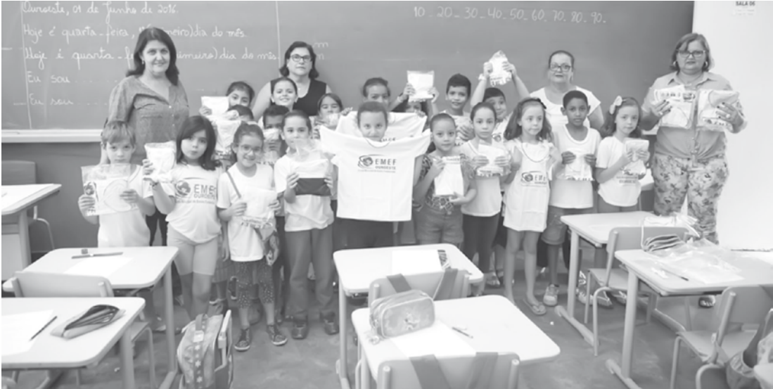
Cerca de 560 alunos da EMEF de Ouroeste receberam os uniformes gratuitamente