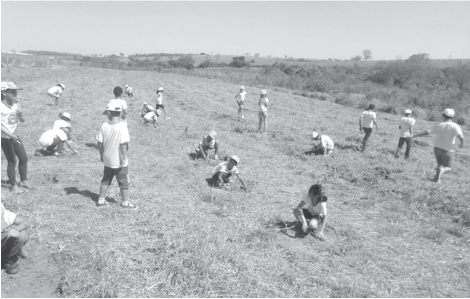
REFLORESTAMENTO: O incentivo ao plantio de mudas, cultivadas no Viveiro Municipal da EMEF “Melvin Jones”, é um dos destaques dos projetos desenvolvidos em Fernandópolis

lação. “Nós temos uma comunidade muito preocupada com o meio ambiente. Prova disso é a nossa coleta seletiva, que é um sucesso absoluto. Uma tonelada e meia de materiais recicláveis são enviadas por dia para a nossa cooperativa. Quando o poder público oferece esse tipo de instrumento, nossa população mostra o quanto está disposta a deixar um planeta melhor para as futuras gerações”, afirmou o secretário. A cidade triplicou, nos últimos dois anos, o percentual de moradores atendidos pelo serviço de coleta seletiva. Eram apenas 20% até 2014 e hoje são 60%. No lixo comum, a cobertura é de 100%. Para diminuir a polui-