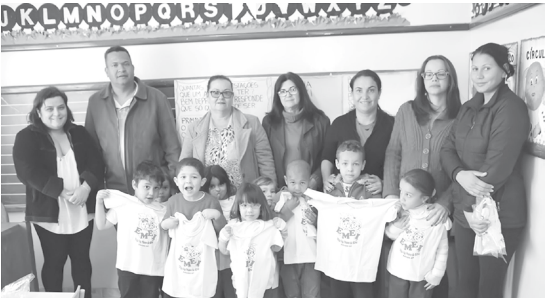
Cerca de 40 crianças da EMEI Olga foram beneficiadas com os uniformes escolares

Ainda segundo o prefeito Tião Geraldo, mesmo diante de uma crise financeira e do corte de gastos, manter a distribuição gratuita de uniformes é manter um compromisso com uma educação de qualidade. Para a direção das escolas, incentivar o uso do uniforme escolar é também uma forma de manter a organização da instituição de ensino.