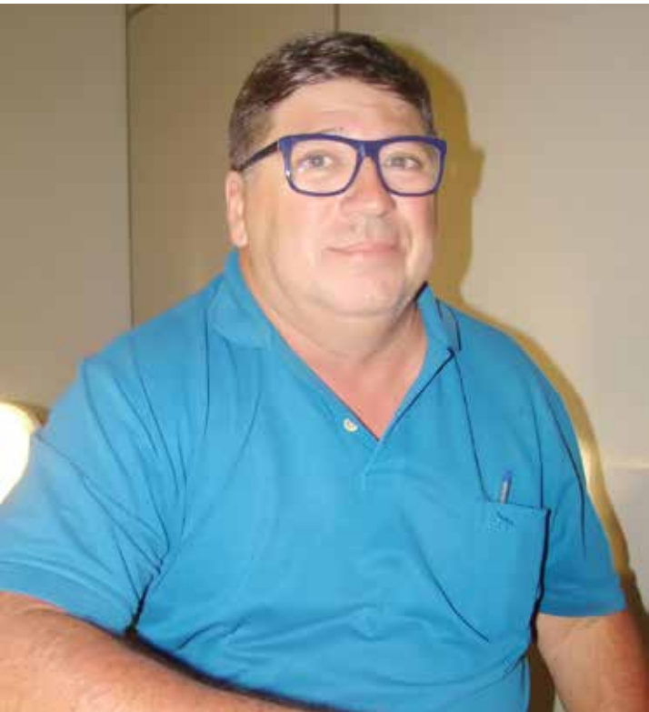
Homenagem na Câmara. Como comunicador destaque