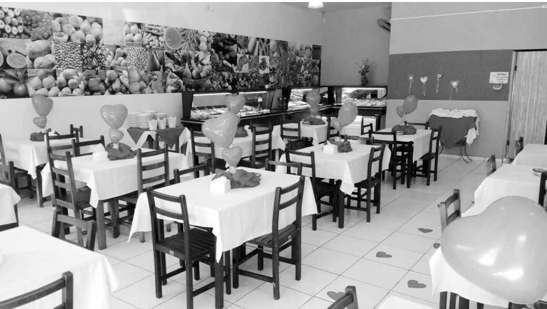
A nova direção proporcionou um ambiente ainda mais agradável, que contribuiu para um clima de aconchego

O Varanda'S Restaurante, localizado no centro da cidade de Ouroeste, e que recentemente passou a ser comandado pela nutricionista Priscila Prestes, promoveu no último domingo, dia 12, um almoço em clima romântico para celebrar o Dia dos Namorados. A nova direção proporcionou um ambiente ainda mais agradável, que contribuiu para um clima de aconchego. O "Almoço dos Namorados" atraiu um grande número de casais para prestigiar o cardápio diferenciado, que vem a cada dia sendo saboreado por mais clientes. Confira alguns momentos: