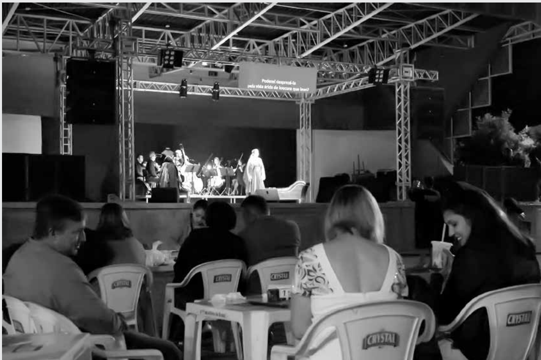
A Ópera “contada e cantada”, encantou o público que prestigiou o espetáculo

Pela primeira a Companhia Ópera Curta - "La Traviata"- a Ópera "contada e cantada", se apresentou na Praça de Eventos de Ouroeste, encantando o público de toda região que prestigiou o espetáculo em sua temporada 2016. A companhia vem realizando turnês gratuitas de espetáculos de teatro musicais com apoio da Secretaria de Estado da Cultura. De acordo com o prefeito Tião Geraldo, foi uma grande atração, digna de cultura ímpar para o município. "La Traviata" é uma das mais conhecidas óperas de Giuseppe Verdi", disse o prefeito. O espetáculo teve a produção da "Casa da Ópera", foi executado pela APAA - Associação Paulista dos Amigos da Arte e contou com o apoio da Prefeitura de Ouroeste, por meio da Secretaria da Cultura do município.