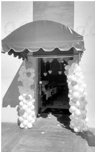
"Almoço dos Namorados" atraiu um grande número de casais para prestigiar o cardápio diferenciado