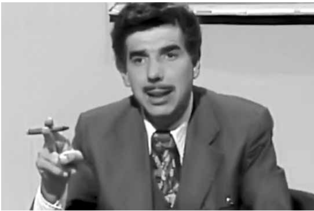
Interpretando Professor Girafales; no outro registro, pouco antes de falecer

bilitada há anos, o artista foi aconselhado por médicos a se mudar para o litoral, por causa da diferença de altitude, que influencia na pressão arterial. Por causa disso, não ia à Cidade do México e nem fazia viagens de longas distâncias, o que o impedia de vir ao Brasil com frequência.