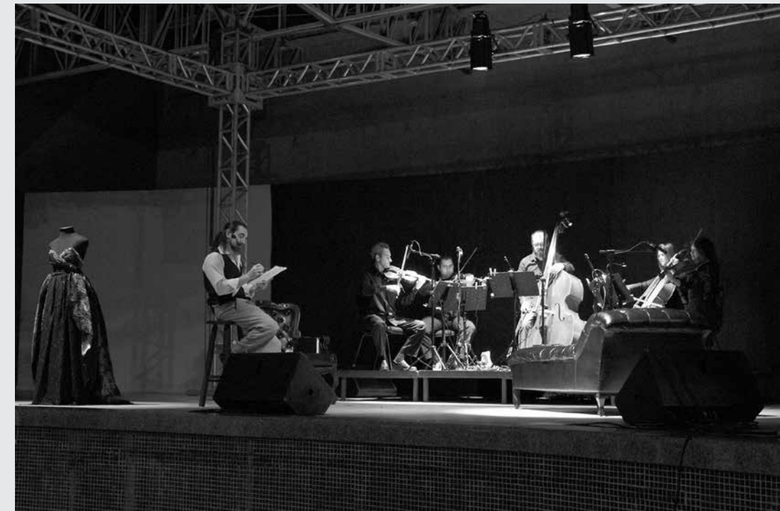
Companhia de Ópera Curta se apresentou na Praça de Eventos em Ouroeste