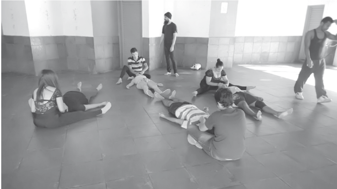
Workshop da Cia de Dança, realizado na tarde de ontem na Secretaria de Esporte, Lazer e Cultura

Aprisionada”, da Rio Preto Cia de Dança encerrou o primeiro dia. Hoje, a programação continua às 10h e às 15h, no Teatro Municipal, com o espetáculo “O Lugar de Onde se Vê”, apresentado pela Cia Ouro Velho de São Paulo. Cerca de 250 artistas estão envolvidos no João, que pela primeira vez, acontece em di-