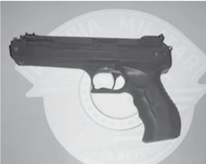
A Polícia Militar apreendeu também o simulacro de arma de fogo

sados foram levados para o Plantão Policial para prestar esclarecimentos. Posteriormente, foram encaminhados à Cadeia Pública de Jales, onde permanecem à disposição da Justiça. O adolescente também está na Cadeia de Jales, em uma cela especial à disposição da Vara da Infância e da Juventude. A Polícia não divulgou informações sobre a quantia em dinheiro encontrada com os homens. As vítimas reconheceram o automóvel utilizado nos roubos. O caso é investigado.