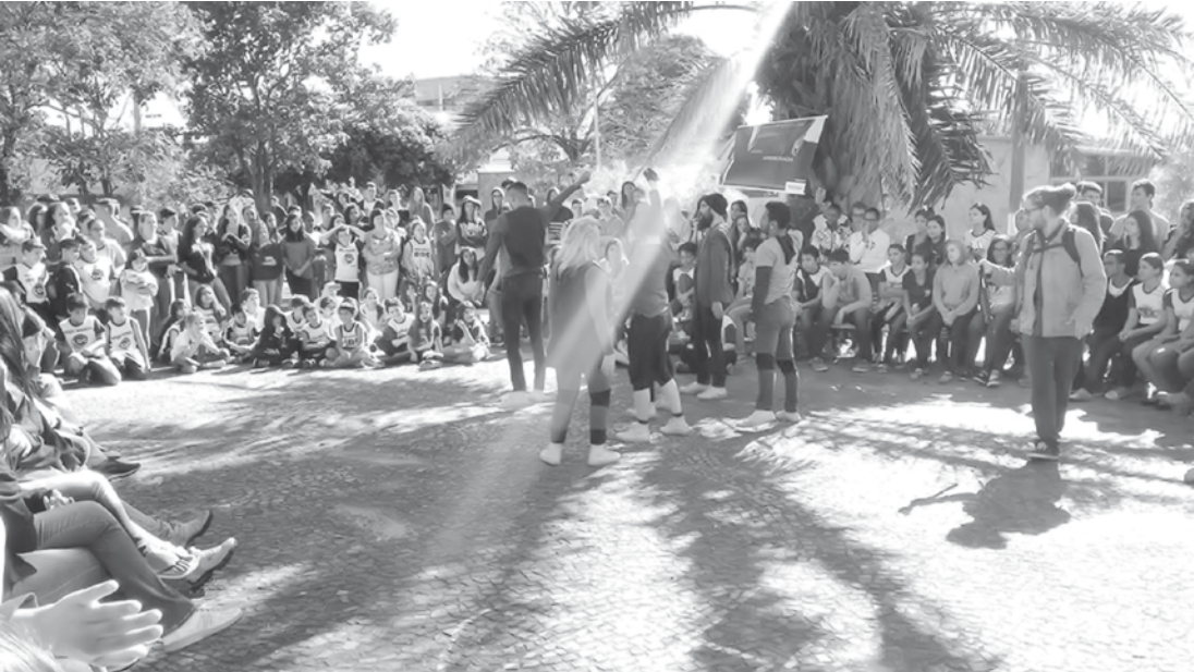
“Aos que Aqui Estão”, da Rio Preto Cia de Dança, se apresentou ontem de manhã, na Praça da Aparecida

→ ASSESSORIA DE IMPRENSA Prefeitura de Fernandópolis Na manhã de ontem (20), a Praça da Aparecida, foi palco do espetáculo de dança “Aos que Aqui Estão”, da Rio Preto Cia de Dança. Um grande público prestigiou o evento que deu início a edição deste ano do Festival Cultural Meu Nome