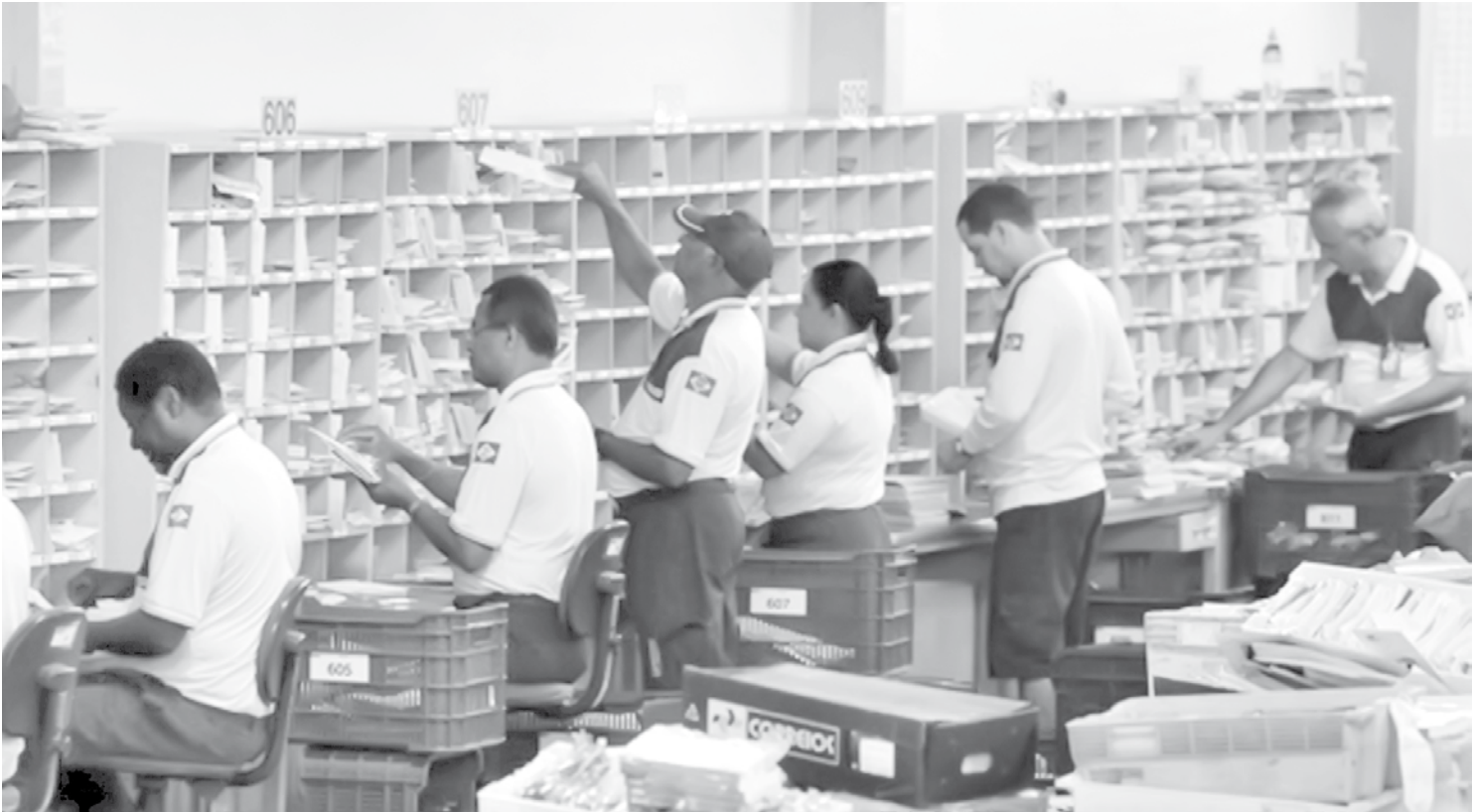
Novo reajuste acontece após seis meses do aumento anterior

Com o aumento progressivo da população e o crescimento acelerado e desordenado das cidades, cresce também a criminalidade, que se torna cada vez mais presente no cotidiano das pequenas, médias e grandes cidades. As consequências deste crescimento desordenado são graves e problemas sociais como fome, miséria, desemprego e marginalização, que associados à falta de investimento em políticas de segurança pública, contribuem para o aumento dos atos de violência. Como em outras problemáticas que envolvem a coletividade, faz-se necessária ação conjunta voltada à redução das desigualdades sociais, que tem como pano de fundo uma educação de qualidade e uma economia estável, aliado às políticas de segurança pública que garantam a estrutura necessária e de pessoal para que se possa trabalhar mais na prevenção.