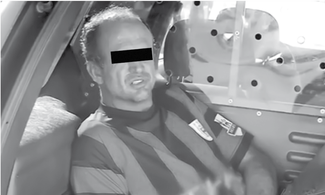
Acusado no momento em que era transferido à Cadeia Pública de Jales