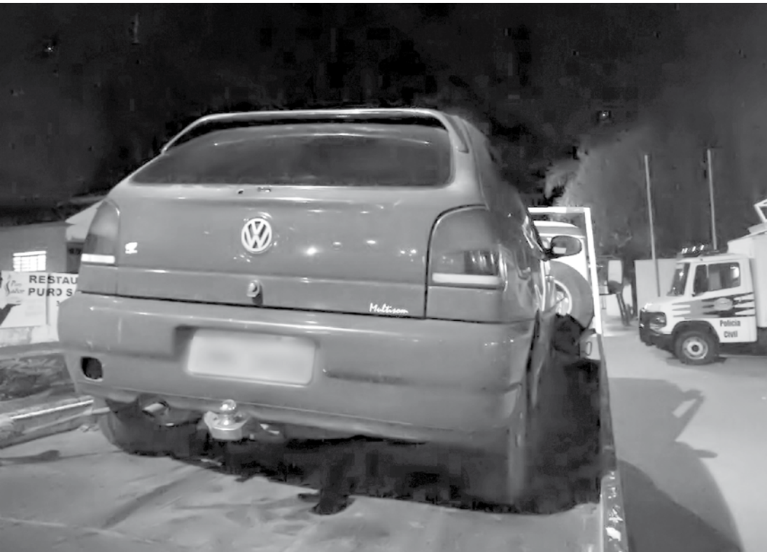
Automóvel utilizado pelo trio nos assaltos foi apreendido

sados foram levados para o Plantão Policial para prestar esclarecimentos. Posteriormente, foram encaminhados à Cadeia Pública de Jales, onde permanecem à disposição da Justiça. O adolescente também está na Cadeia de Jales, em uma cela especial à disposição da Vara da Infância e da Juventude. A Polícia não divulgou informações sobre a quantia em dinheiro encontrada com os homens. As vítimas reconheceram o automóvel utilizado nos roubos. O caso é investigado.