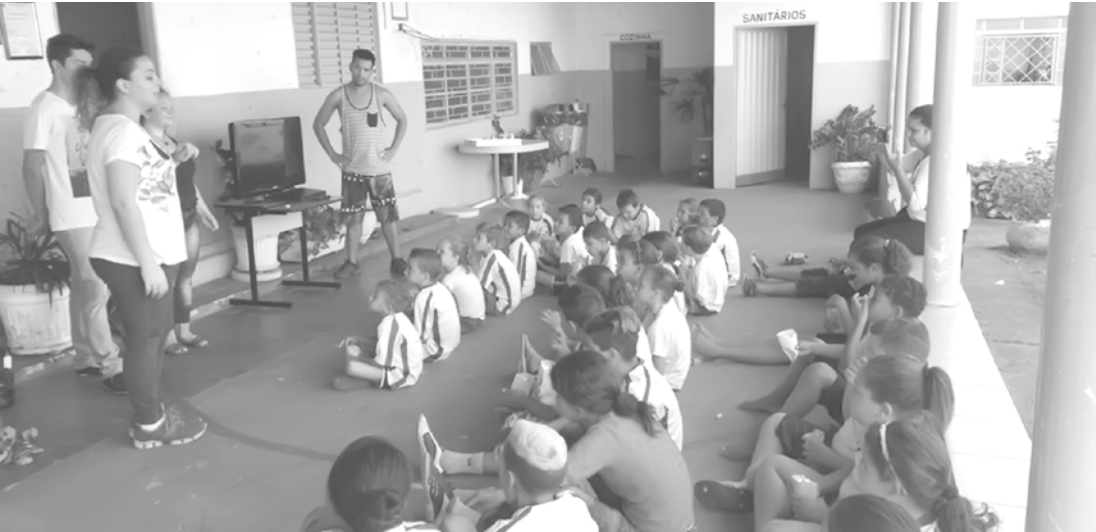
Os estagiários e voluntários da Secretaria Municipal de Esporte, Lazer e Cultura são os responsáveis por apresentar as histórias às crianças

SAPAMA, que tem apoio das Secretarias de Educação, Assistência Social e Cultura. Já nesta semana, serão realizadas atividades nos Cras (Centros de Referência de Assistência Social), quando serão oferecidas oficinas de hortas verticais. Também haverá a continuidade da gincana com os alunos do quinto ano do ensino fundamental das escolas do município, que é composta por uma redação referente ao meio ambiente, arrecadação de produtos recicláveis e também um quiz, que finalizará a competição entre unidades escolares no próximo dia 30.