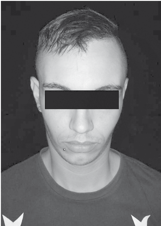
Pai e filho estão presos à disposição da Justiça na Cadeia Pública de Jales