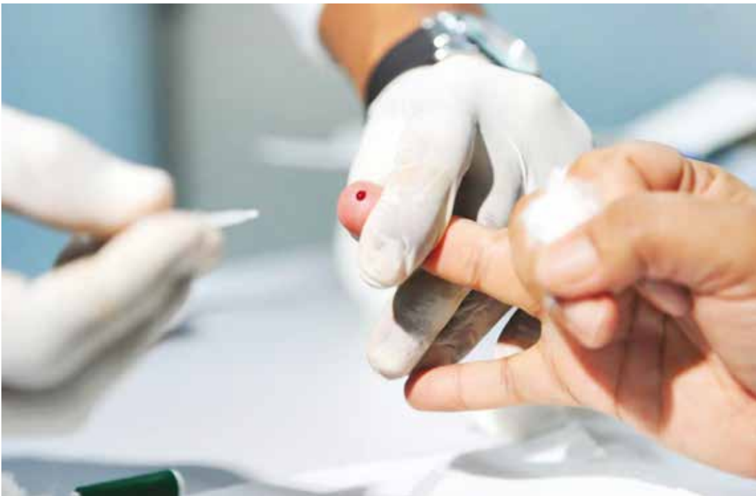
Parceria viabiliza testes gratuitos na praça para toda a população no próximo dia 25

O público-alvo é composto por pessoas com idade acima de 40 anos ou que tenham tatuagens. Caso o resultado do exame realizado durante a campanha seja positivo, a pessoa será encaminhada para fazer um novo teste que confirmará a doença. Na ocasião, outras atividades também serão realizadas no evento como: exame de anemia, massagem de relaxamento, aula de zumba, orientação sobre uso de medicamentos, aferição de pressão arterial e outras. Mais informações na Secretaria Municipal de Saúde no telefone (17) 3465 0566.