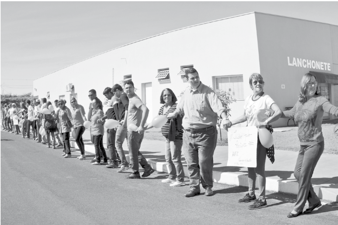
Participantes da mobilização em Fernandópolis durante “abraço ao Hospital do Câncer” da cidade