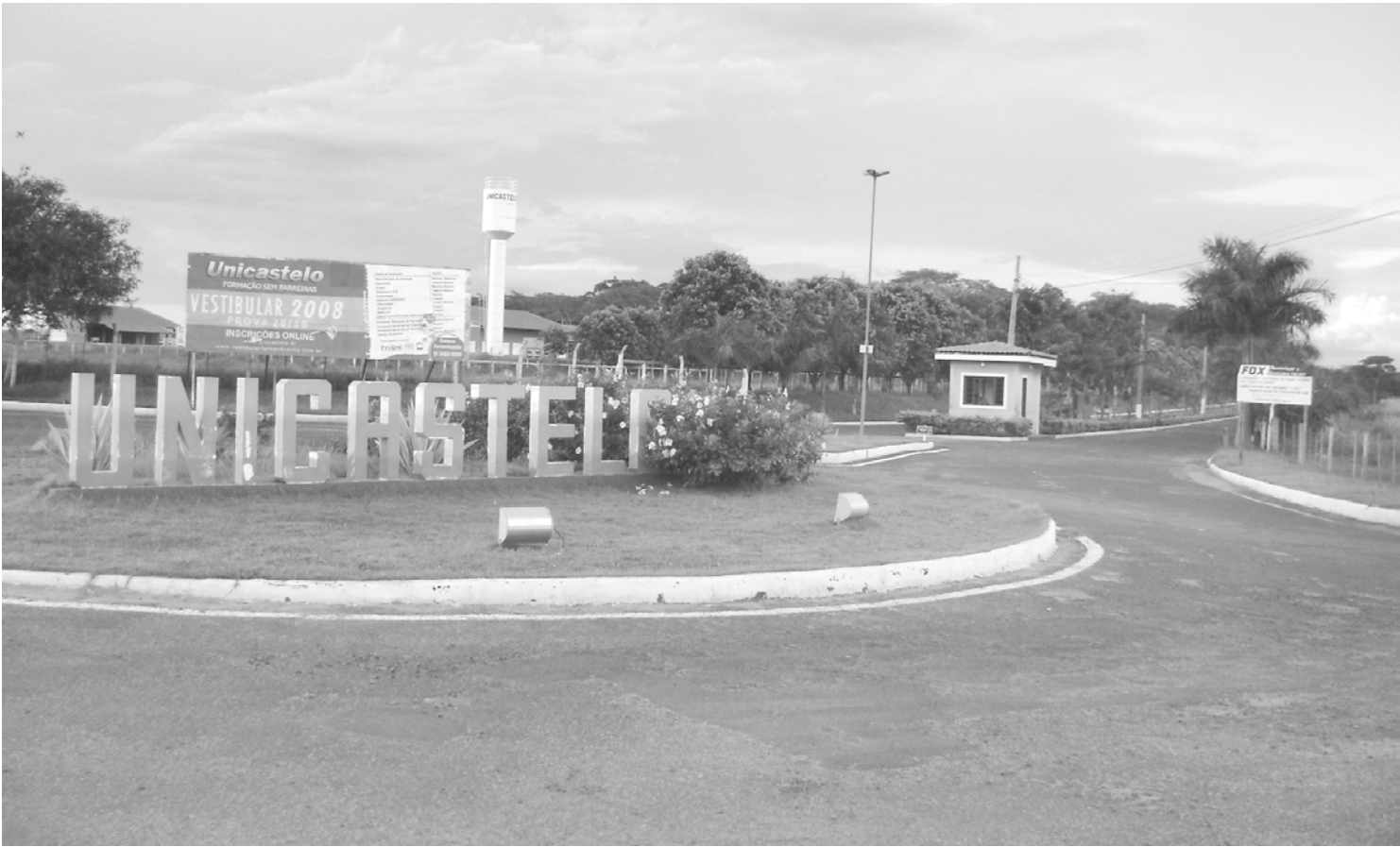
Campus da Unicastelo em Fernandópolis: informação sobre a venda da Universidade não foi confirmada oficialmente

pal representante do “grupo mantenedor” da instituição. O ‘Icesp’ consta, inclusive, como proprietário do Campus Fernandópolis da Unicastelo desde dezembro de 2007, no endereço Estrada Projetada F1, S/N, Fazenda Santa Rita. Vale ressaltar que o Grupo Uniesp vem adquirindo importantes instituições de ensino superior pelo país nos últimos anos, entre estas aquisições, e uma das maiores negociações comerciais já consumadas, foi a compra da Unicapital, que possui dois prédios com diversas faculdades, ambos no Bairro da Mooca, em São Paulo, e ainda o imóvel que abriga um anfiteatro, também na Capital. Outro fato que impediria a aquisição da Unicastelo, com Campus em Fernandópolis, Descalvado e São Paulo, é que a instituição de ensino possui caráter “filantrópico”, ficando impedida sua alienação através de uma negociação de