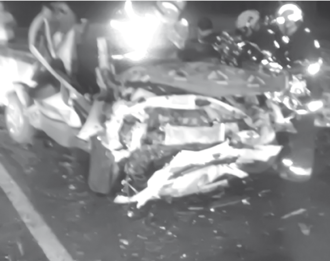
Uma pessoa acabou morrendo no acidente