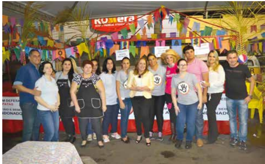
Diversas atrações marcaram as duas noites de festa