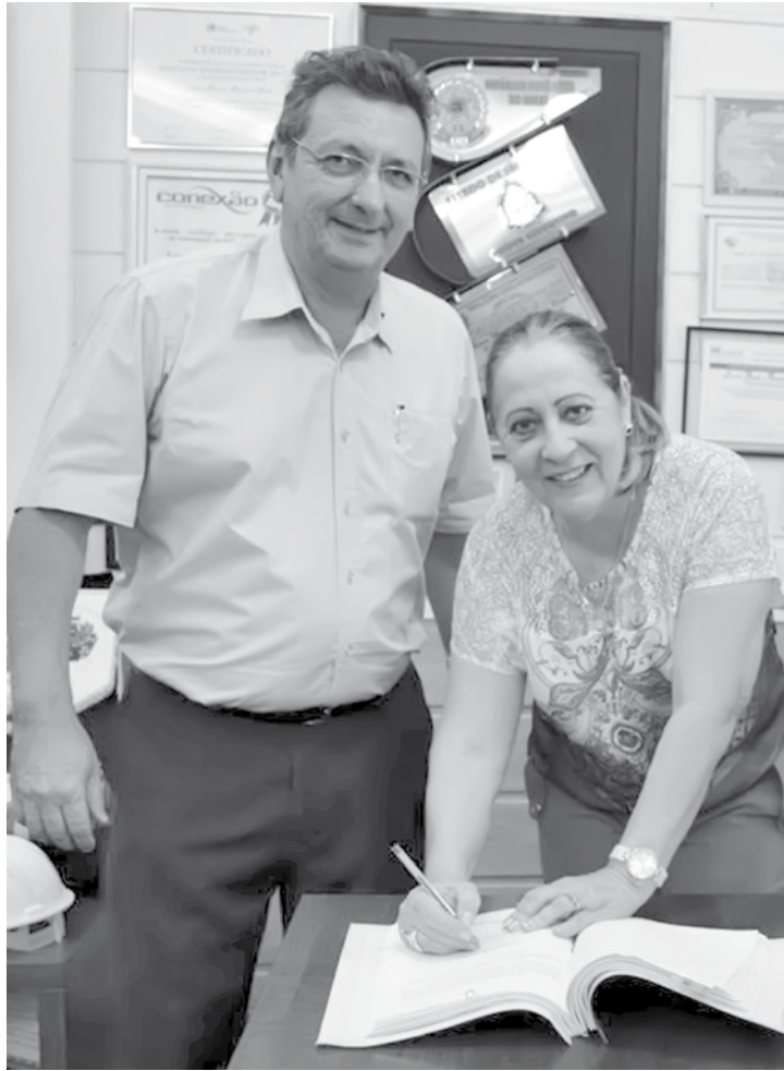
Ana Bim e Zambon republicam aviso de licitação para a escolha de empresa

As empresas que se instalam em ZPE têm acesso a tratamentos tributário, cambiais e administrativos específicos e o principal requisito é o seu caráter eminentemente exportador, ou seja, as empresas devem auferir e manter receita bruta decorrente de exportação para o exterior de, no mínimo, 80% de sua receita bruta total.