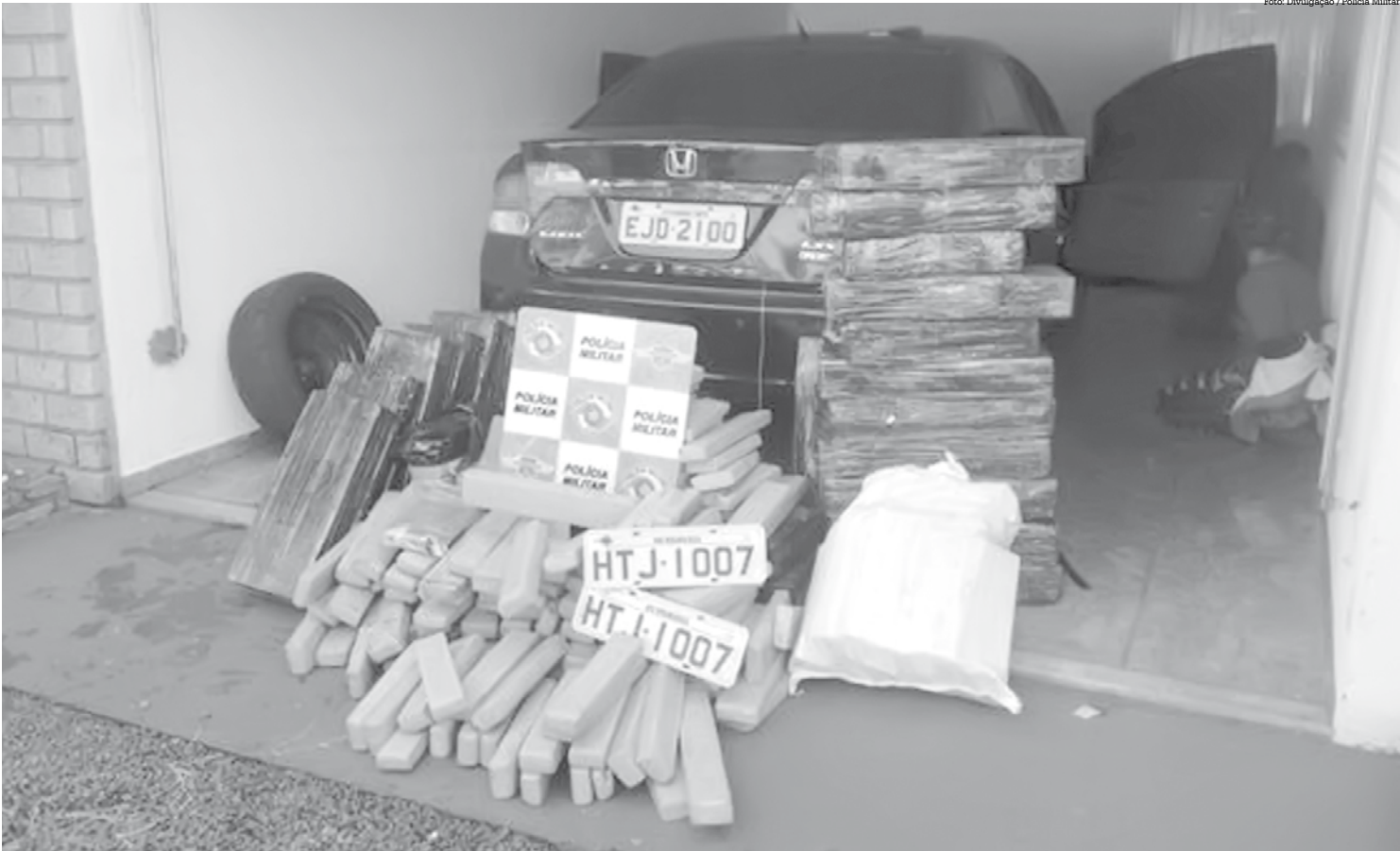
A droga, apreendida em Jales, estava no porta-malas de um Honda Civic, que foi roubado em Rio Claro

minhada para a Polícia Federal de São José do Rio Preto. JALES E outras 03 pessoas foram presas e quase meia tonelada de maconha foi apreendida, também pela Polícia Rodoviária Estadual, na manhã desta terça-feira (21), na Rodovia Euclides da Cunha (SP-320), em Jales. Segundo informações da Polícia, um veículo suspeito, um Honda Civic, foi abordado no quilômetro 588. A droga, dividida em tabletes, que somaram 492,260 quilos de maconha, estava no porta-malas do carro. O trio disse à Polícia que trazia a droga de Mato Grosso do Sul e a entregaria em São José do Rio Pardo. Os três acusados, a droga e o carro foram encaminhados para a Polícia Federal de Jales. Ainda de acordo com a Polícia, o Honda Civic havia sido roubado em Rio Claro, no mês de maio.