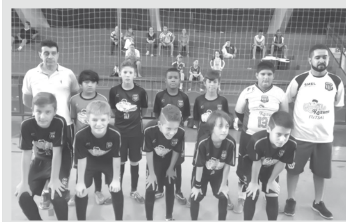
Equipes estão se destacando em diversas competições