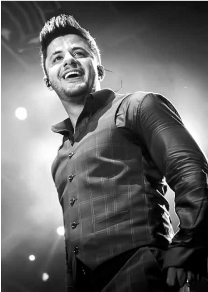
Cristiano Araújo: livro conta histórias de bastidores da última turnê do cantor