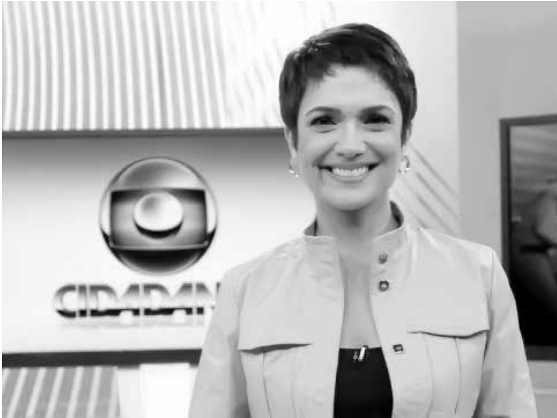
Sandra Annenberg falou sobre a desigualdade entre homens e mulheres

ar diariamente no “Jornal nacional”, na ocasião como garota do tempo. Desde cedo, ela questionava o porquê das desvantagens do sexo feminino em relação ao sexo masculino. “Sou de um tempo em que o homem abria o telejornal e a mulher vinha em sequência. Eu perguntava: “Por que todo dia ele que abre?”. Parece bobagem, mas é muito significativo. Socialmente, a mulher sempre teve um papel menor, profissionalmente menor ainda. Os salários são mais baixos, mesmo na mesma função de um homem”.