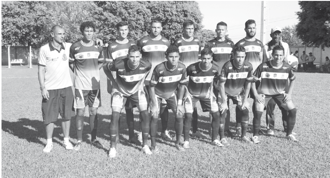
Equipe técnica e jogadores profissionais que defendem o Clube Esportivo Ouroeste