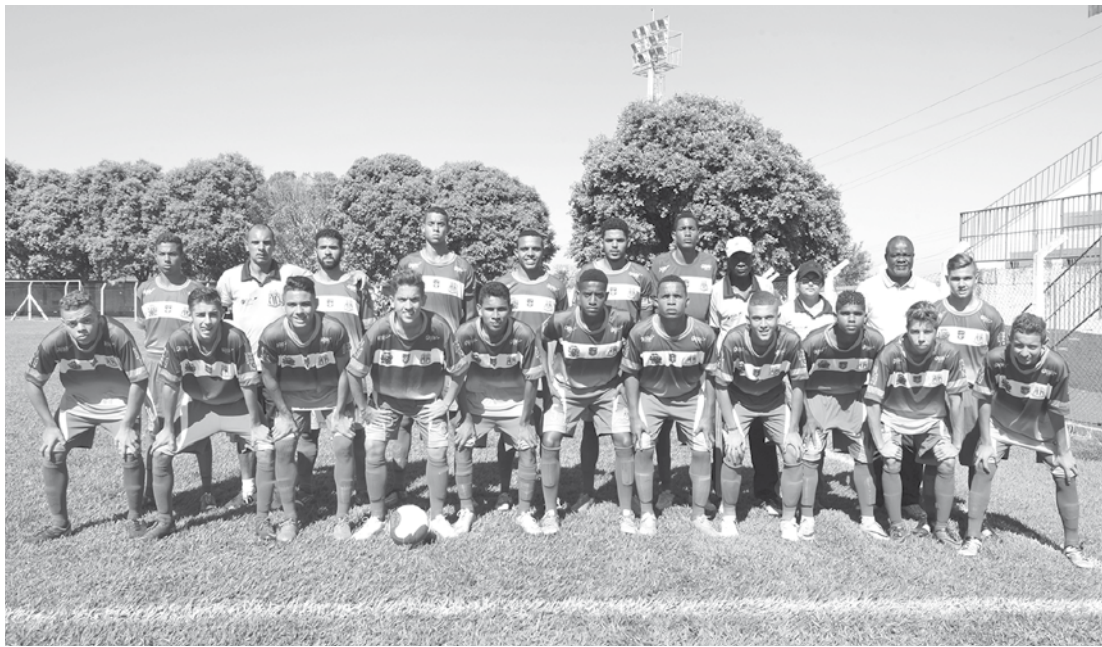
Atletas que compõem a base do Clube Esportivo Ouroeste na categoria Sub-18