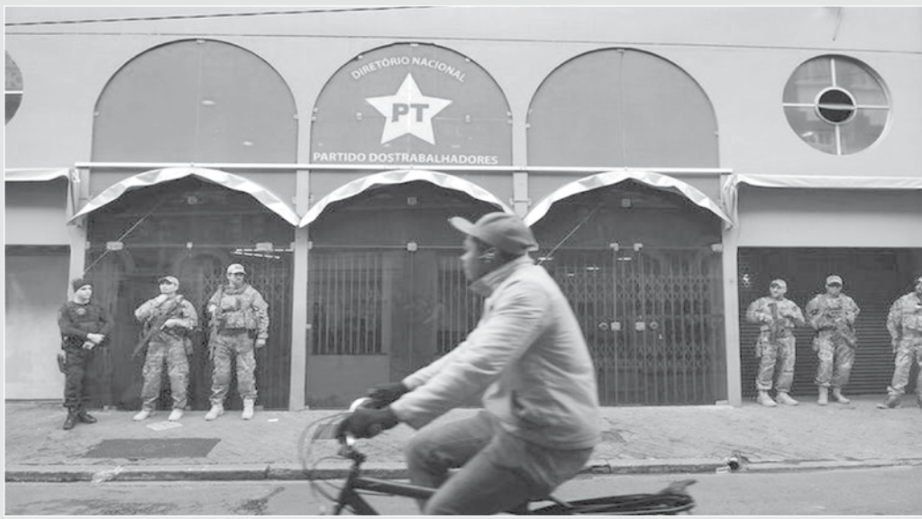
imagem da semana

A imagem provém das câmeras do Jornal JB, que clicou o exato mo- mento em que um ci- dadão, de bicicleta, passa em frente à se- de nacional dos Parti- dos dos Trabalhados, ocupada por policiais federais, em mais uma operação da Lava Jato - a Custo Brasil - que apura desvios de R$ 100 milhões no Minis- tério do Planejamento. A corrupção parece in- terminável!