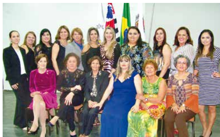
Damas da Casa da Amizade do Rotary Club Fernandópolis