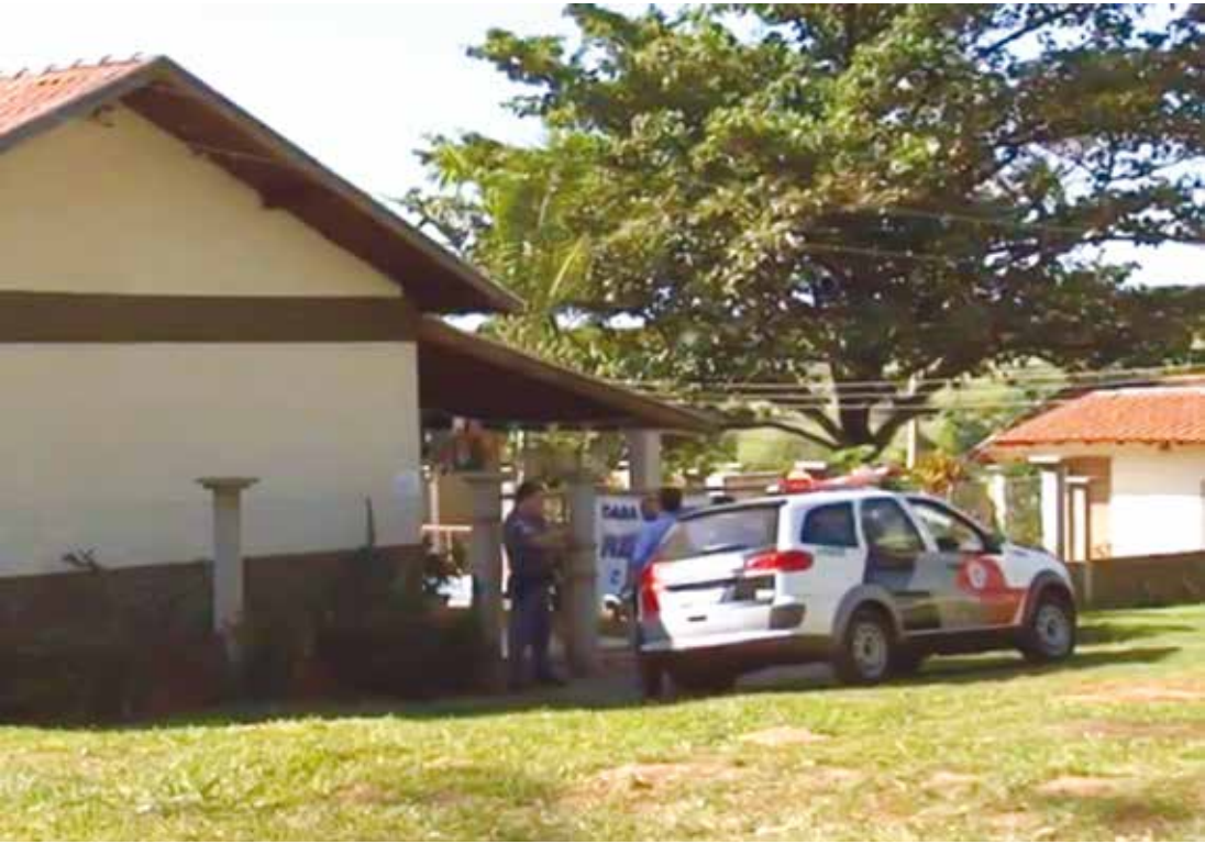
Polícia Militar esteve na casa de repouso registrando as irregularidades