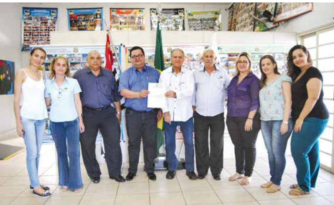
Equipe do projeto e apoiadores da conquista do certificado