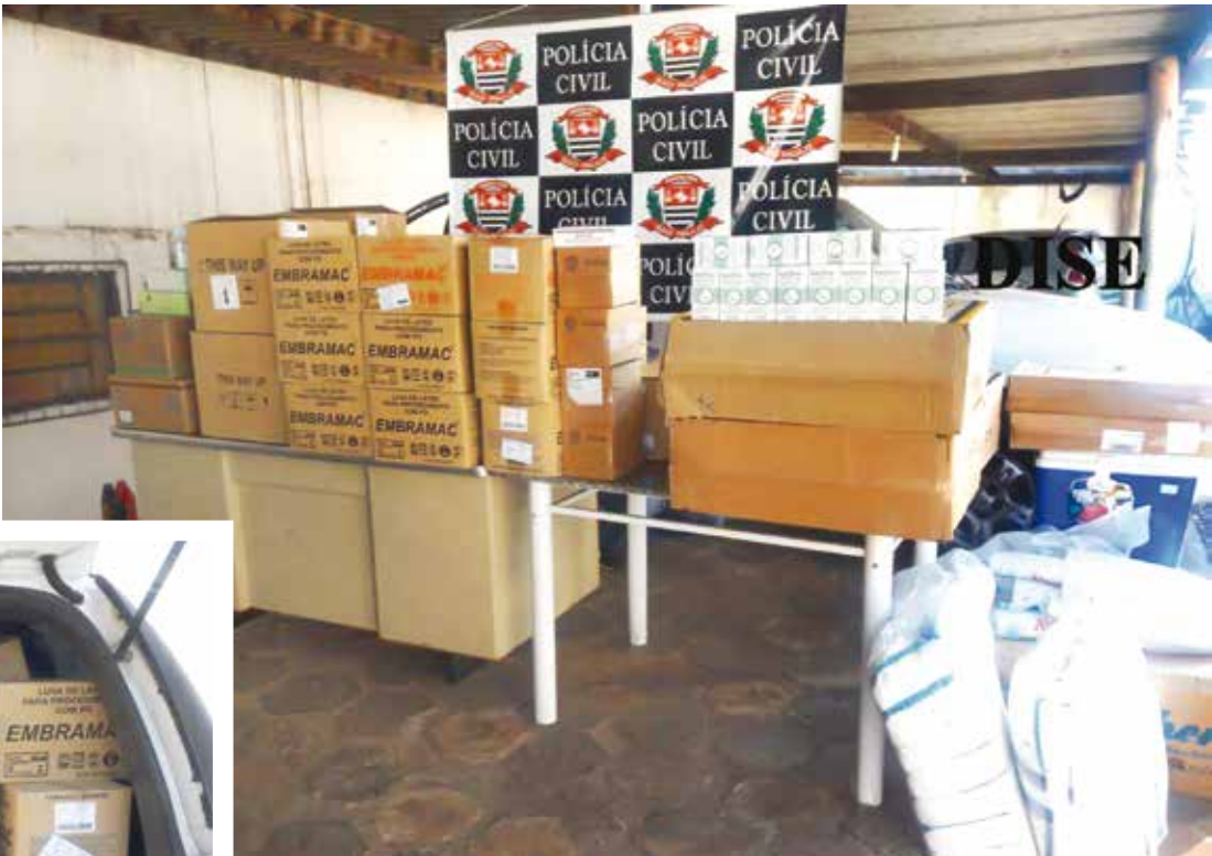
Os materiais apreendidos encheram duas viaturas da Polícia Civil

riamente, enquanto as mulheres foram recolhidas à Cadeia Feminina de Nhandeara. NOTA Em nota, a Prefeitura destacou que acompanha o caso e que está à disposição das autoridades policiais para colaborar com as investigações. A nota diz ainda que a estagiária foi suspensa dos trabalhos no Almoxarifado Municipal até a apuração dos fatos. A Administração Municipal disse que não houve furto de medicamentos, somente materiais utilizados nos serviços de saúde como luvas, curativos, agulhas, gaze e outros. A Prefeitura acredita que os materiais podem ter sido retirados durante mudança do almoxarifado de local. Uma sindicância interna também será aberta para apurar os fatos.