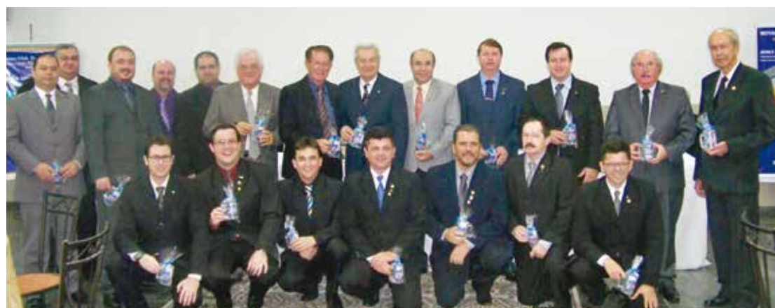
Companheiros do Rotary Club de Fernandópolis

Veja os flashes dos momentos especiais da noite.