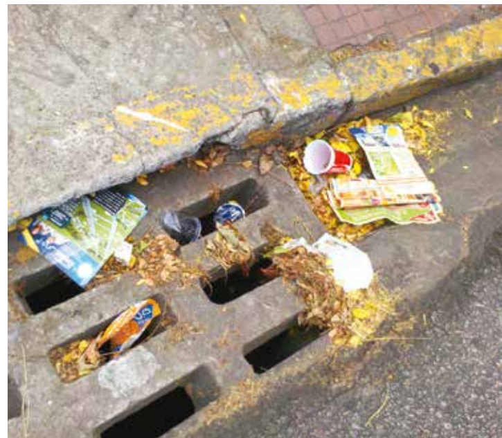
Panfletos são jogados diariamente nas ruas e residências da cidade

Na próxima terça-feira, dia 28, representantes da Prefeitura se reunirão com as empresas que fazem distribuição de panfletos na cidade para orientações sobre as mudanças. Uma autorização já foi emitida pela Secretaria após a publicação do decreto.