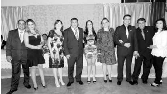
Companheiros do Rotary e damas da Casa da Amizade que tomaram posse como conselheiros do Interact