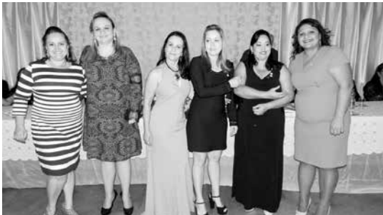
Novo Conselho Diretor da Casa da Amizade para o ano rotário 2016/2017