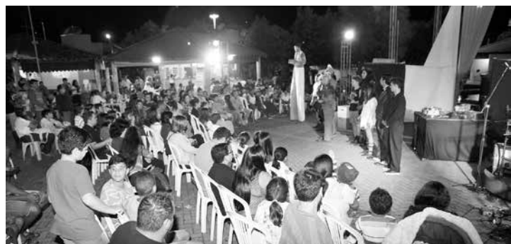
Atração contou a história de Dimbo, um vendedor de pipocas que tinha o sonho de ingressar no circo