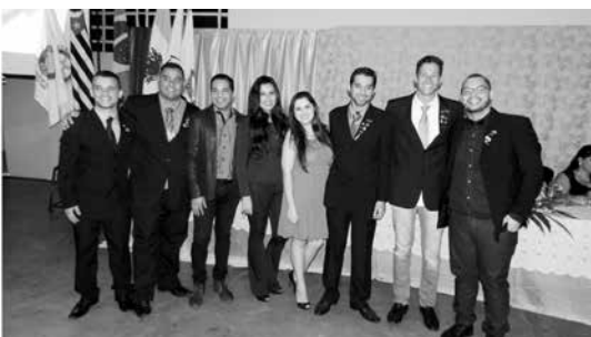
Novos sócios do Rotaract após serem empossados junto aos seus padrinhos