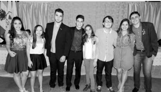
Novos sócios do Interact Club após empossados