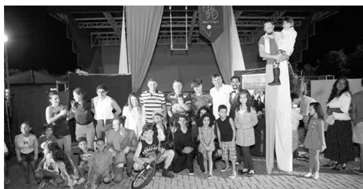
Membros da Secretaria de Cultura do município, junto aos atores que compõe o espetáculo e crianças da cidade