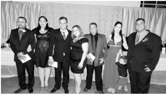
Comp. do Rotary e damas da Casa da Amizade que tomaram posse como conselheiros do Rotaract Club