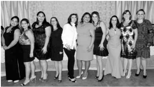
Damas da Casa da Amizade que receberam a homenagem por serem 100% nas realizações do ano rotário 2015/2016