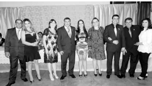
Companheiros do Rotary e damas da Casa da Amizade que tomaram posse como conselheiros do Interact