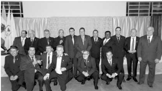
Companheiros do Rotary que foram 100% de frequência durante o ano rotário 2015/2016