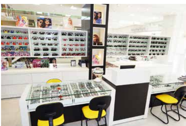
Novo visual, ambiente climatizado e aconchegante garantem pleno conforto aos amigos e clientes que prestigiam a Ótica Cidade Fernandópolis