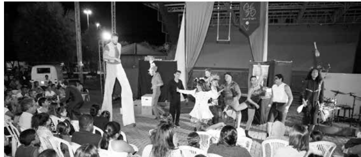
Espectáculo de circo "Uma Arriscada Trama de Picadeiro e Asfalto" aconteceu na Praça de Eventos com entrada gratuita

rativa divertida e envolvente, contando um pouco da história do circo através dos tempos: antiguidade, circo moderno, a chegada do circo no Brasil e o circo contemporâneo, por meio de cenas que mesclaram o teatro, acrobacias e malabarismo, entre outras técnicas que contaram as aventuras da trupe. O Circuito Cultural Paulista é mantido pela Secretaria da Cultura do Estado de São Paulo em parceria com a Prefeitura de Ouroeste, através da Secretaria Municipal de Cultura. A execução é da Associação Paulista dos Amigos da Arte (APPA).