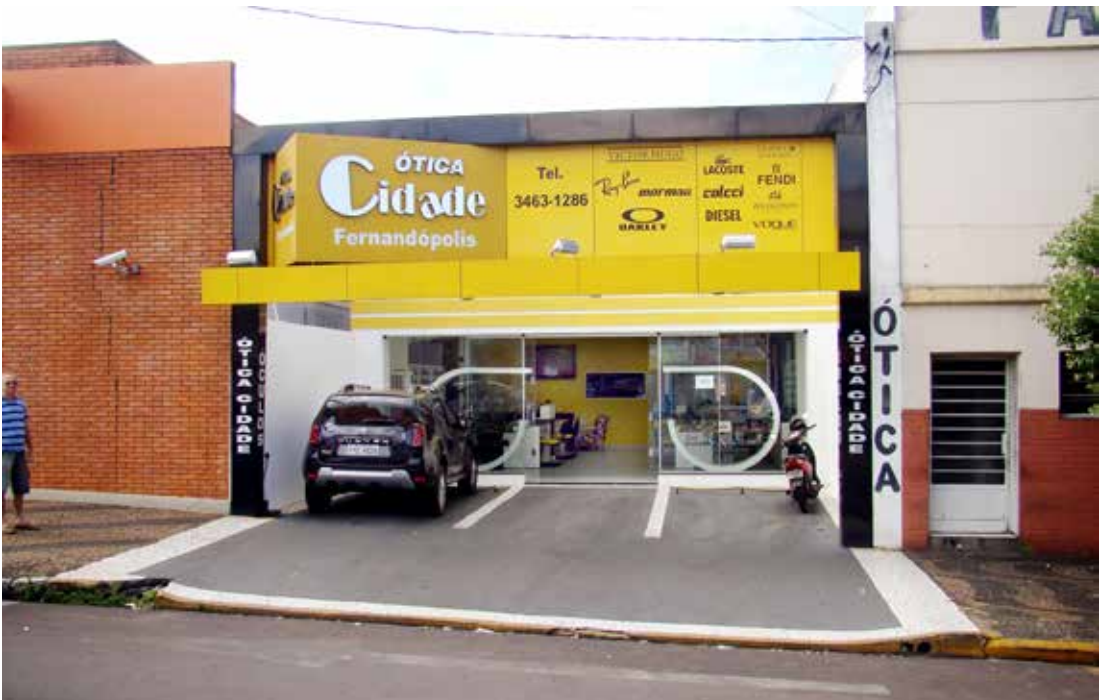
Com estacionamento próprio, a Ótica Cidade Fernandópolis está localizada no Centro, em frente ao Frangão

EXTRA: Um dos maiores diferenciais da Ótica Cidade Fernandópolis é seu laboratório próprio. Como acompanham as novidades do mercado óptico?