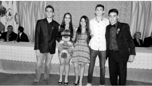
Companheiros do Interact que se comprometeram 100% durante a gestão