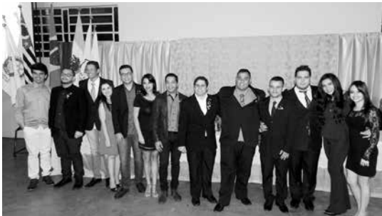
Nova diretoria do Rotaract Club para o ano rotário 2016/2017