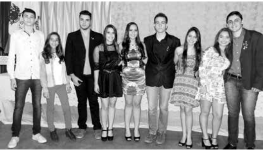
Nova diretoria do Interact Club para o ano rotário 2016/2017