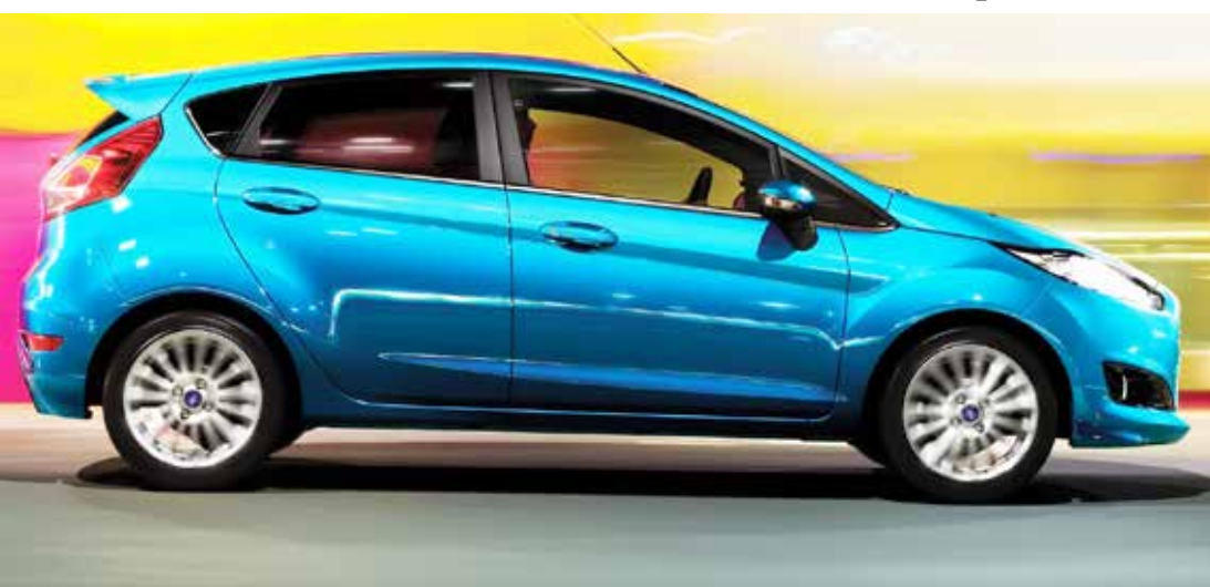
Propulsor Ecoboost turbo de três cilindros rende 125 cv, superando Up! TSI e HB20 turbo

Modelo faz até 15 km/l na rodovia e é o 1.0 mais potente do Brasil, mas preço assusta consumidores: valor de premium usado