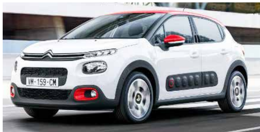
Novo C3 é recheado de tecnologia e traz visual apurado e mais esportivo, disponível em motor tricilíndrico, aspirado ou turbo, com opção de câmbio automático

dependendo da escolha, pode até ser um modelo premium. Fabricado na Romênia, o motor 1.0 é o mesmo que equipa o Fiesta e o Focus na América do Norte. Na Europa, ele aparece em carros maiores, como EcoSport, B-Max, C-Max, e até em vans comerciais como a Transit Courier. No Brasil, até então, os avanços do Ecoboost só estavam disponíveis no alto da gama da Ford.