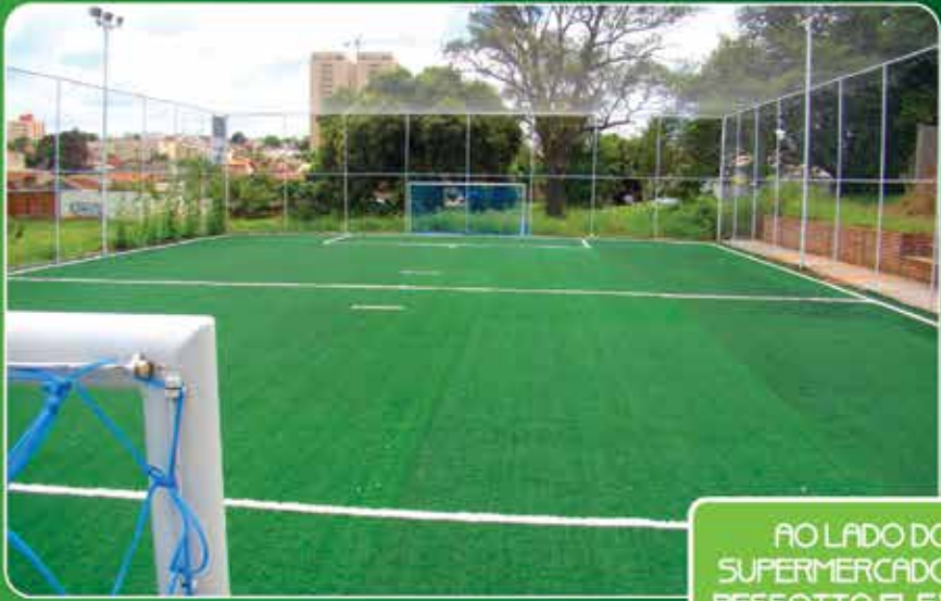
AO LADO DO SUPERMERCADO PESSOTTO FLEX