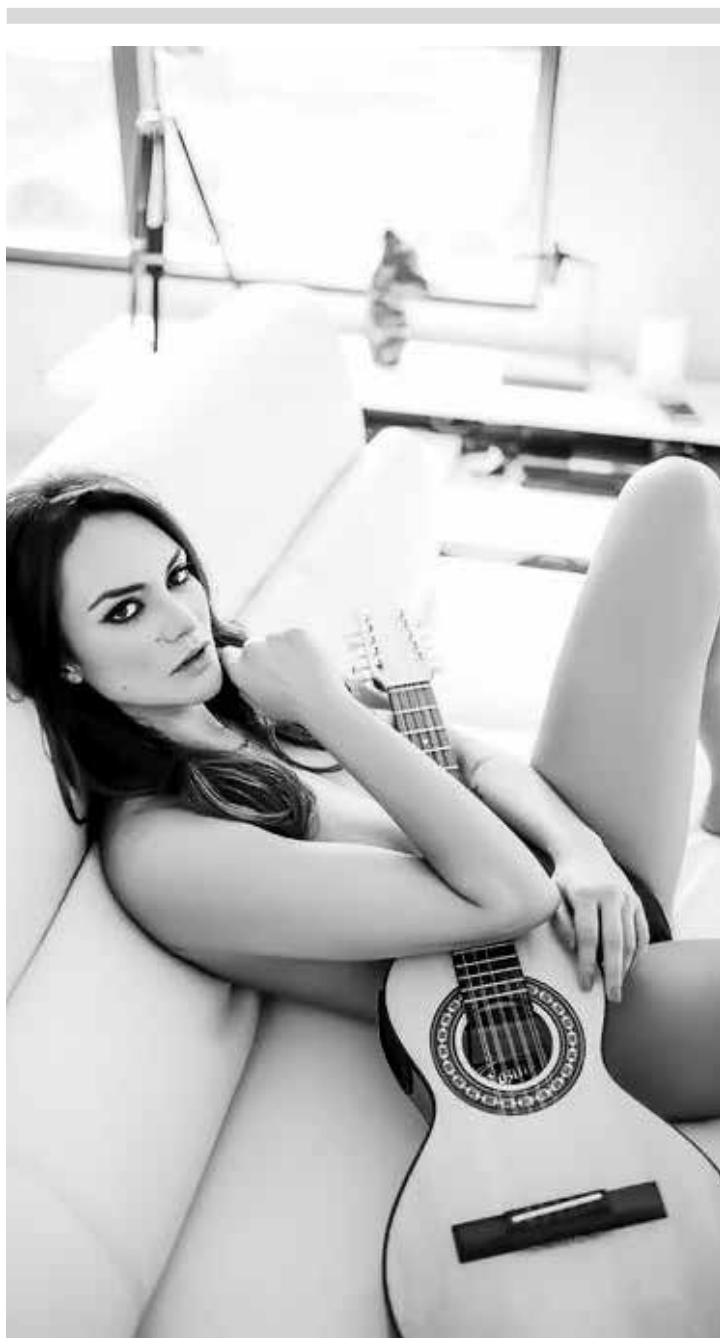
Morena vem se destacando e ganhando elogios por onde passa