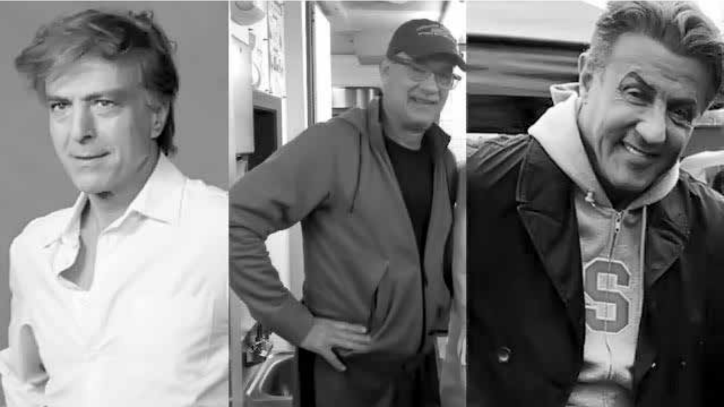
Galãs na terceira idade

Tom Hanks é outro que chega para nos lembrar que, “pois é amigos, estamos ficando velhos”. O bom moço de Hollywood, protagonista de “Quero ser grande”, será um sessentão a partir do próximo sábado, 9.