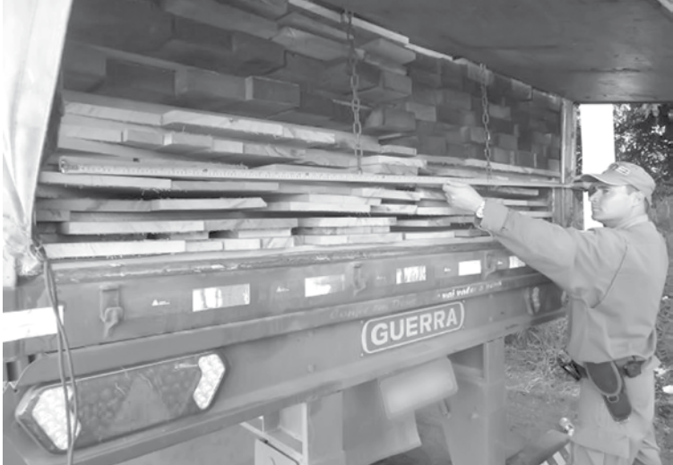
Foram fiscalizados 36 caminhões de transporte de madeiras

Em que pese o número de autuações e apreensões não ter resultado elevado, a Polícia Militar Ambiental destaca que o trabalho preventivo desenvolvido por meios das reiteradas fiscalizações executadas tem sido satisfatório, contribuindo para o efetivo combate dos atos de degradação ambiental.