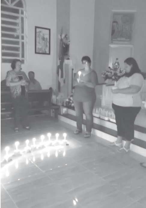
Desenho de um terço em formato de coração feito pelos fiéis