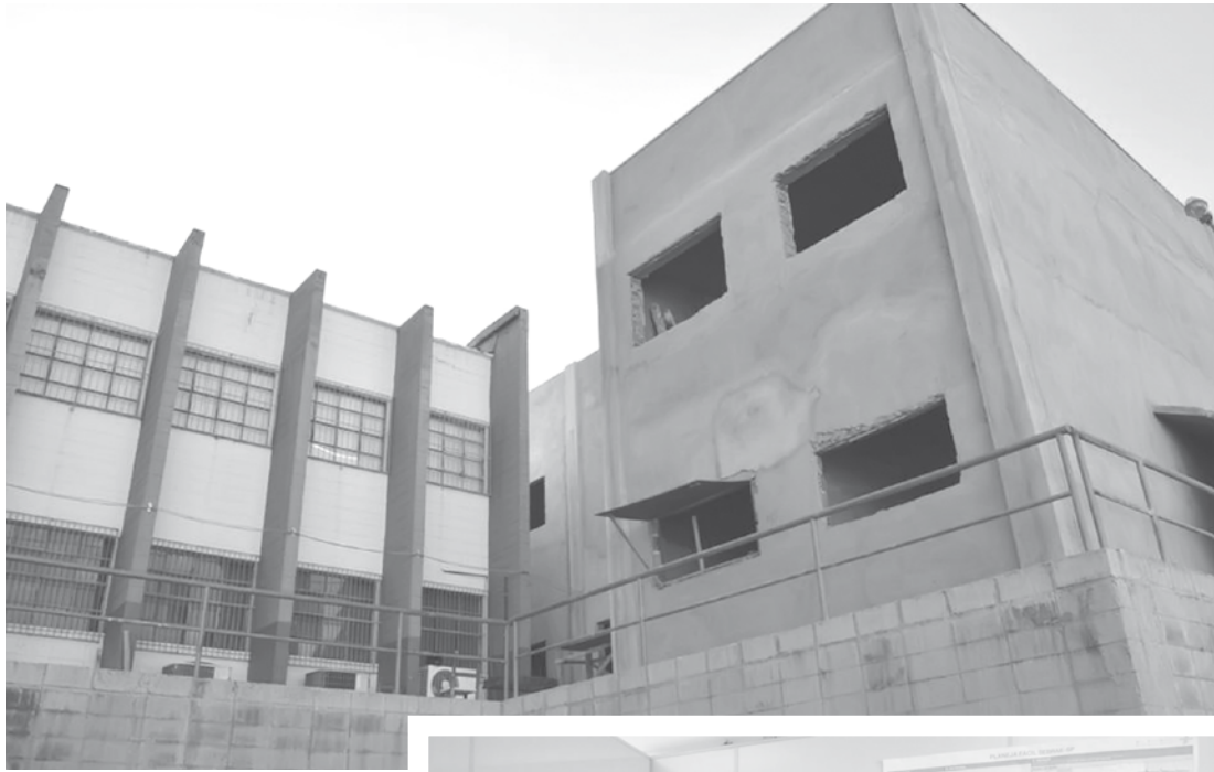
O novo prédio, também dentro do campus da Etec, terá acesso independente ao da escola e poderá receber até 12 empresas