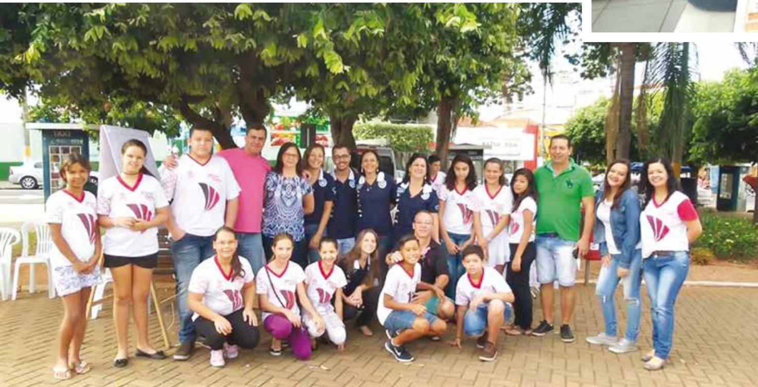
Grupo de voluntários do projeto “Livros Livres”