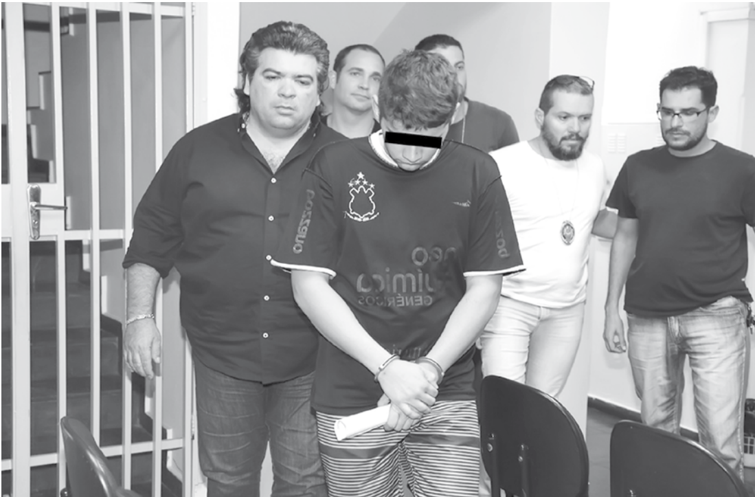
Pai do suspeito disse que o filho é inocente e que apenas teria dado carona aos dois acusados de matar o delegado

→ Da REDAÇÃO contato@oextra.net A Polícia Civil de Rio Preto prendeu na terça-feira (05), mais um envolvido na morte do delegado Guerino Solfa Neto, 43 anos, que pertencia ao Deinter-5. E.F.N., 18 anos, é o terceiro acusado de envolvimento no assassinato do delegado, um dos principais integrantes da equipe de inteligência da Polícia Civil na região. A Polícia apreendeu ainda um Volkswagen Gol, que teria sido usado para dar suporte aos outros dois acusados presos anteriormente: A.S.O.C., 26, e R.C., 28. O delegado José Augusto Fernandes, que está à frente da investigação, pediu prisão temporária de E.F., que já foi concedida pela Justiça.