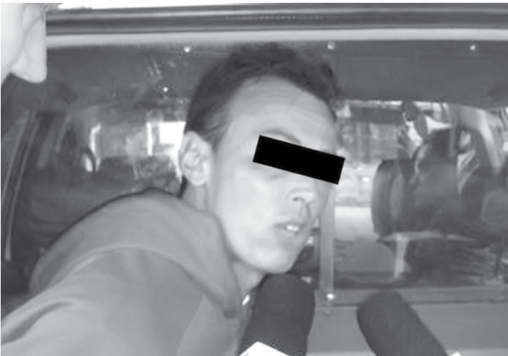
Momento em que o ex-goleiro do América era preso em Rio Reto

A investigação durou nove meses e apurou que o placar era manipulado para beneficiar apostadores asiáticos, que faziam apostas pela in-