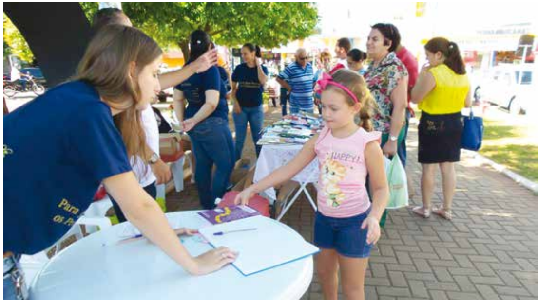
Ação realizada na praça contou com grande público