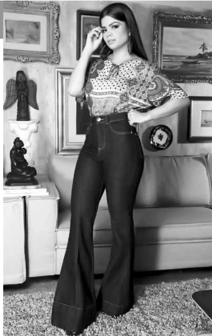
A mulher de Xand do Aviões curte calças flare

O olhar apurado tem rendido a ex-dançarina vários convites para presenças vip pelo Nordeste e ainda a contratação de publiposts.