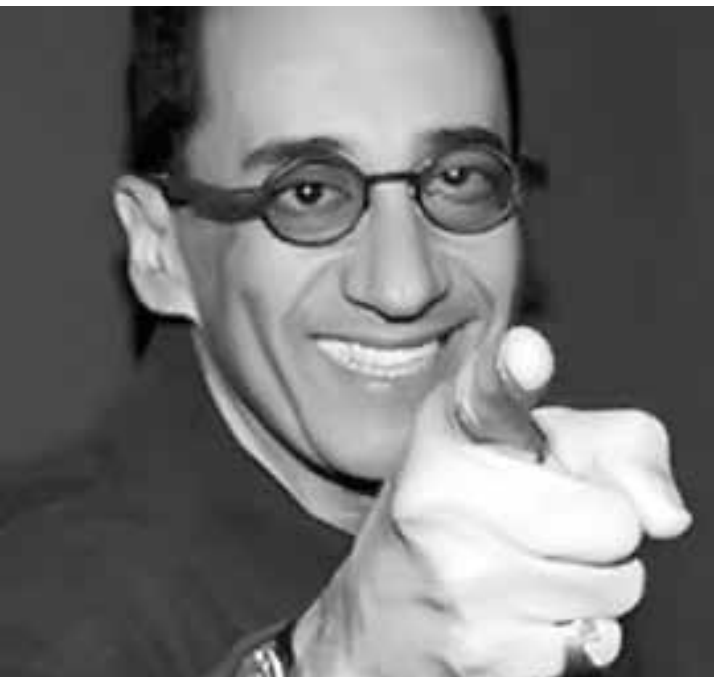
Kajuru fala de perseguições

No último sábado (2), uma mensagem no Twitter do comentarista esportivo Jorge Kajuru preocupou os seguidores. “Sou produtor e redator do Kajuru. Socorro, ele está desaparecido desde as 14hs do sábado”, dizia a nota. Nesta segunda (4), ele reapareceu. “Duro é passar pelo que passei”, escreveu em sua conta na rede social nesta madrugada, sem explicar o que ocasionou o sumiço. O motivo, segundo relatou o jornalista em entrevista, seriam avisos transmitidos por amigos de que ele corria perigo. “Quero que apurem quem está atrás de mim”, afirmou.