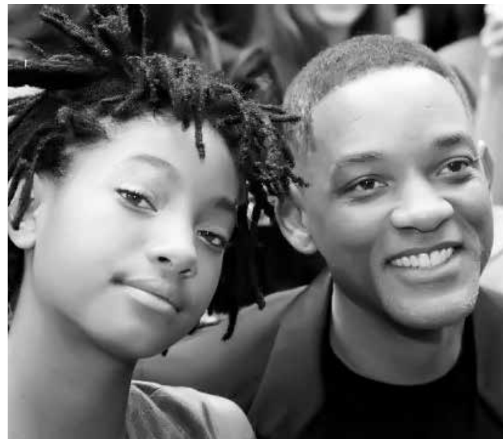
Will Smith com a filha Willow Smith

públicas 2013, e seu primeiro encontro com Karl Lagerfeld, diretor criativo da Chanel, foi em 2014, quando ele a fotografou para a revista americana V. Quando foi anunciado que ela seria um dos rostos da marca, Lagerfeld disse que a escolheu por sua “juventude e energia”. A Chanel acredita que Willow encarna o espírito de sua geração.