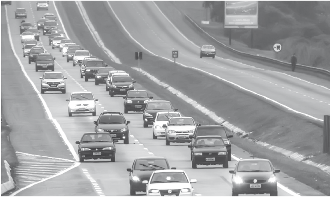
O motorista que desrespeitar essas regras poderá ser multado em R$ 85,13 e receber quatro pontos na habilitação, pois é infração média

FORMA CORRETA: • Luz baixa (farol baixo) - É a luz destinada a iluminar a via diante do veículo sem causar incômodo aos motoristas que trafegam em sentido contrário. É permitido conduzir com a luz baixa acionada durante todo o dia, o que torna o veículo mais visível. A partir do dia 8 de julho de 2016, o motorista deverá utilizar o farol baixo em rodovias mesmo durante o dia. Além disso, permanece obrigatório manter a luz baixa acesa durante a noite; e nos túneis com iluminação pública, em qualquer horário. • Luz alta (farol alto) - Tem o objetivo de iluminar a via até uma grande distância do veículo. Só deve ser utilizada em vias não iluminadas. Em túneis sem iluminação também deve-se usar a luz alta. Precisa ser desligada quando um veículo em sentido contrário estiver se aproximando ou quando ficar atrás de um veículo trafegando no mesmo sentido. Nessas situações, o motorista precisa trocar momentaneamente a luz alta pela baixa.