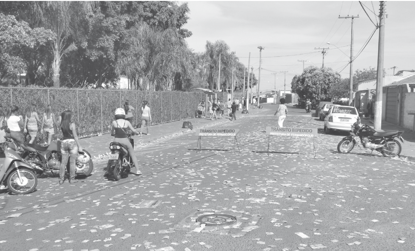
A obrigatoriedade do voto no Brasil vem desde 1932, com a edição do Código Eleitoral daquele ano, sendo reiterada pela Constituição Federal de 1988

Voto é obrigatório para os cidadãos brasileiros alfabetizados maiores de 18 e menores de 70 anos e facultativo para quem tem 16 e 17 anos e para os maiores de 70 anos