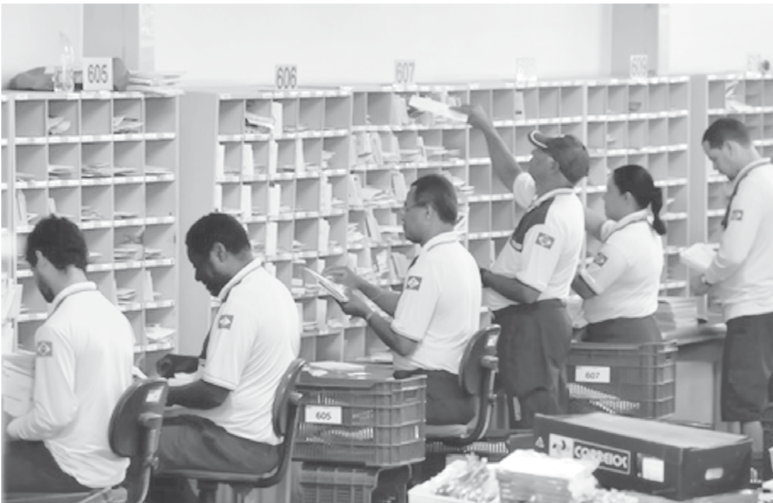
O Postalís é o instituto de previdência complementar dos servidores dos Correios