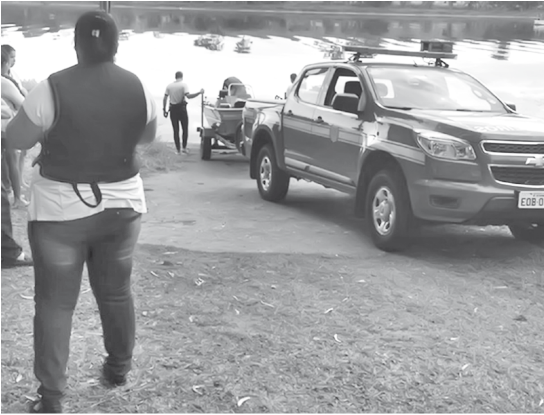
Bombeiros encontraram barco à deriva no rio

Fé do Sul encontraram na terça-feira (05) o corpo do idoso que estava desaparecido desde o final de semana no rio Paraná. O corpo foi encontrado boiando em um braço do rio conhecido como Taiacu, no distrito de Esmeralda, município de Rubineia. O corpo foi encontrado a dois quilômetros de onde foi achado o barco dele. A equipe dos bombeiros começou as buscas na se-