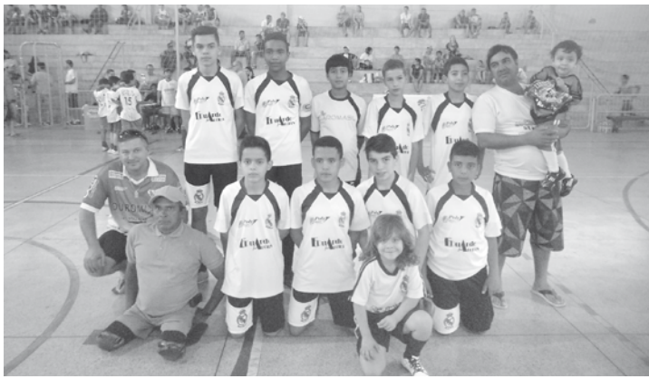
A grande final foi abrilhantada pela apresentação dos atletas mirins que integram a categoria 5/6 anos