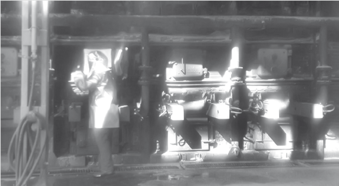
Drogas que foram incineradas reuniam maconha, crack e cocaína

As drogas estavam armazenadas na sede da Delegacia desde as apreensões até que a Justiça autorizasse a incineração do material, segundo a Polícia Civil.