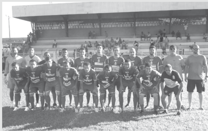
Mistura de Rio Preto e A.A. Pontalindense, equipes classificadas às quartas de final da competição

O evento esportivo é uma realização da Secretaria Municipal de Esporte de Pedranópolis, com apoio da Secretaria de Esporte, Lazer e Juventude do Estado de São Paulo e Câmara Municipal.