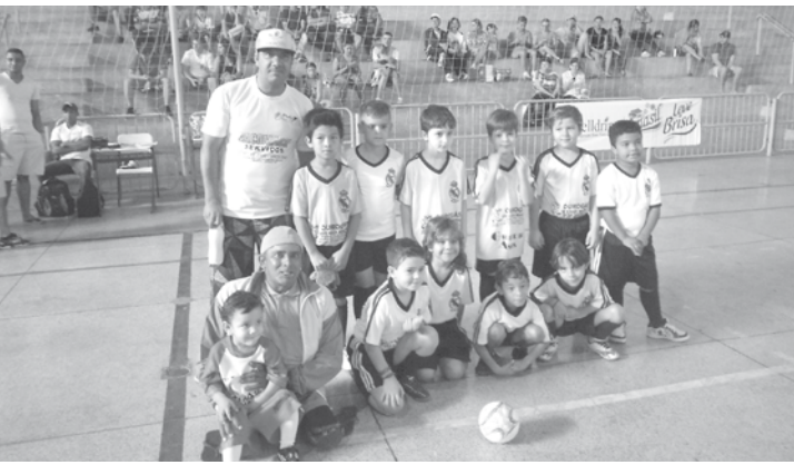
Futuros craques de Ouroeste que conquistaram o título de vice-campeão junto ao seu treinador “Bagi”

der pelo placar de 7 a 5 para Jales. A grande final foi abrilhantada pela apresentação da categoria 5/6 anos de idade. A organização da Copinha entregou para as equipes vencedoras troféus e medalhas.