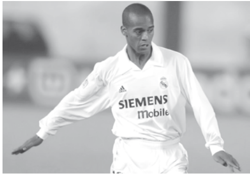
Flávio Conceição jogando pelo Real Madrid