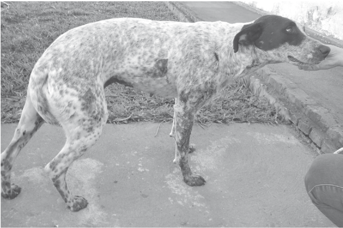
Animal sendo cuidado na clínica veterinária

A polícia foi acionada para elaborar o Boletim de Ocorrência, mas o autor do crime não foi localizado.