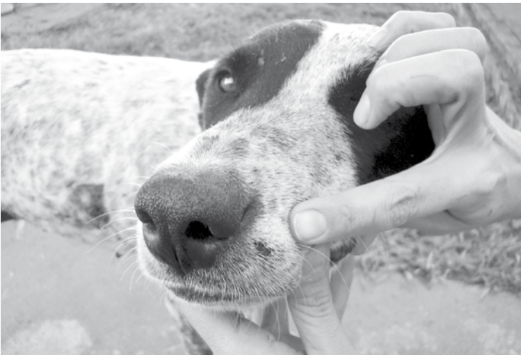
Diversos tiros de chumbinhos atingiram a cachorra que ficou com o corpo todo furado

De acordo com a diretoria da Pelos e Pelas, muitos têm sido os casos de abandono e