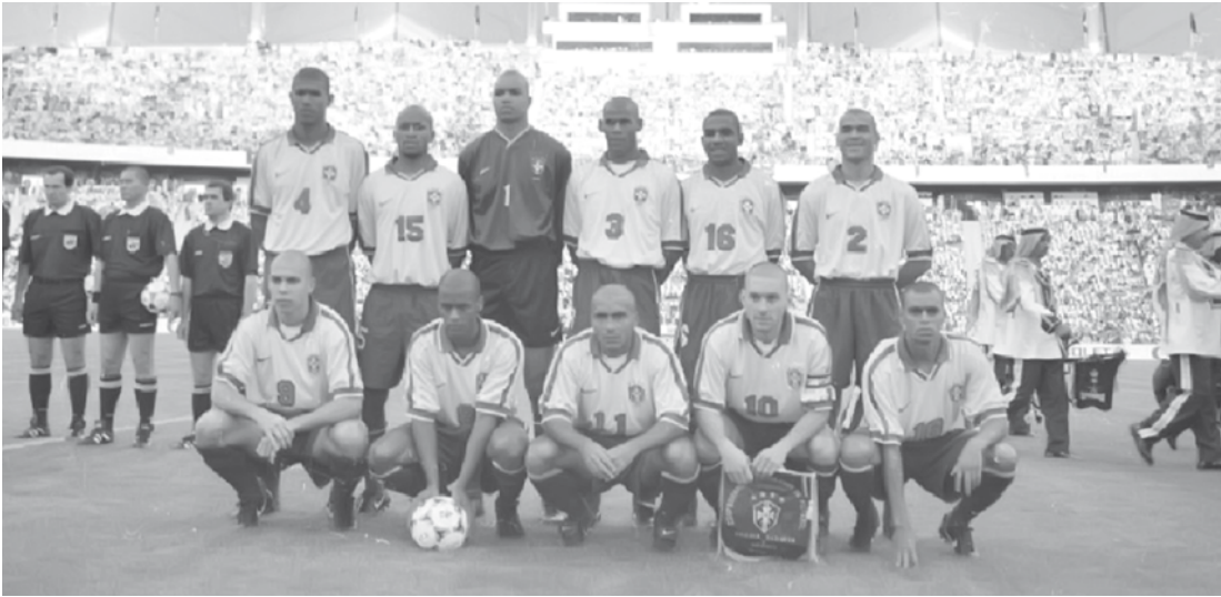
Seleção Brasileira histórica: Júnior Baiano, Zé Roberto, Dida, Aldair, César Sampaio e Cafu; Ronaldo Fenômeno, Flávio Conceição, Romário, Leonardo e Denilson