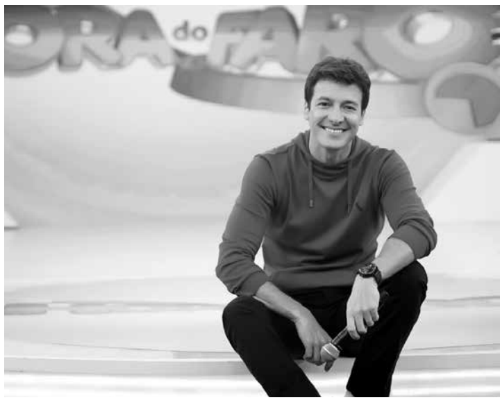
Faro: realizando sonho de fã