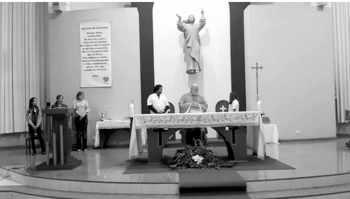
Celebração de agradecimento e adoração a Deus