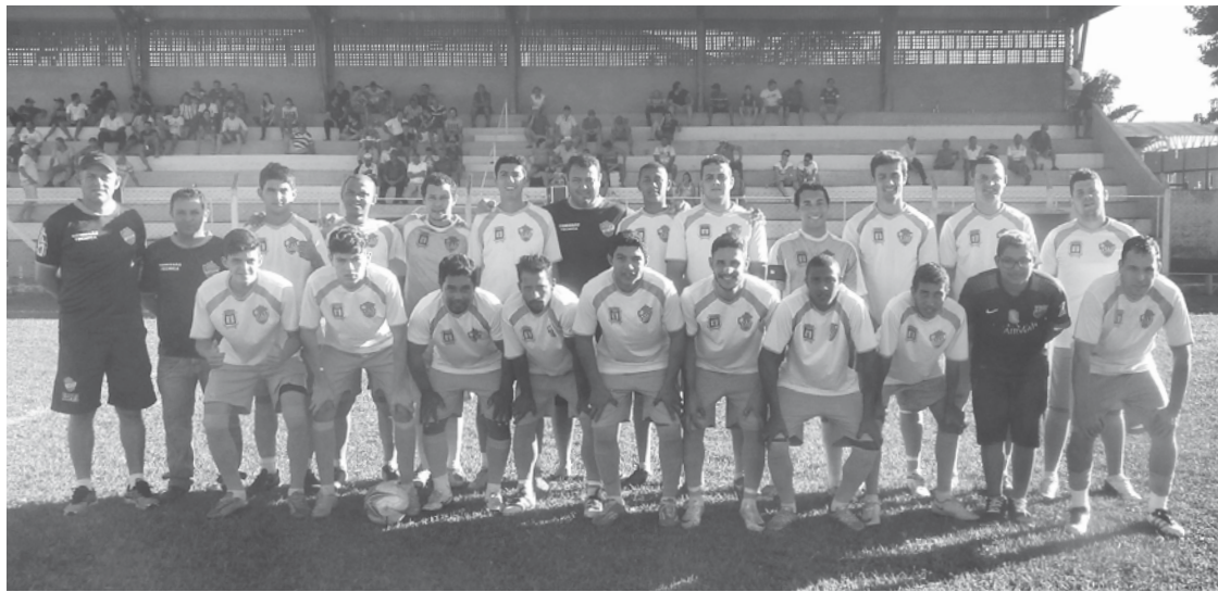
Copa, que movimentou o futebol amador aos domingos, entra na reta final