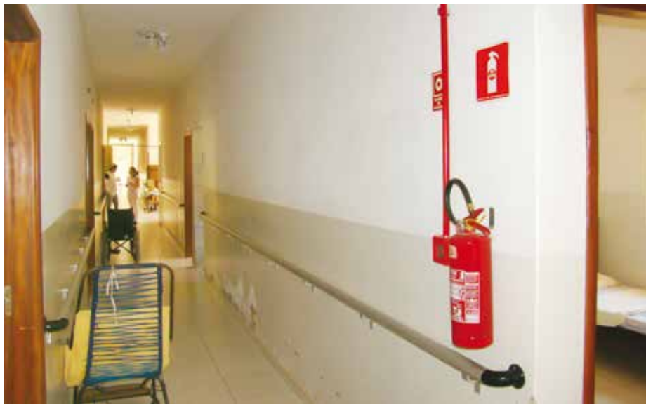
Com as readequações, entidade agora possui rede de prevenção contra incêndio