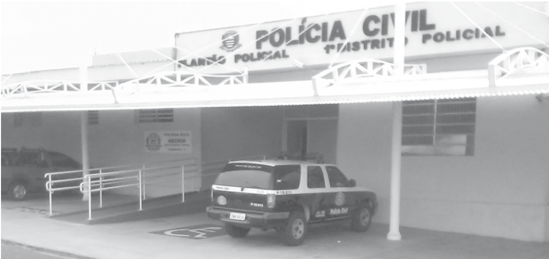
Acusada de tráfico, aposentada passou mal durante o registro da ocorrência no Plantão Policial