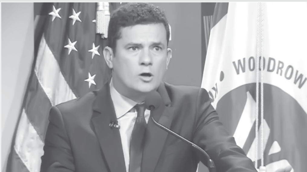
imagem da semana

“Para ser justo, o governo atual disse em várias ocasiões que apoia e endossa as investigações mas os brasileiros devem esperar mais do que apoio verbal”, disse o juiz da Lava Jato, Sérgio Moro, em palestra na quinta-feira, em Washington, nos EUA, mirando o governo federal e os congressistas, e acusando-os de omissão no combate à corrupção.