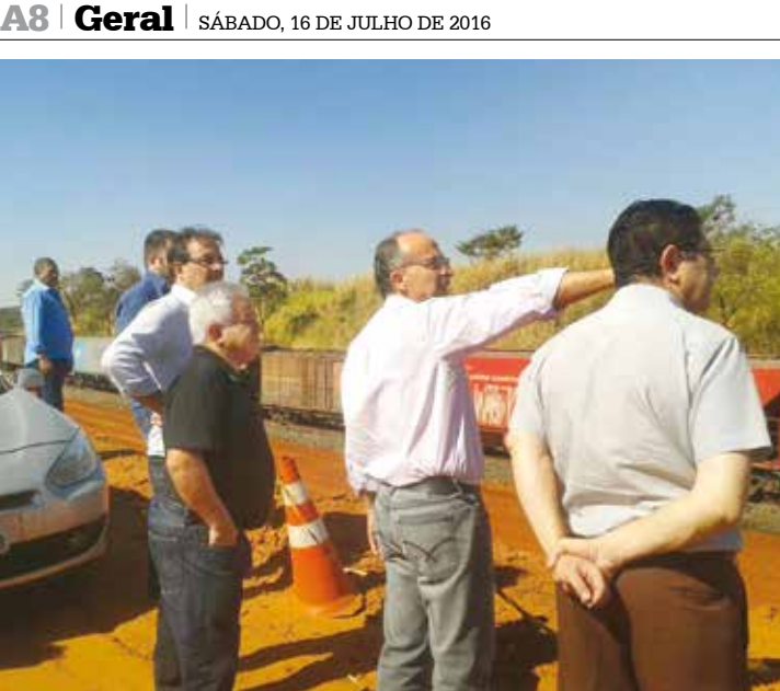
Dirigentes conheceram a área da ZPE e o pátio de conexão da Ferrovia Norte-Sul com a ALL