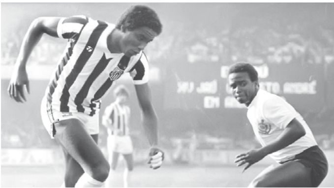
Serginho Chulapa integrava a Seleção Brasileira de 82, é o maior artilheiro da história do São Paulo e ídolo eterno do Santos Futebol Clube; o ex-centroavante retornará à cidade no próximo sábado