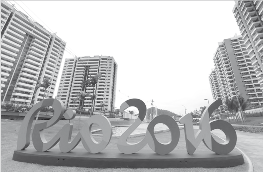
Vila Olímpica terá estrutura específica para atender atletas que queiram denunciar abusos ou assédio

O COI destaca que será a primeira vez que a iniciativa