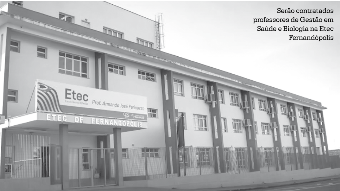
Serão contratados professores de Gestão em Saúde e Biologia na Etec Fernandópolis

ses – contados a partir de junho de 2015, do prazo para que sejam iniciadas as obras. Com isso, a empresa que vencer a concorrência terá cerca de dois anos para executar ao menos 10% do projeto.