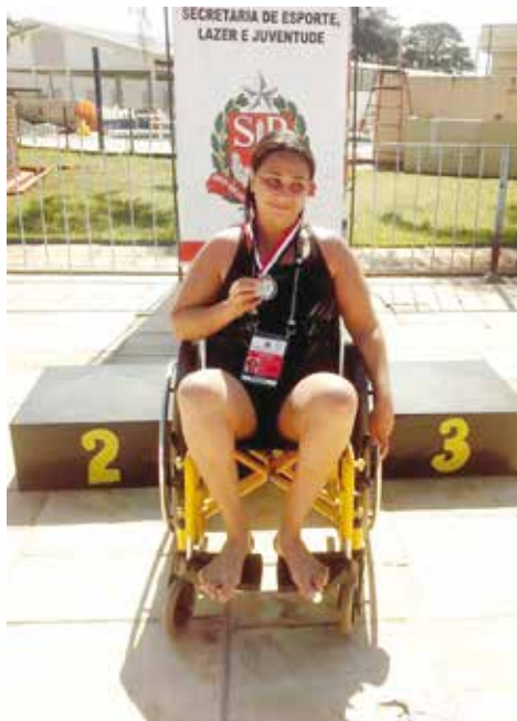
Atletas fernandopolenses em destaque na competição

→ Da REDAÇÃO contato@oextra.net A Secretaria Municipal de Esportes, Lazer e Cultura divulgou os resultados do primeiro dia de competições, ontem (21), da delegação de Fernandópolis nos Jogos Regionais, realizados na cidade de Araçatuba. O evento é organizado pela Secretaria de Esporte, Lazer e Juventude do Estado de São Paulo (SELJ).