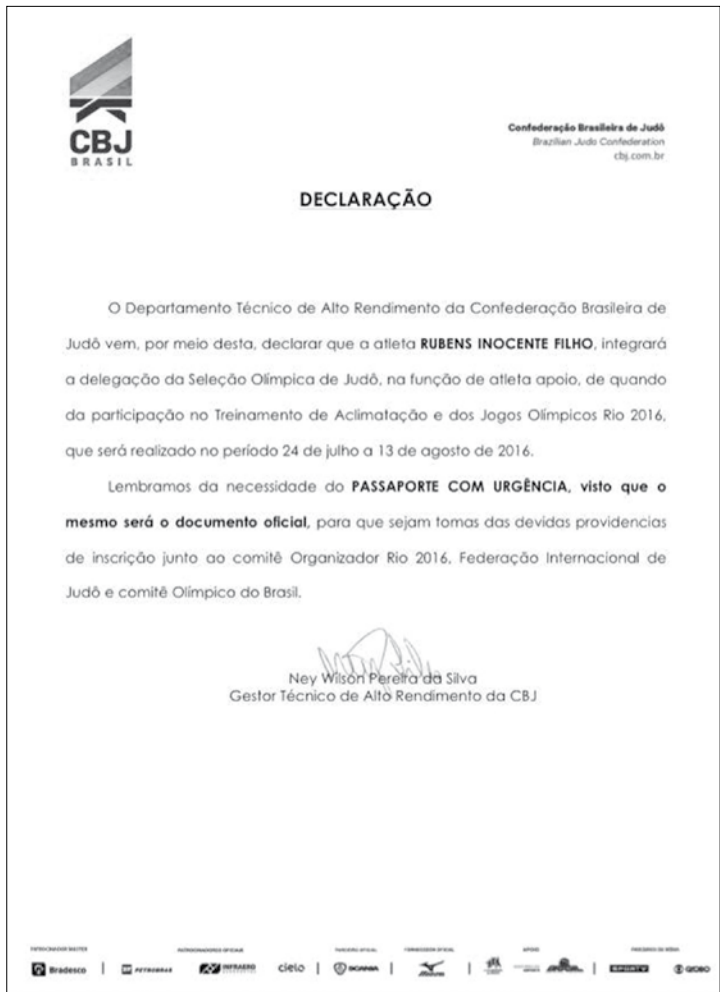
Declaração de convocação enviada a Rubinho