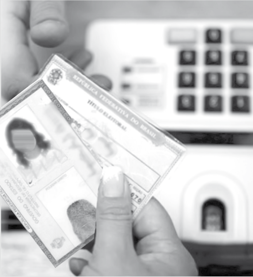
Mulheres são a maioria do eleitorado (52,21%)

apenas 122 pessoas fizeram registro – para a eleição municipal deste ano. O prazo para registro de candidaturas termina no dia 15 de agosto, e o Tribunal acredita que o to-