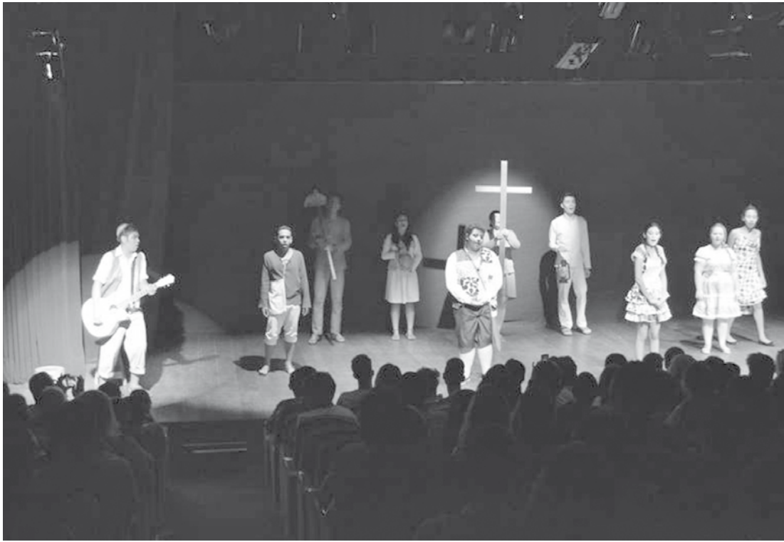
Imagem de arquivo de edições anteriores da Mostra Estudantil de Teatro realizada em Fernandópolis

Os interessados em participar da XXII Mostra Estudantil de Teatro de Fernandópolis, têm até a próxima sexta-feira, dia 29, para realizar a inscrição. A ficha e o regulamento encontram-se disponíveis no site da Prefeitura no endereço - www.fernandopolis.sp.gov.br . Para baixar os documentos, basta ir até a barra superior e clicar no ícone “arquivos para download”. Poderão inscrever grupos de teatro formados dentro das escolas e a direção dos espetáculos deve vir assinada por um professor ou aluno que tenha acompanhado todo processo de montagem. O grupo deverá ter 80% dos atores matriculados em escolas da rede municipal, pública ou particular, podendo receber ajuda (direção, iluminação, sonoplastia, figurino e maquiagem) de pessoas da comunidade que não tenham vínculo com