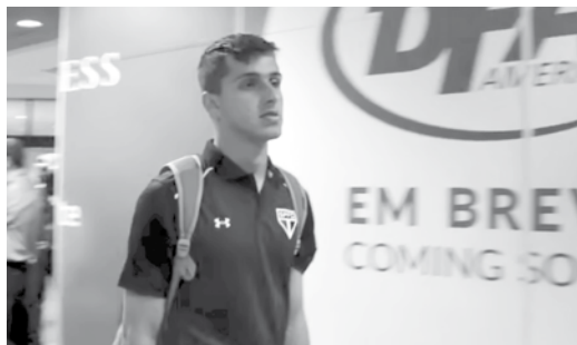
No aeroporto, em Porto Alegre, jogador aparece apreensivo com assédio dos torcedores aos medalhões da equipe