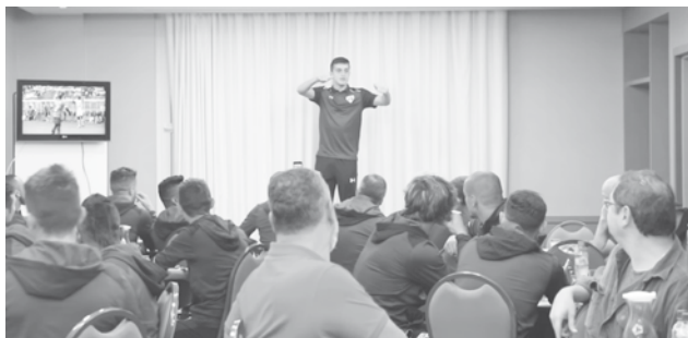
Jogador não passou ileso do tradicional batismo, pelo qual os novatos são submetidos pelos demais companheiros