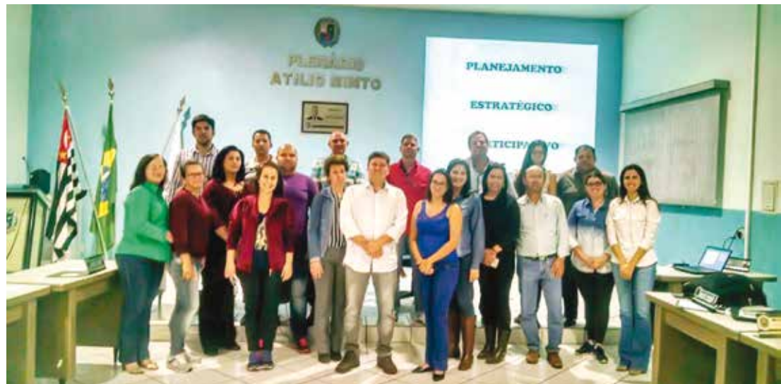
Objetivo do encontro foi apresentar os potenciais turísticos e reunir sugestões dos munícipes