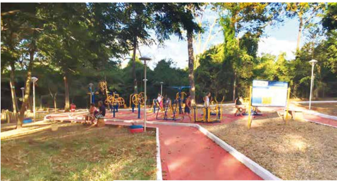
Local foi todo remodelado para receber visitantes

O Horto Florestal conta ainda com alguns moradores, os macacos-prego, que estão por lá há vários anos. A Secretaria Municipal de Agricultura, Pecuária, Abastecimento e Meio Ambiente, orienta que estes animais não devem ser alimentados pelos visitantes. Macacos-prego estão entre os animais mais intelligen-