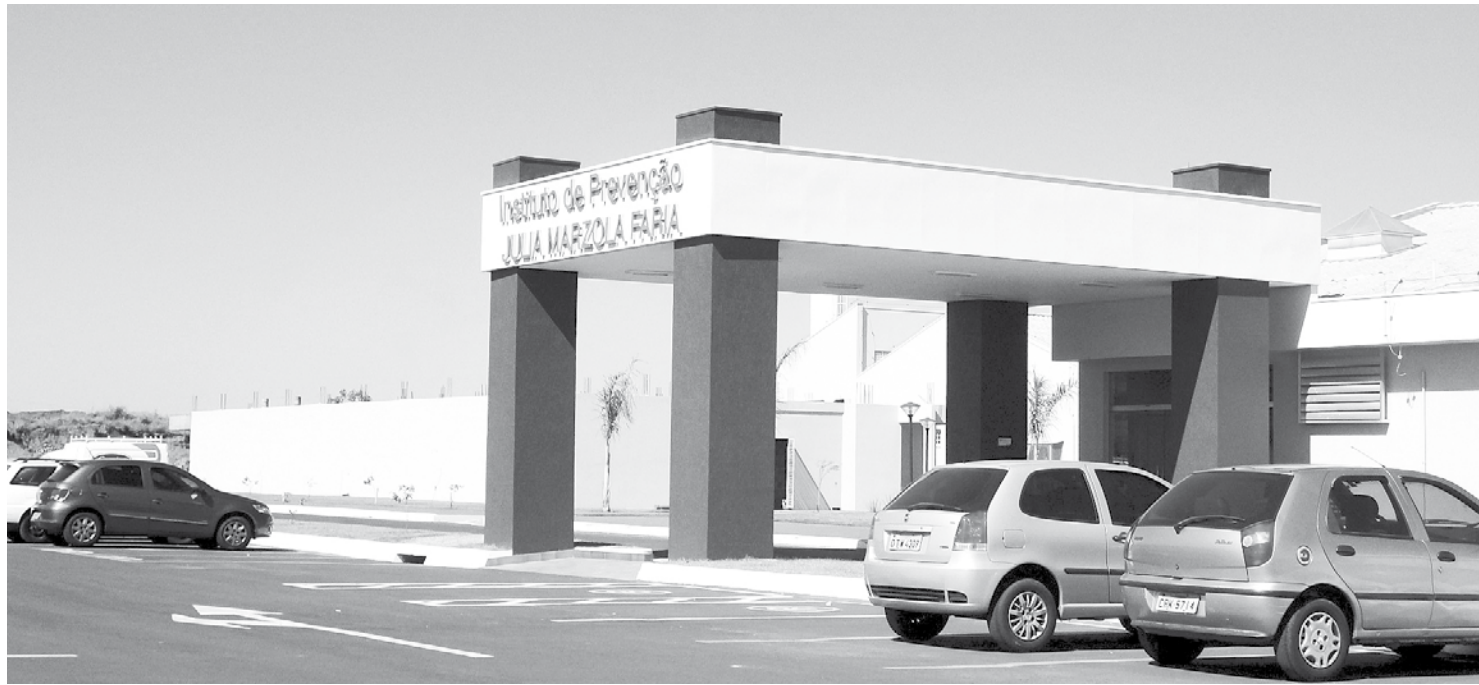
Vista de uma das alas da unidade do Hospital do Câncer de Fernandópolis

Através de sua Assessoria de Comunicação, o Ministério Público Federal de Jales informou que foi instaurado um inquérito civil para investigar possíveis irregularidades no credenciamento junto ao Sistema Único de Saúde dos centros de tratamento contra o câncer de Fernandópolis e Jales. A demora no cadastro tem causado enormes dificuldades financeiras às unidades médicas ligadas ao Hospital do Câncer de Barretos, referência nacional em oncologia, gerando, inclusive, impacto negativo no número de pacientes atendidos na região. Sem a formalização do vínculo com o SUS, os hospitais não podem receber verbas públicas e continuam dependendo exclusivamente de doações e iniciativas para arrecadação de fundos. O problema levou o Hospital do Câncer de Barretos a cogitar o