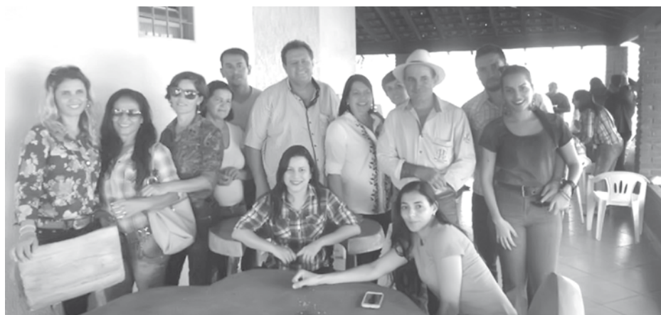
Todos saborearam delicioso almoço com comidas típicas da zona rural