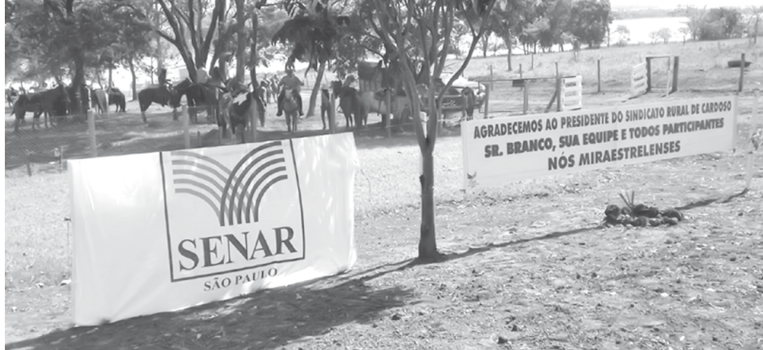
Cavalgada percorreu 10 Km e reuniu grande número de participantes