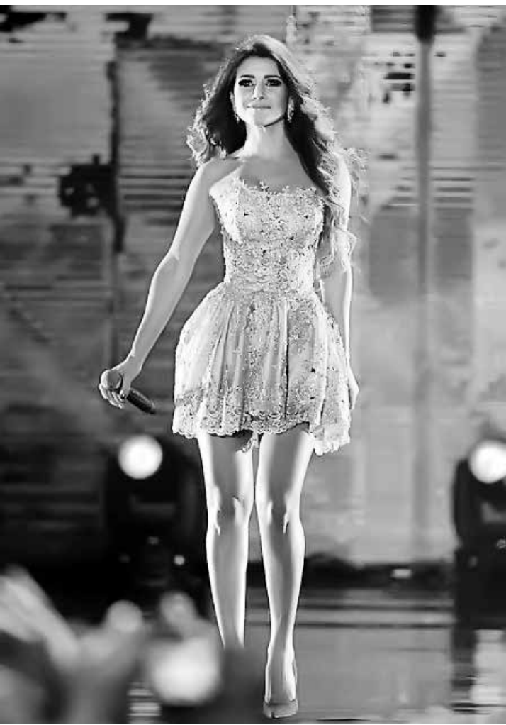
Paula Fernandes: menos shows

As coisas não vão bem para Paula Fernandes. A cantora, que já foi um fenômeno da música sertaneja, não faz mais tantos shows como no passado. Para se ter ideia, Paula tem entre os dias 30 deste mês e 18 de setembro apenas nove apresentações marcadas. Uma delas numa exposição agropecuária no interior de Goiás cujo valor do in-