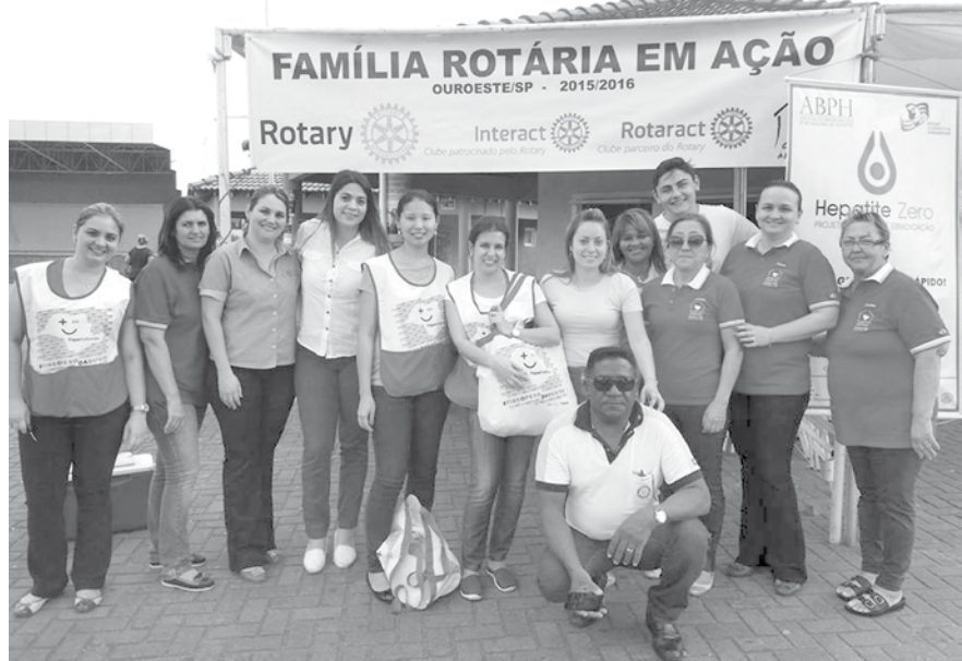
Senhoras da Casa da Amizade de Ouroeste junto às profissionais da Saúde na Praça de Eventos onde aconteceu a importante campanha