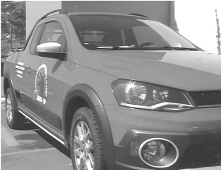
Picape foi concedida pela Justiça, depois de ser apreendida com drogas