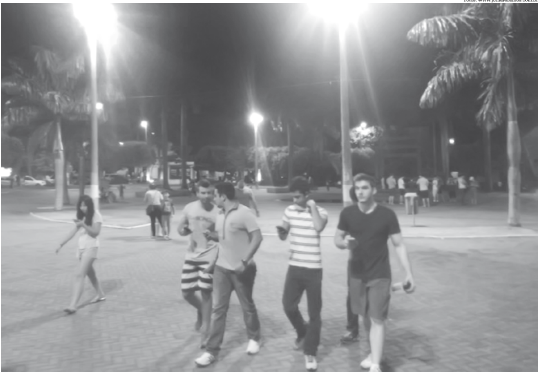
Praça da Matriz tem sido o melhor local de Fernandópolis para capturar Pokémons

A Polícia Militar orienta a população para evitar que usuários do jogo sejam vítimas de assaltos, furtos e outros crimes enquanto es-