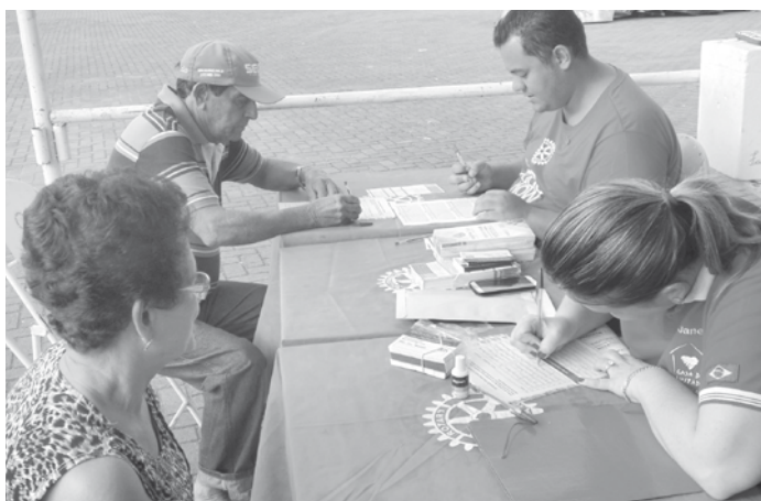
Durante a campanha foram realizados cadastros com esclarecimentos para coleta de exames