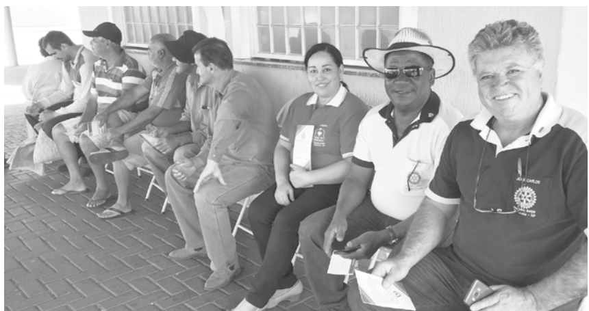
Centenas de pessoas realizaram os testes, que além de rápidos foram gratuitos

→ Da REDAÇÃO contato@oextra.net O Rotary Internacional, dentre várias e importantíssimas campanhas, tem, através de todos os Rotary clubs, investido para a erradicação da poliomielite, com a Pólio Plus. A “Hepatite Zero” é a sua atual campanha, para a erradicação, com a mobilização mundial, através da ABPH – Associação Brasileira dos Portadores de Hepatite, que provê toda a assistência, de forma gratuita, às pessoas diagnosticadas. A Hepatite é uma epidemia crescente, atingindo mais de 500 milhões de pessoas infectadas pelo vírus. Uma doença silenciosa, que pode ser classificada em A, B, C, D e E, sendo que os tipos B e C são as mais perigosas. A Hepatite C é transmitida principalmente por via sanguínea e é a grande preocupação do Rotary Internacional, atuando