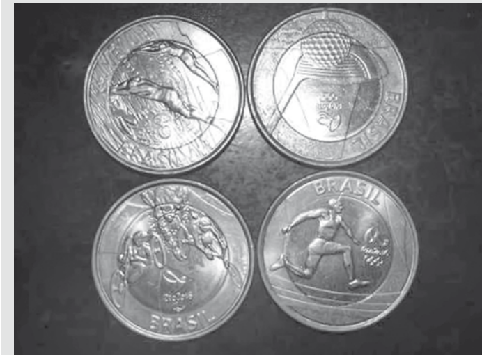
São 16 moedas de um real, cada uma delas prestando homenagem a um tipo de esporte a ser disputado nos Jogos Olímpicos e Paraolímpicos que começaram em agosto no Rio de Janeiro

Caso foi registrado no Plantão Policial e a Polícia Civil investiga para tentar identificar o autor do furto