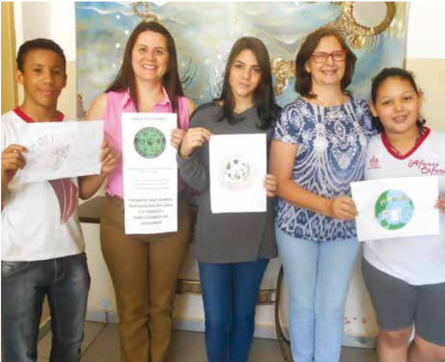
Ganhadores do concurso e o logo final, junto à Comissão Central

Nos meses de março e abril, aconteceram as inscrições. Ao todo, foram 22 escolas inscritas, sendo 13 estaduais, 5 municipais, 3 privadas e 1 técnica, totalizando 64 projetos a serem apresentados na Mostra. A princípio, a Mostra Científica visa oportunizar às escolas a apresentação dos projetos desenvolvidos na prática cotidiana que, muitas vezes, ocultam-se entre as paredes da instituição escolar, sem a perspectiva de serem inseridos em feiras ou eventos estaduais e nacionais. A Feira Científica, ainda, objetiva fomentar as unidades escolares à introdução da pesquisa científica oportunizando assim, socializar e valorizar essas produções, resgatando a motivação não só dos discentes, como também de docentes, rumo ao desenvolvimento de cientis-