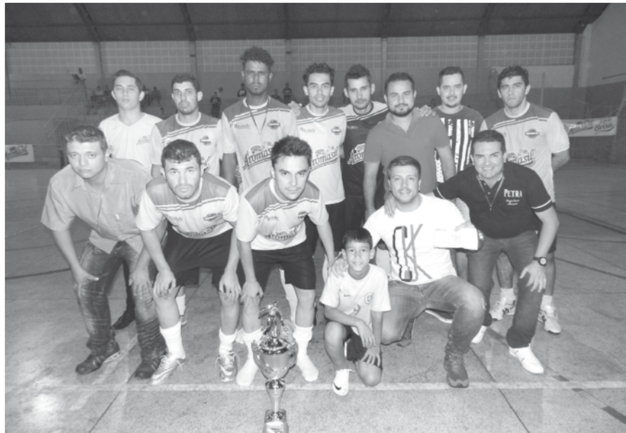
Jogadores que defenderam a equipe Aromasil Futsal e sagraram-se vice-campeões