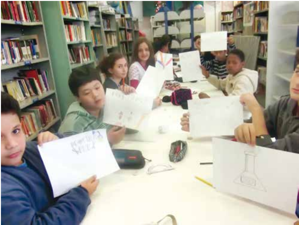
Alunos participando do concurso do logotipo da MOSTRAFER