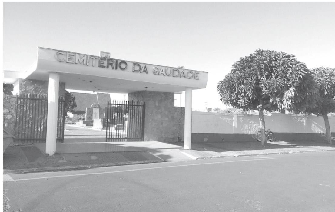
O Projeto foi votado em caráter de urgência devido ao pouco espaço restante no Cemitério da Saudade