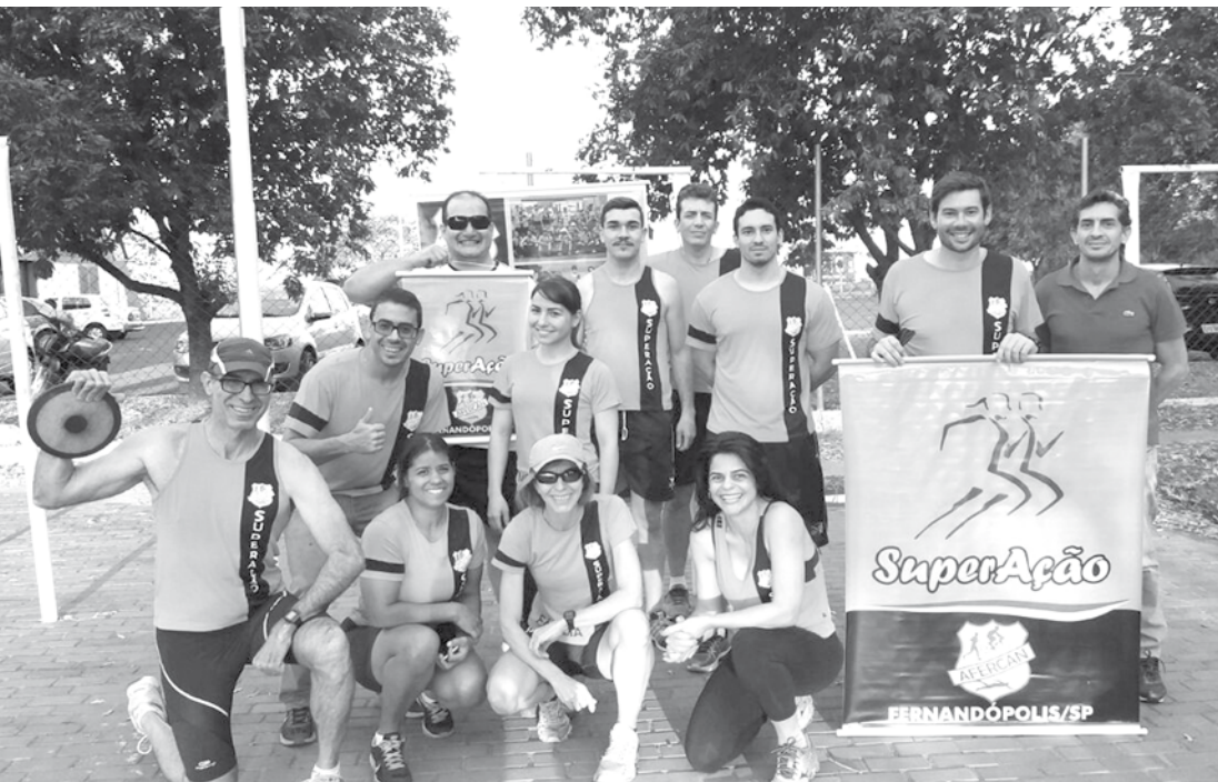
Equipe Afercan satisfeita com os resultados obtidos em Araçatuba nos Jogos Regionais de 2016

Associação totalizou 23 medalhas de ouro e 6 de prata