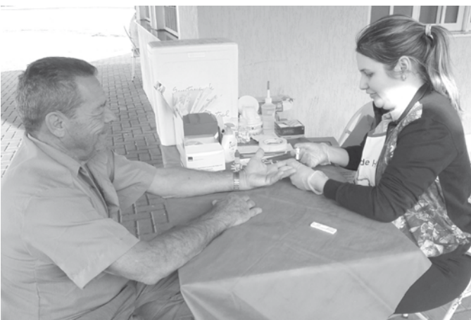
O Rotary Club de Ouroeste recebeu da ABPH, 600 kits e com o apoio da Secretaria da Saúde promoveu a campanha