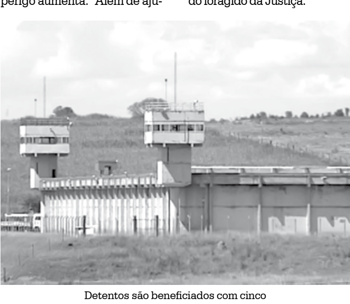
Detentos são beneficiados com cinco saídas temporárias durante o ano

O benefício é permitido para presos que apresentam bom comportamento, já cumpriram uma parte da pena e estão no regime semiaberto. São cinco saídas ao ano. Pela legislação, enquanto estiverem soltos os detentos não podem frequentar locais de reputação duvidosa e estão proibidos de permanecer na rua após às 22h. O detento que não retornar, é considerado foragido da Justiça.