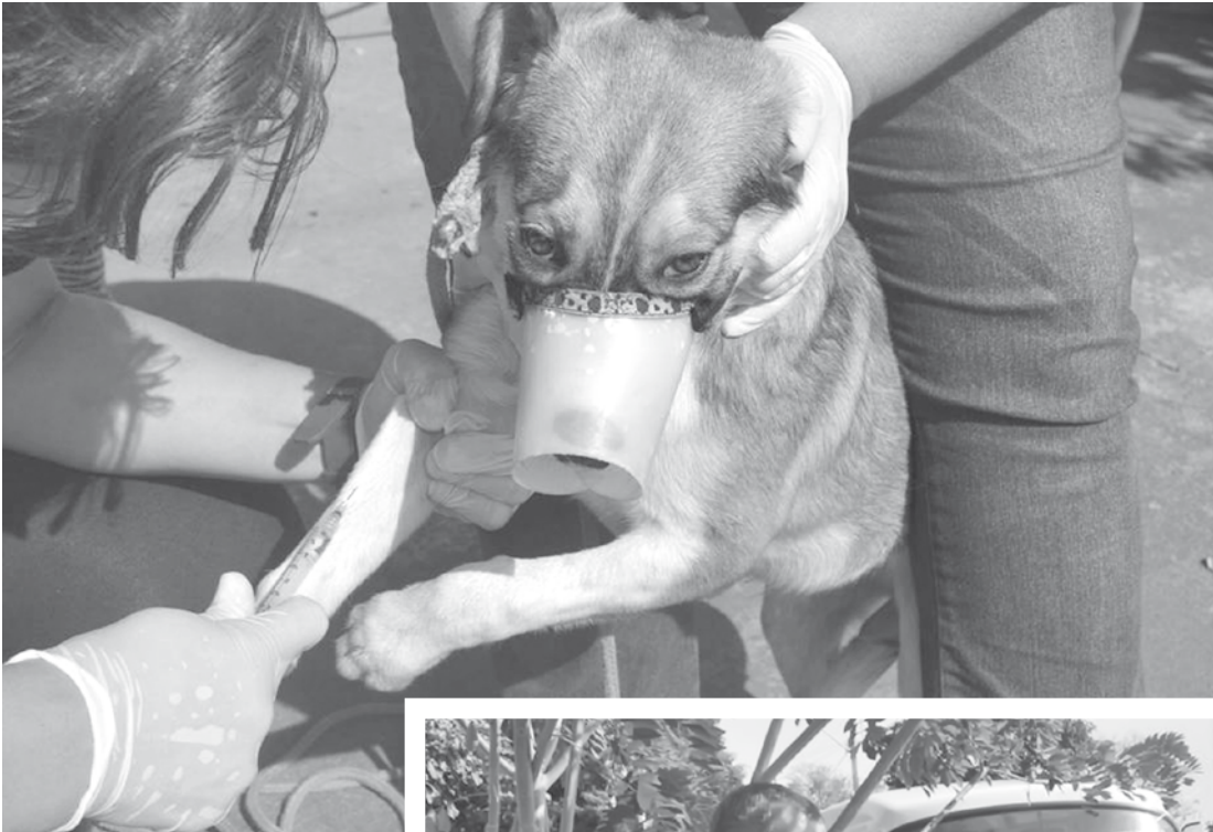
Há ainda mais dois dias para a coleta de sangue dos cães em Fernandópolis

A Secretaria Municipal da Saúde, por meio do Centro de Controle de Zoonoses da Vigilância em Saúde de Fernandópolis, realiza ao longo desta semana uma campanha de diagnóstico e combate à leishmaniose. A população tem ainda dois dias para levar seu cachorro para ser examinado. Na segunda-feira (08), a equipe esteve na Unidade de Saúde “Dr. Antonio Milton Zambon”, no Bairro Bernardo Pesbuto, e, na terça, no Jardim São Francisco. Ontem (10), das 8h às 11h30 e das 14h30 às 16h, o Centro Comunitário do Paulistano realizou o atendimento aos cães lá levados pela população. Hoje, dia 11, a coleta de sangue dos animais será na Avenida dos Eucaliptos, em frente a uma lanchonete do Bairro Araguaia. Amanhã, dia 12, último dia da campanha de diagnóstico e combate à leishmaniose, os exames serão para os animais do distrito de Brasi-tânia. Ao final, o material coletado passará por teste rápido realizado pelo Centro de Zoonoses. Os casos positivos de leishmaniose serão novamente examinados pelo IAL (Instituto Adolfo Lutz) para a confirmação da doença. Em