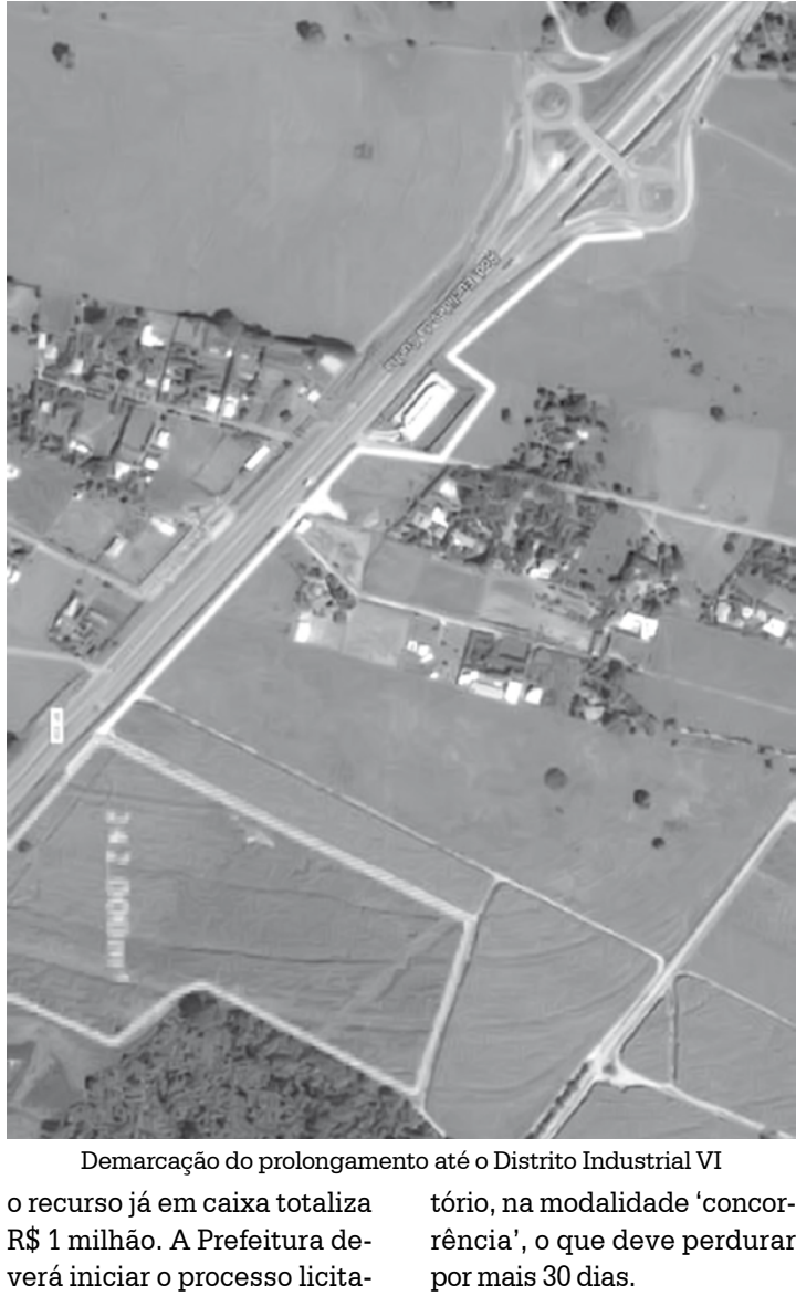
Demarcação do prolongamento até o Distrito Industrial VI o recurso já em caixa totaliza R$ 1 milhão. A Prefeitura deverá iniciar o processo licitatório, na modalidade 'concorrência', o que deve perdurar por mais 30 dias.

também aprovado na sessão desta terça-feira, foi o de nº 94/2016, de autoria do Executivo Municipal, que dispõe sobre autorização para abertura de crédito adicional especial, por excesso de arrecadação, no valor de R$ 1 milhão para execução do prolongamento da Avenida Marginal Litério Grecco, no sentido Fernandópolis/Meridiano, que beneficiará o Distrito VI, inviabilizado pela falta de alça de acesso viário. Serão implantados 3.331,21m² de pavimentação asfáltica, 2030,03m² de guias de sarjeta, 1.059m² de galerias de águas fluviais e 963m de cerca de arame farpado, além de 16 bocas de lobo. As obras foram liberadas através de convênio entre a Prefeitura de Fernandópolis e Casa Civil do Governo do Estado de São Paulo. Prevista para 4 etapas, a obra está orçada em R$ 4 milhões. A Marginal será prolongada em 1,8km, do Km 546 (pouco à frente do primeiro pontilhão) até a área destinada à implantação do Distrito Industrial VI, que fica a pouco mais de 1km do Posto Morini. Nesta primeira fase das obras,