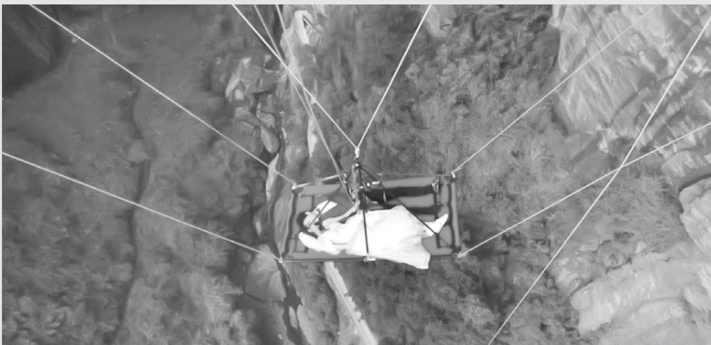
Chineses promovem ensaio de casamento em evento promocional, sob ponte de vidro a 180 metros de altura, em Pingjiang, província de Hunan.