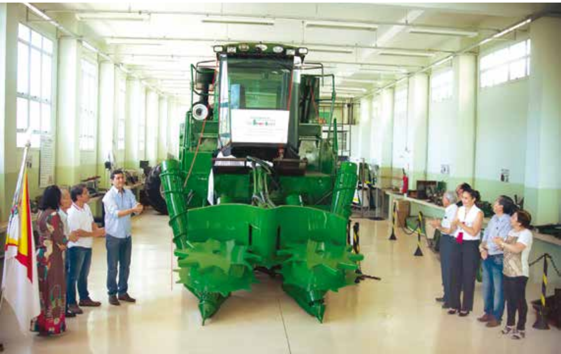
Emoção e agradecimentos marcaram a solenidade de doação