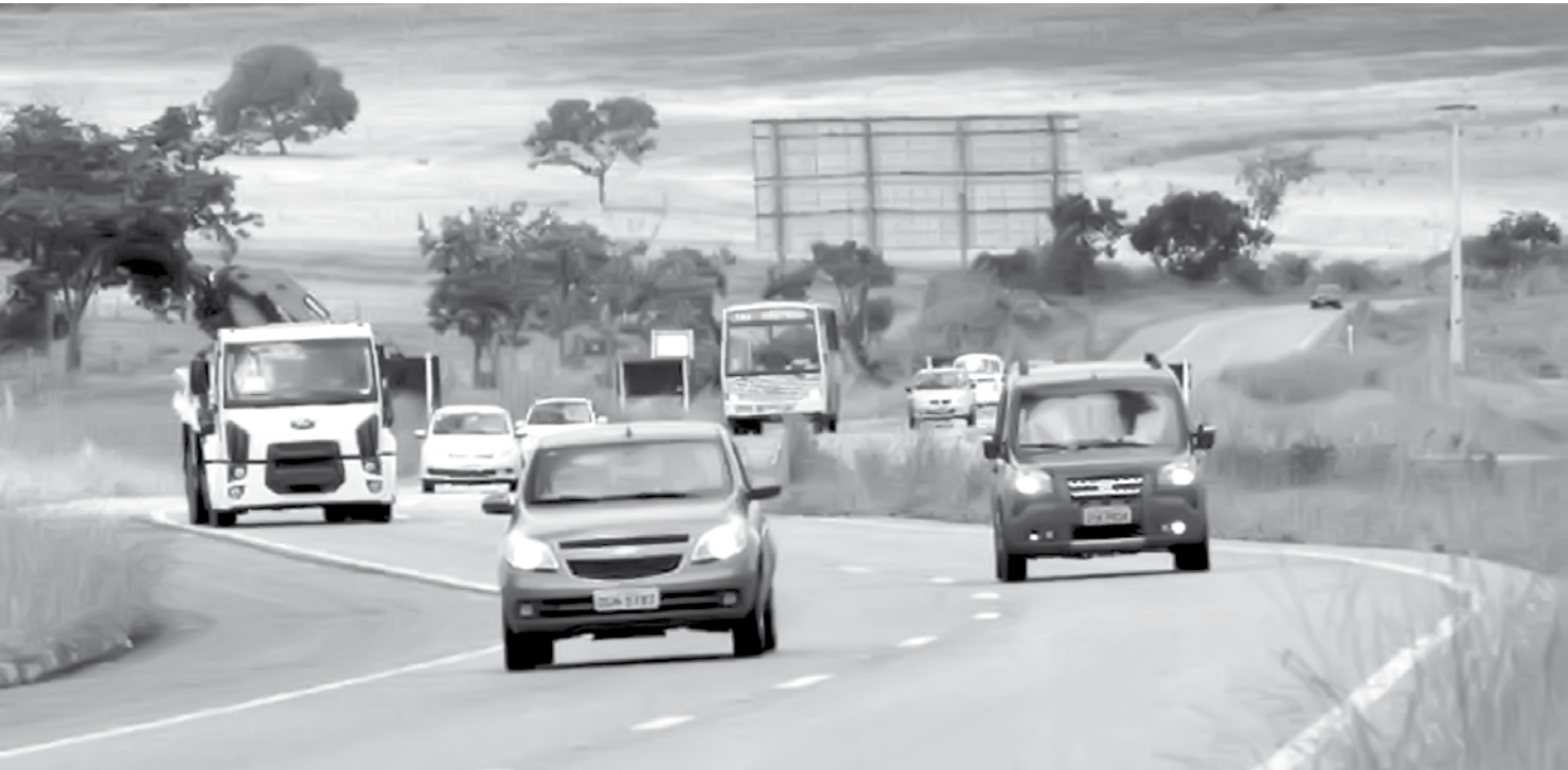
Lei que obriga uso do farol baixo completou um mês