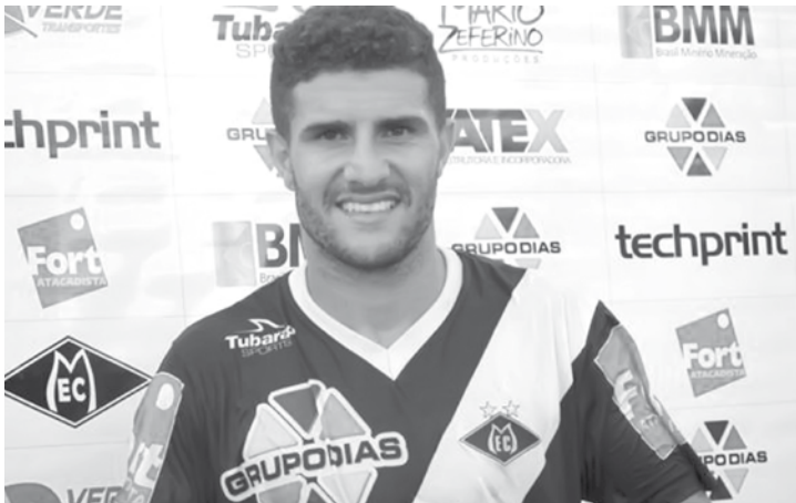
Fernandopolense em novo desafio na carreira, agora no futebol boliviano