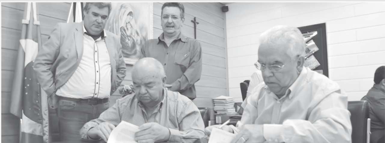
imagem da semana

AGORA É COM ELES - Ontem, sócios da Construmil Construtora e Terraplanagem assinaram o termo de transmissão com encargos das ações da ZPE. Toda a diretoria anterior renunciou e, definitivamente, agora é com eles, que têm 90 dias para pagar pela área. A Prefeitura só tem a responsabilidade de fiscalizar o andamento do projeto e o cumprimento das metas previstas.