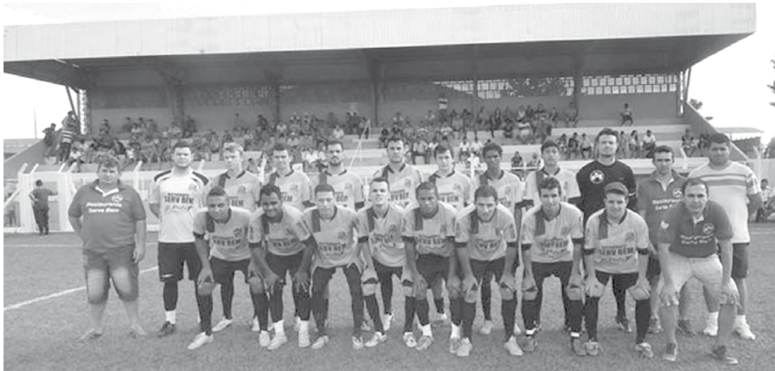
Restaurante Serve Bem F.C., de Fernandópolis

N o último domingo (07), teve encerramento a 4ª edição da Copa de Futebol Amador de Pedranópolis, denominada “Valdecir Della Rovere” (em memória). O evento esportivo, que contou com a participação de 16 equipes de 15 municípios, teve seu início no dia 26 de junho e as partidas foram realizadas no estádio municipal Prefeito João Carlos Estuqui, com entrada gratuita. Durante oito domingos foram realizados bons jogos, alguns emocionantes, com ótima presença de público. Nas