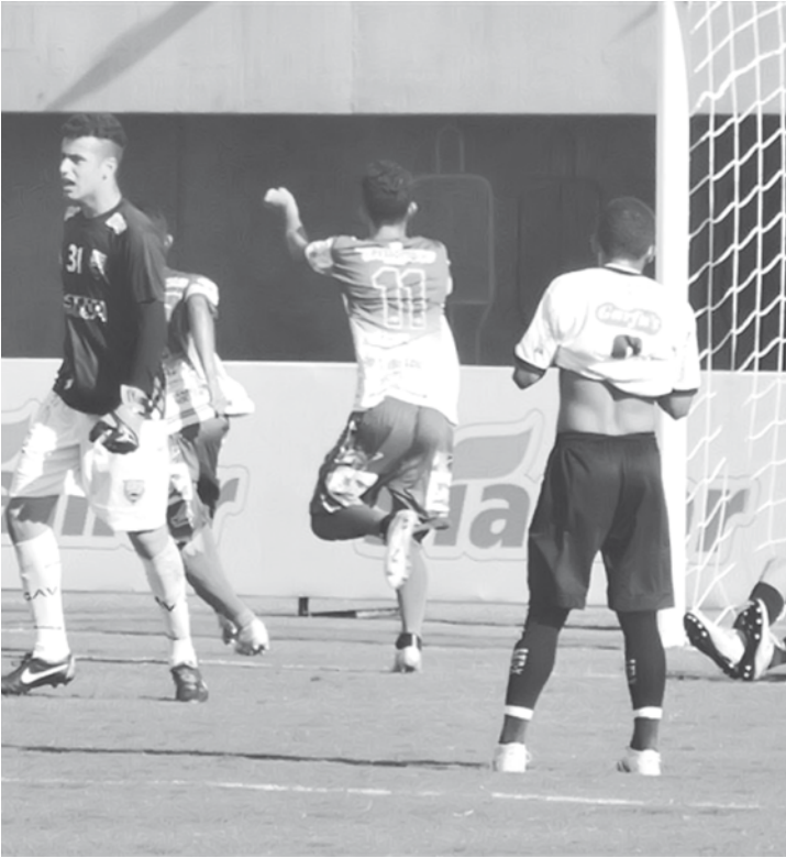
No primeiro turno, o Fefecê venceu o arquirrival na Arena Plínio Marin, por 4 a 0