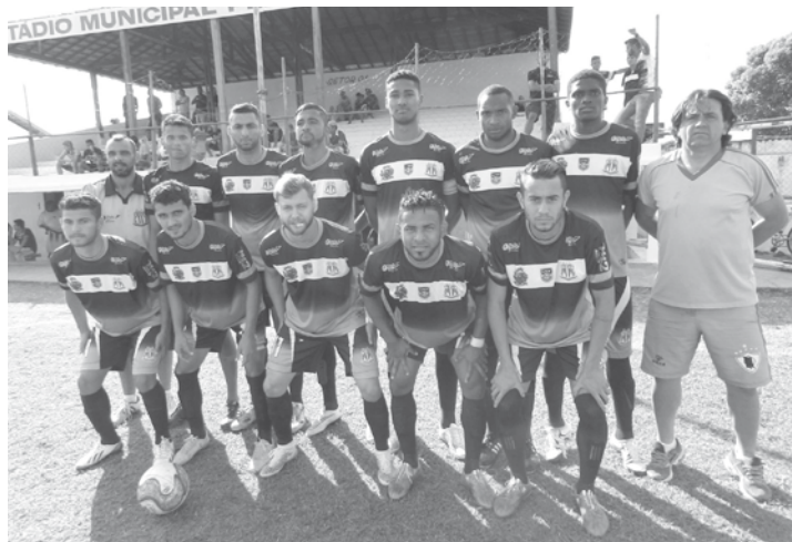
Equipe do Clube Esportivo Ouroeste, que venceu de 3 a 2, o Lions Futebol Clube