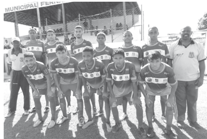
Equipe sub-18 de Ouroeste, que buscou um empate na primeira rodada do retorno

o regulamento da competição, classificam-se à segunda fase os quatro melhores colocados de cada grupo.